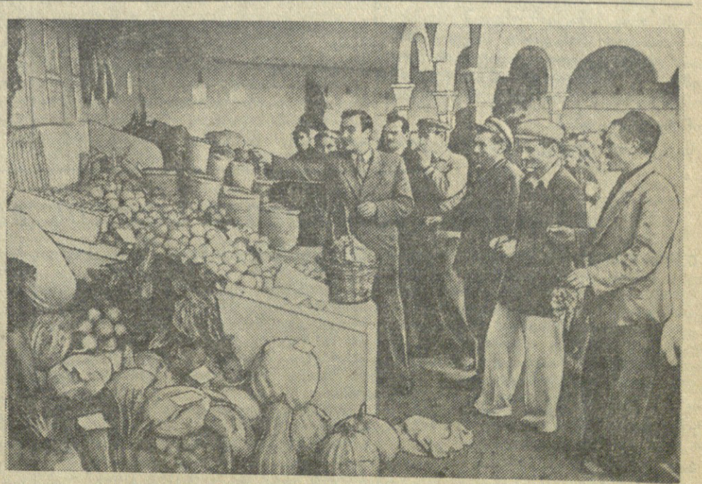
გარეგანი რაიონის სასოფლო-სამეურნეო მუშაობისათვის. 1. კოლმეურნეობის ავტომატიზაცია... 2. სოფლის მარტოვის სტალინის სახელობის კოლმეურნეობის მემკვიდრეობის სტენდანი.