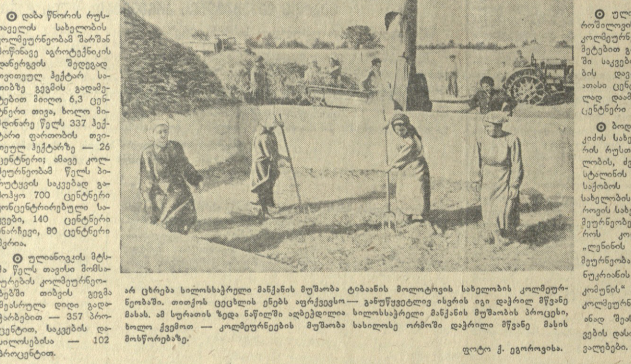
არ ცხრება სილოსაბურთი მანქანის მუშაობა ტბისა და მდინარის სანაპიროს კომუნურებში...