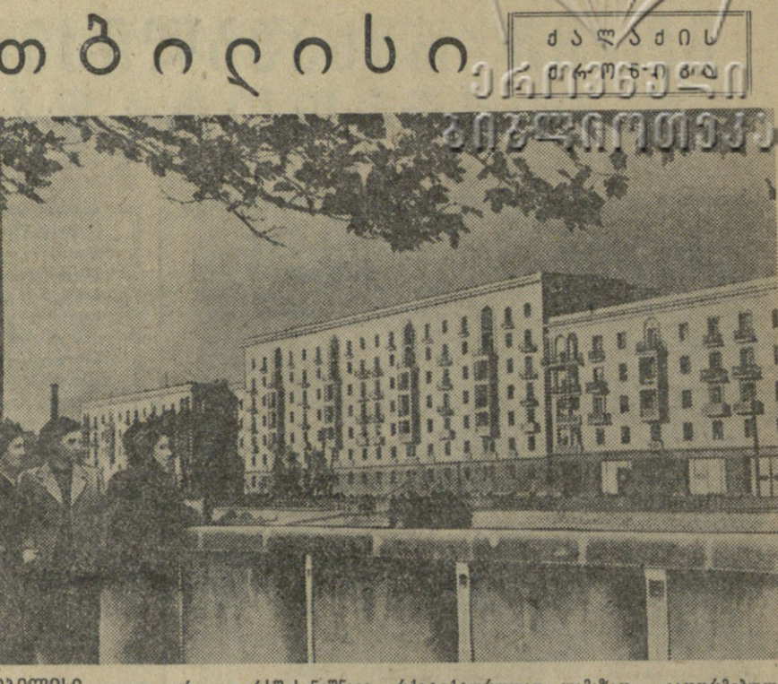
თბილისი. კიდევ ერთი დირხმანისა, არქიტექტურულად ლამაზად გაფორმებული და კეთილმოწყობილი ნაგებობა შეიქმნა დღევანდელი შენობით. ამ დღევანდელი მტკიცის მარცხენა ნაწილზე მშენებლობა ხარამბის ჩამოხსნის ყველაზე უფროდ — 123-ბინიან საცხოვრებელ სახლს. სურათზე: 123-ბინიანი საცხოვრებელი სახლი.

იაკონია-აბიჯის უმართავი უბანის ბაზის გაშვების გამო. იაკონია-აბიჯის უმართავი უბანის ბაზის გაშვების გამო.