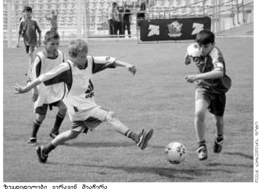
ზუგდიდლები ვერაინ შეარჩნა

გუშინ ბავშვებს დიდი ზეიმი ჰქონდათ. "ლოკომოტივის" ოთხად გაყოფილ სტადიონზე პატარები ამერ-იმერიდან ბურთს ისეთი აზარტითა და ოსტატობით დასდევდნენ, უჭყველია, რამდენიმე მათგანი-სთვის მაინც ფეხბურთი ცხოვრების განუყოფელი ნაწილი გახდება. შესაძლოა, ზოგიერთმა დიდი ფეხბურთიც ითამაშოს. ვინ იცის, იქნებ საქართველოში გოგონებს ფეხბურთმაც სერიოზულად მოიკიდოს ფეხი. ყოველ შემთხვევაში, ფეხბურთზე აღდენი შეყვარებული გოგონა ერთად მხოლოდ შარშან ვახტანგ, ისიც, "ფოქს კიდის" დამსახურებით. წლებული საქართველოს მეორედ ერგო "ფოქს კიდის" თანის საფეხბურთო ჩემპიონატის მასხინძლობის უფლება, ჩემპიონატისა, დონლის ფინალურ ეტაპს პარიზის რისნიელდმთან არსებულ ინგლისის პრემიერლიგის ბინადრის "მანჩესტერ უნიტედის" საფეხბურთო ბაზა უმასპინძლებს. პარიზის მინდგრებზე კი მსოფლიოს 16 ქვეყნის მოზარდს ელიან, მათ შორის – საქართველოდანაც. თუ ვის უნდა დარჩენოდა მსოფლიო ჩემპიონატის ფინალურ ეტაპზე ასპარეზობის უფლება გუშინ სწორედ ამის გასარეკვევად ვენჭვიეთ "ლოკომოტივის". იქ კი საქაღაურ ჩემპიონატებში გამარჯვებულ რუსთაველ, ფოთელ, ზუგდიდელ, ოზურგეთელ, ხონელ, სენაკელ, ბორჯომელ, ნინოშინდელ, თელაველ, საგარეჯოელ, ლაგოდეხელ, ახალციხელ, ბოლნისელ, ჭიათურულ, ზესტაფონელ, ჩხორწყელ, ნალენჯიხელ, გორელ და ხაშურელ ბავშვებსა და მათ მშობლებს მიუხაროთ თავი. აქვე იყვნენ მასპინძლართილი სმი გამარჯვებული გუნდე-