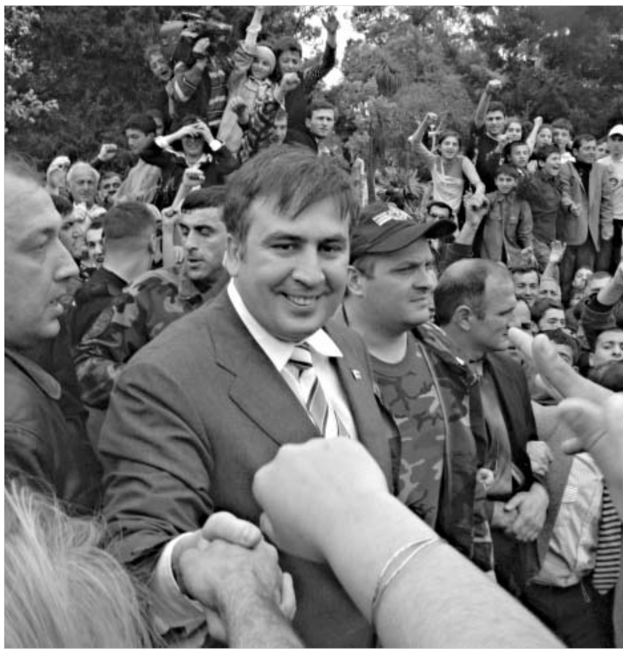
მას შესანიშნავად ესმის, რომ თანამედროვე პოლიტიკა ქუჩებსა და მოედნებზე ხალხთან უშუალო საუბრის დროს კეთდება.

კადიროვი რუსეთის ფედერაციის ყველაზე დაუმორჩილებელი სუბიექტის თავაკაცი გახდა იმის მიუხედავად, რომ რუსი სამხედროები და სპეცსამხურები ამის წინააღმდეგ იყვნენ. ისინი ამაოდ ცდილობდნენ კრემლის ყურადღე-