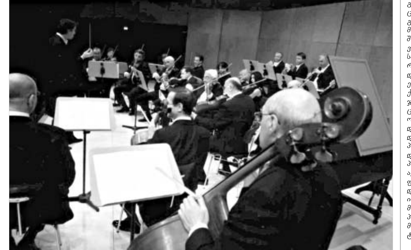
40 წლის ორკესტრი.