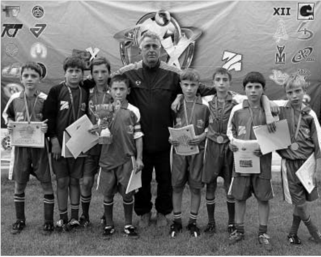
ფოქსკიდის ტურნირის გამარჯვებული გუნდები ზუგდიდის "ოდინი" და ლანჩხუთის "გურია".