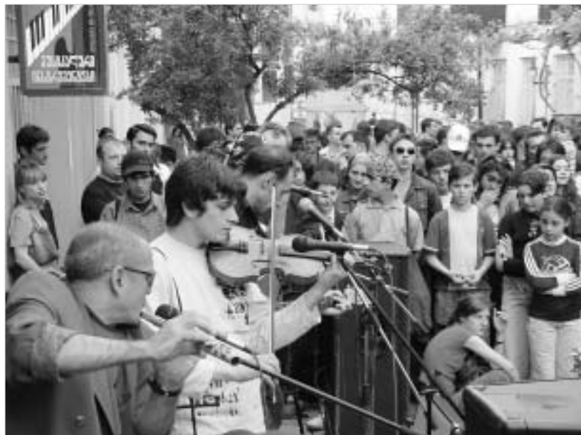
ეს მუსიკოსები თავს ყველაზე კარგად ქაჩაში გრძნობენ