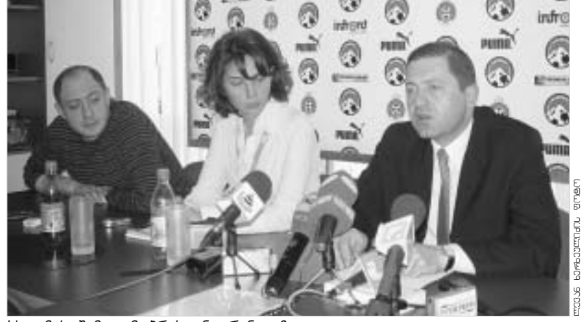
სხდომის შემდგომ პრესკონფერენციაზე