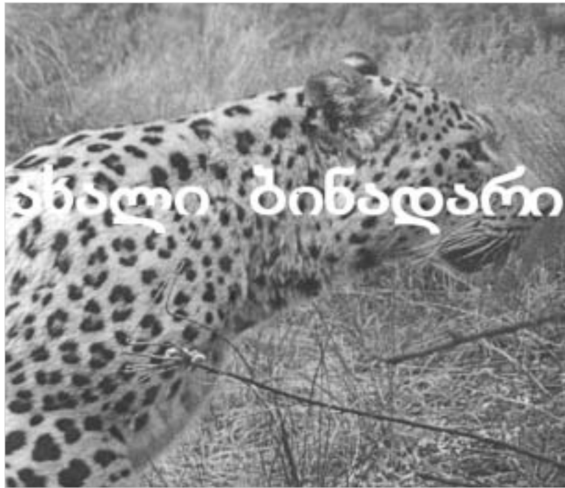
ვეფხისა და მოყვის ახალი ვერსია

სემინარები და ვორკშოპები კურატორული საქმიანობის სფეროში “მადის”, ანუ “მედი არტ ფერმის” მიერ მონაწილეობა გერმანელმა და შვეიცარიელმა სპეციალისტებმა ჩაუტარეს უკვე არსებულ, თუ მომავალ კურატორებსა და, რასაკვირველია, მხატვრებს. სემინარების პროგრამა, რომელსაც ასე ერქვა: - “ძიება სახელების გარეშე” - ორ კვირას გაგრძელდა, და გუშინ “გოეთეს ინსტიტუტში” დასრულდა, რის შესახებაც დანერგებით ინ-