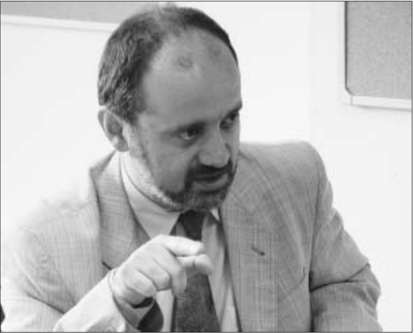
ომხუდსმენს შეგიძლიათ დაუკავშირდეთ მუხატობით. ტელ: 20 24 24 ან ნებისმიერ დროს ელ-ფოსტით: niadaria@24hours.ge