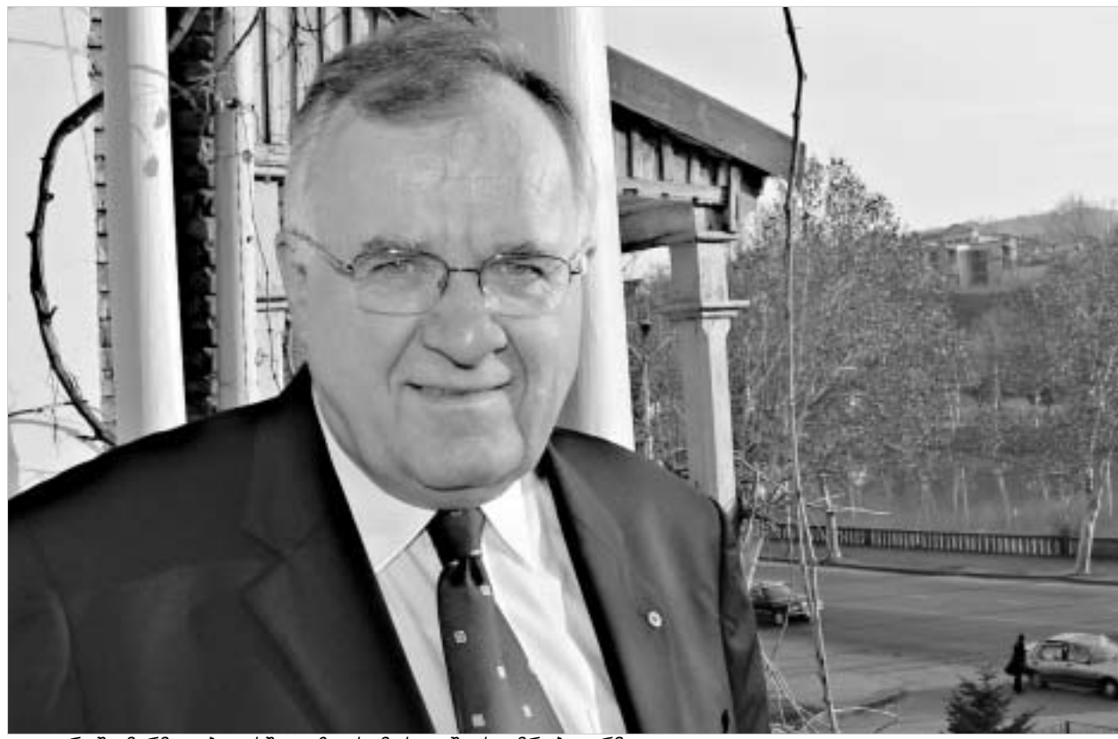
ვალტარ შვიმარმა თბილისში ვიზიტს მოსკოვი სტუმრობა არჩია.

- ასლან აბაშიძე - ეს უკვე რუსეთის შიდა საკმეა. რუსეთი თავად იღებს გადაწყვეტილებას, ზოგს საკუთარ ტერიტორიაზე ყოფნის უფლე-