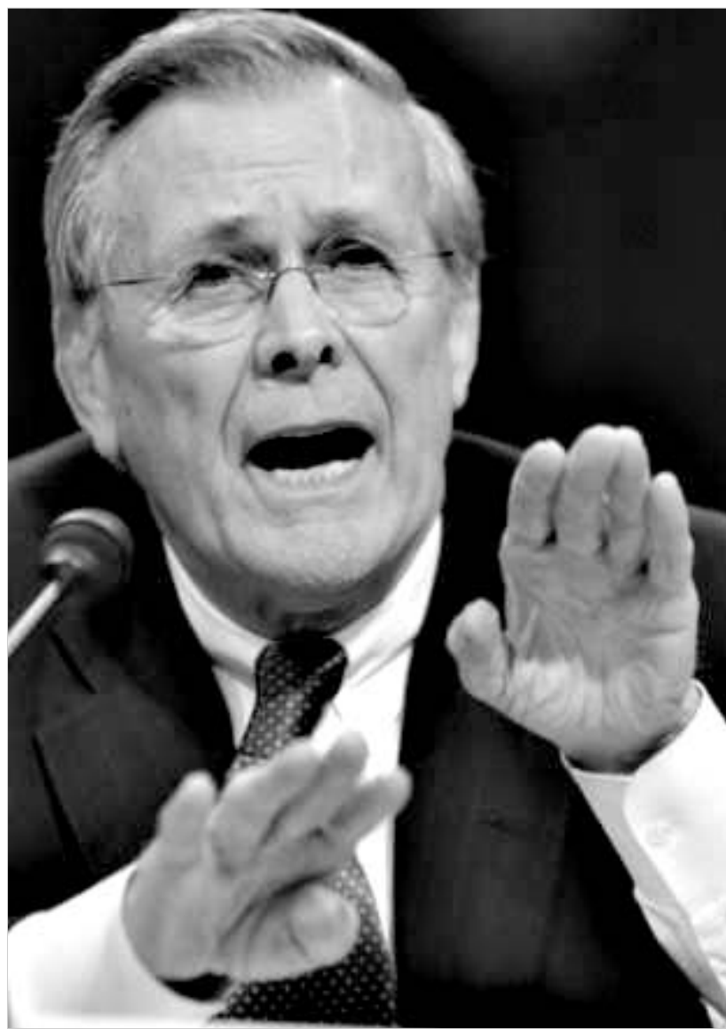
დონალდ რამსფელდი ბრალდებას უარყოფს.

ამერიკელი ჟურნალისტი ასხენებს საიდუმლო პროგრამას, რომელიც თითქოსდა, დაკითხვებზე პატიმართაგან არაპუშმანური შეთხვევების გამოყენებით ინფორმაციის მისაღებად გამოიყენებოდა. ობიექტები კი შეიძლება ყოფილიყვნენ ყველანი, ვინც ტერორიზმთან ბრძოლაში ამერიკელთათვის ინტერესს წარმოადგენდა. სტატიაში ნათქვამია, რომ პროგრამა აშშ-ს პრეზიდენტის ეროვნული უსაფრთხოების მრჩეველის კონდოლიზა რაისის თანხმობით, საკმაო ხანია, რაც შემუშავდა (თავდაპირველად, გამიზნული იყო მისი ავღანეთის ტერიტორიაზე გამოყენება). თავად თეთრი სახლის პირველი პირიც