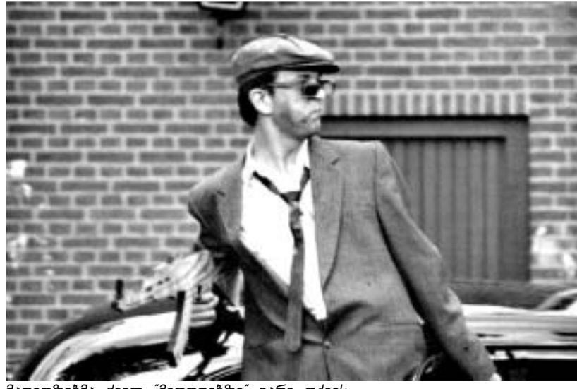
მავითი ზეგმა ძველ "მეთოდებზე" უარი თქვა.

ახალი სტრატეგიის მიზანია ძალიან მაღალი ტარიფების შემცირება, მაგრამ, ამავედროულად, მფარველობის პატარა მალაზიების მფლობელებზეც გავრცელდება.