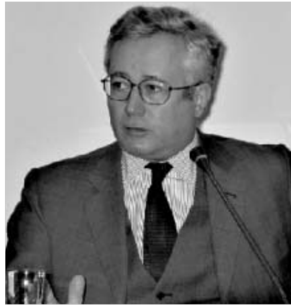
ტრემონტის გადადგომამ იხალისის პოლიტიკურ წრეებში შოკი გამოიწვია.

სამთავრობო კოალიციის პარტნიორებთან დაძაბული მოლაპარაკებების შემდეგ, იხალისი ეკონომიკის მინისტრი ჯულიო ტრემონტი დაკავებული თანამდებობიდან გადადგა. ეკონომიკის მინისტრობის მოვალეობას დროებით იხალისის პრემიერ-მინისტრი სილვიო ბერლუსკონი შეასრულებს.