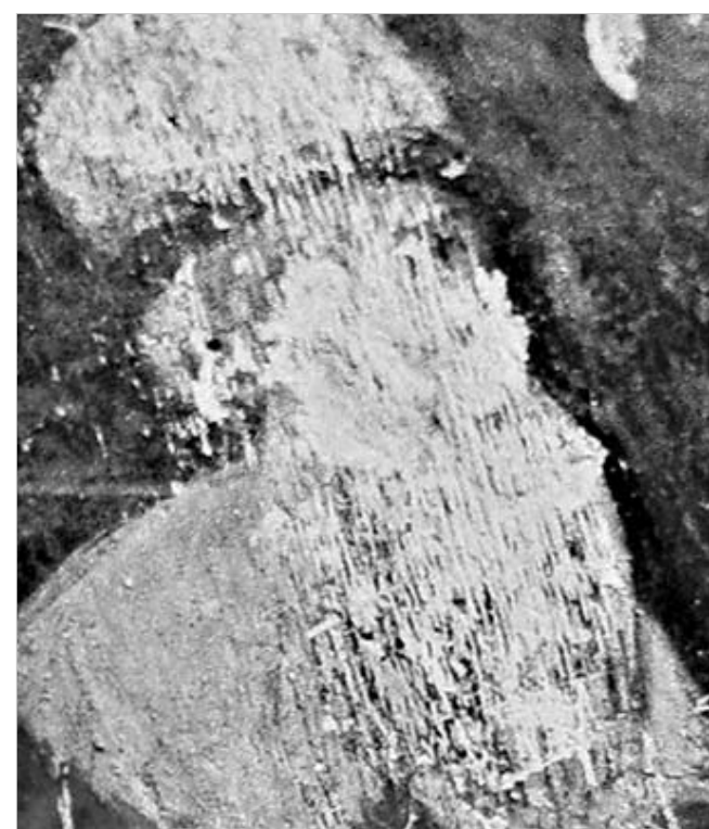
ასე გამოიყურებოდა რუსთაველის ფრესკა (მარცხენი) და ასეთ დღეში ჩააგდეს იგი ვანდალებმა (მარჯვნივ).