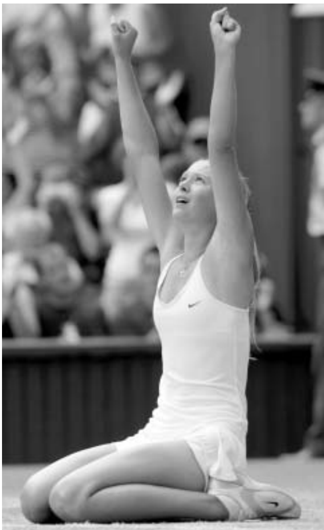
შარაპოვამ სენსაციური მოხდენა შექმალა.

მაყურებლები ალტაცებებს ვერ მალავდნენ და ტაშს მამიანაც უკრავდნენ, როდესაც საჭირო არ იყო. ბორის ელცინმა სპეციალური მოლოცვა გაუგზავნა შარაპოვას, სადაც ეწერა, რომ ბორის ელცინი თავისი პრეზიდენტობის წლებშიც კი არ