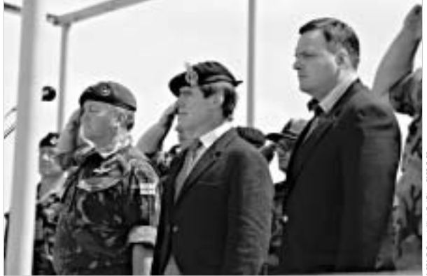
ბრიტანელი სამხედროები საქართველოში 16 ივლისამდე დარჩებიან და შემდეგ ავღანეთში გაემგზავებიან.

გუბნი ვაჟიანის სამხედრო პოლიგონზე ერთობლივი ბრიტანულ-ქართული სწავლების გახსნის საზეიმო ცერემონია გაიმართა. მასში მონაწილეობდნენ საქართველოს თავდაცვის მინისტრი გიორგი ბარამიძე და დღი ბრიტანეთის საგანგებო და სრულუფლებიანი ელჩი საქართველოში დონალდ მაკლარენი. სამხედრო სწავლების პირობითი სახელწოდებაა "საქართველო-ეკსპრეს-2004". მასში ჩართულია ბრიტანეთის შეიარაღებული ძალების ორი ასეთული (164 სამხედრო მისიამხალურე), კომანდოს ბატალიონის ერთი ასეთული, პლუს გენშტაბის 20 ოფიცერი და ვერტმფრენების ესკადრონი.