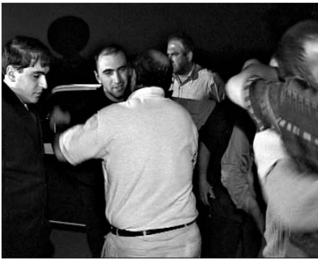
უშიშროების სამსახურის გათავისუფლებულ თანამშრომლებს ახლობლები და ოჯახის წევრები ხვდებიან.

საქართველოს ძალადობრივი უწყვეტი ციხეების რეგიონის ფაქტობრივი ხელისუფლების მიერ დაკავებული, საქართველოს უშიშროების სამინისტროს სამი თანამშრომლის გასათავისუფლებლად სპეცოპერაციის ჩატარებას გეგმავდნენ. თუმცა, რადიკალური ზომების მიღება საჭირო აღარ გახდა, კოკოითის ხელისუფლებამ დაკავებულები გაათავისუფლა.