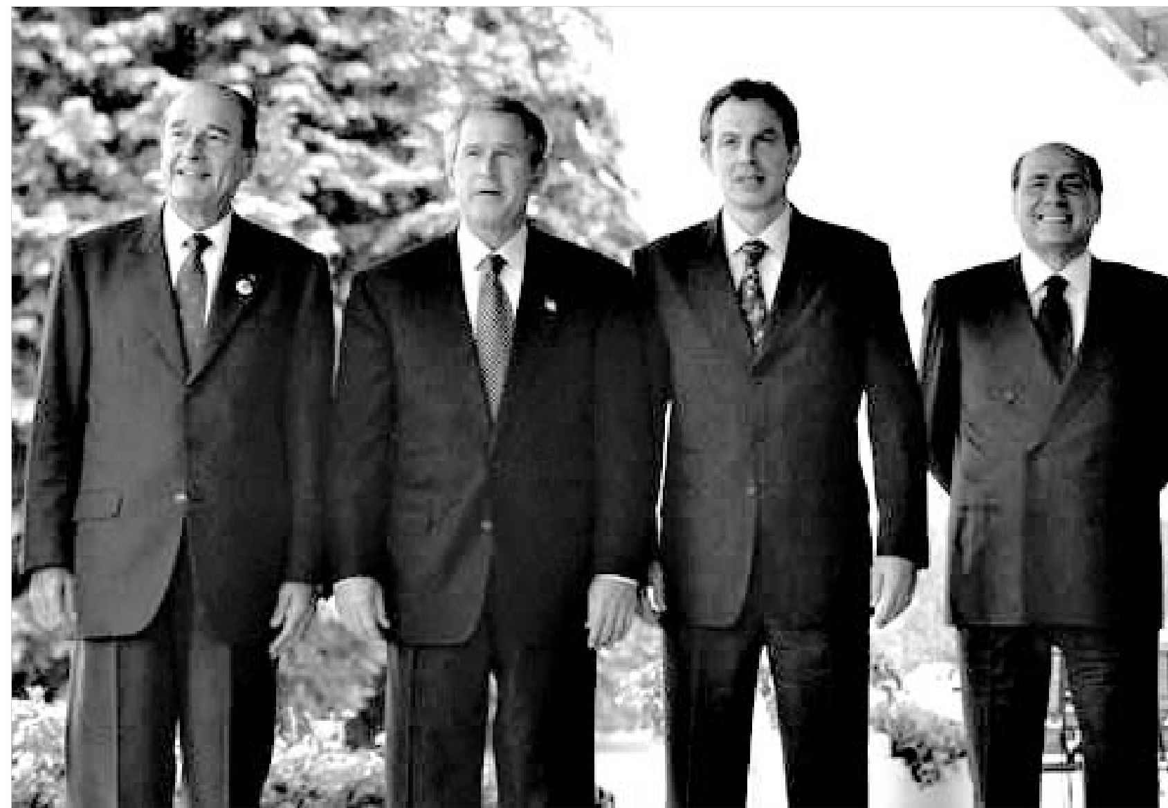
ჟაკ შირაკი, ჯორჯ ბუში, ტონი ბლერი და სილვიო ბერლუსკონი.

ევროკავშირის ახალი კონსტიტუციის პროექტი, შესაძლოა, იმდენად მოუქნელი იყოს, რამდენად მიმხილველიც აშშ-ს კონსტიტუცია გახლავთ. თუმცა, სწორედ ამ ფაქტის გამო შეიძლება მოიხონონ ის ბრიტანელმა სკეპტიკოსებმა, რადგან ახალი კონსტიტუცია ევროკავშირს ამერიკის შეერთებულ შტატებზე მეტად აქცევს არ უნდა. რაც შეეხება რეფერენდუმზე კონსტიტუციისთვის ხმის მიცემას, როგორც დიდი ბრიტანეთის პრემიერ ტონი ბლერი აღნიშნავს, ეს ეროვნული ინტერესებისათვის ხმის მიცემა იქნება.