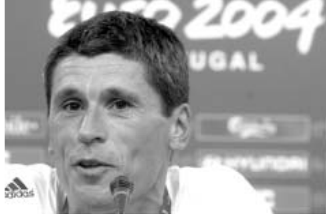
მარკუს ბერკი მარკუს ბერკის მითითებითაა იმსახურა.

ევროპის ჩემპიონატის ფინალურ მატჩამდე მთავარმა მსაჯემ, გერმანელმა მარკუს ბერკმა ურნალისტების შეკითხვებს უპასუხა. მან აღიარა, რომ, სხვა ფინალისტების ფონზე, ამ ფინალს განსაკუთრებულად არ მიიჩნევს. ურნალისტებს, ბუნებრივად, აინტერესებდათ, როგორ მოიქცევა ფინალში მერკი, რომელსაც საბერძნეთის ნაკრების მთავარი მწვრთნელის, ოტო რეპაგელის ახლო მეგობრად იცნობენ.