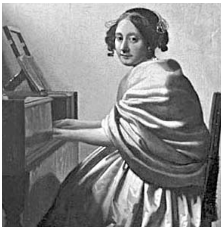
ვირჯინელთან მჯდომ ახალგაზრდა ქალი

დამთავალიერებულთა თავებსა და მხრებს შორის შემთხვევით თუ მოპურათ თვალს ნათელ, მონაც-რისფრო ციალს. ყველა ამ ცარიელ, დიდ, შავ კედელსა მიმწყდარი, მი-უხედავად იმისა, რომ იქით-აქით კედლებზე შესანიშნავი ტილოები კიდა. ეს ტილო, რომელიც საზო-გადოების გაცხოველებულ ინტერ-ესს იხვევს, სულ პატარაა, 20X25,2 სანტიმეტრის ზომისა. ლუდვიკო მეთოთხმეტის დროინდელ მოქ-როვილ ხის ჩარჩოში ის თითქოს მთლიანად იკარგება.