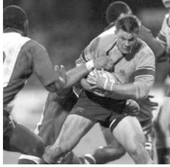
ასტრალიელებმა მეზობლები დაიბრუნეს.