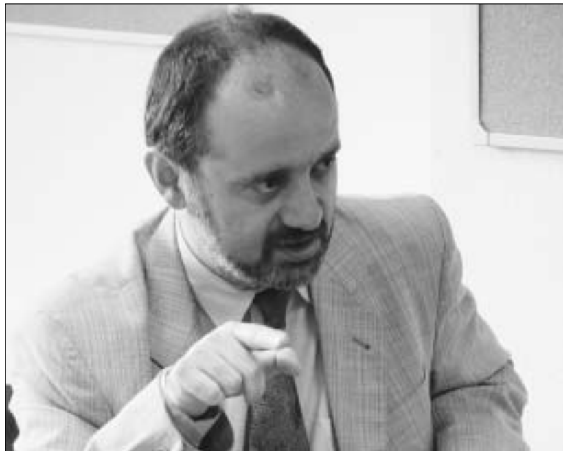
ომბუდსმენს შეგიძლიათ დაუკავშირდეთ შაბათობით. ტელ: 20 24 24 ან ნებისმიერ დროს ელ-ფოსტით: niladaria@24hours.ge