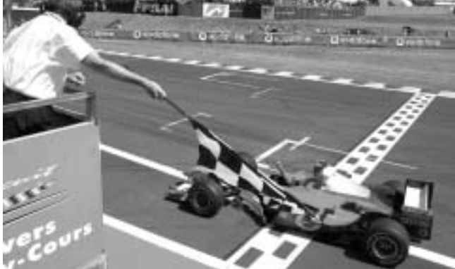
ფინიშის სწორზეა შემხვერი.

საკვირაო რბოლის წინ ცენტრალური საფრანგეთის ცას არაფერი ეტყობოდა იმისა, რომ მანი-კუარის კლასიკულზე თავმჯივრით ქოლგების გამოა დასრულდებოდა. საფრანგეთის დიდი პრიზიც ისე მიიღია, რომ საფრანგობებს საწვიმარ საბურთავებზე გადაწყობაში დრო არ დაუბარავდათ. იყო ცხელი და მშრალი ამინდი. ბევრად ცხელი კი იმითვის, ვინც კომბინიზონებსა და ჩაფუტებში გამოწყობილინი მწკანე შეუსის მოლოდინში სოკიტებში იხარშებოდნენ. თავისა მზებზე გავერგარებულ ტრასაზე ცელსიუსის 43 გრადუსს უკაკუნებდა. ამ დროს კი ლა მანის მცირე მხარეს უიმბლდონის კორტებზე ვაფთა ფინალური დაპირისპირება წვიმის გამო არავითხელ შეწყდა.