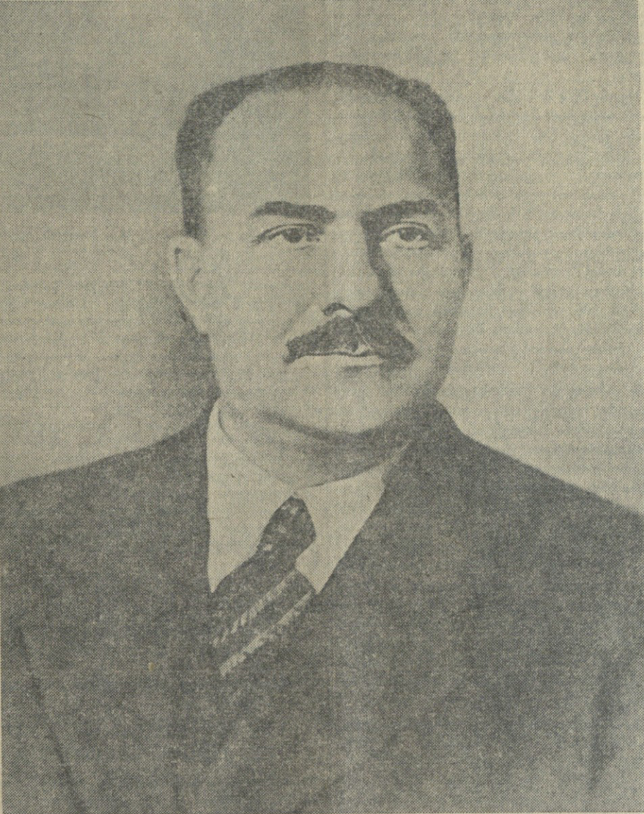
აახანავ ლაჯარე მოსეს-კი კავანოვიჩს

გაუმარჯობანი არტილერიის დარგში. დიდ რუს ხალხს გულუბნის პრიორიტეტი კლუბები და სწრაფსასროლი, სავეულე მძიმე არტილერიის, ნაოსტაქყარცის, ბეკათმეტრული აპარატურისა და მთელი რიგი სხვა ტექნიკური სახსრების შექმნაში.