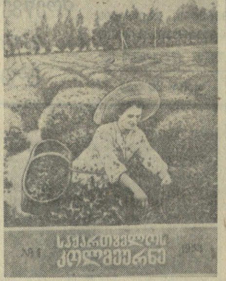
ს.ს.ხ.შ.მ. (საქ. კორ.)