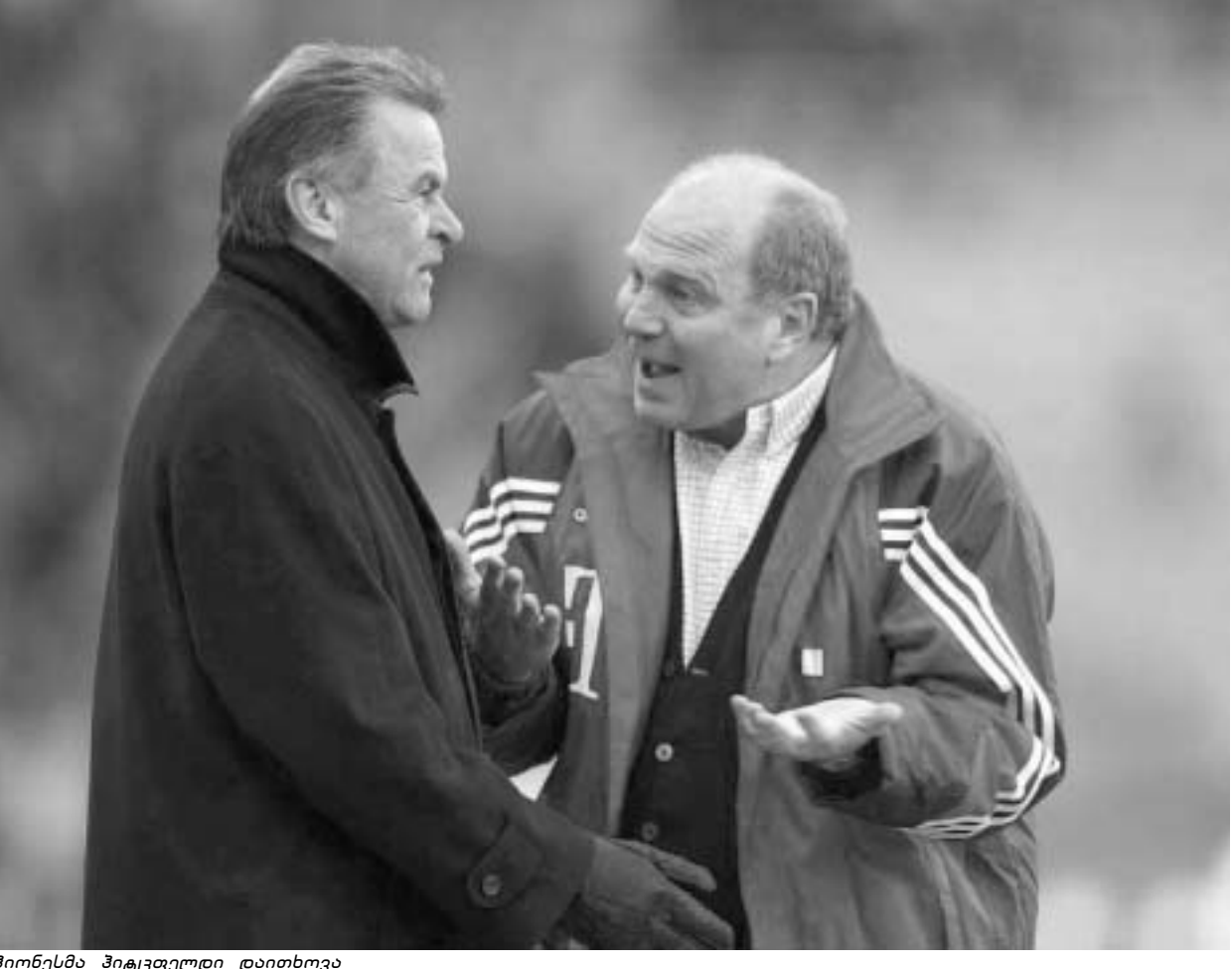
ჰიონესმა ჰიცფელდი დაიხმავა

იელისიდან "ბაიერს" ფელიქს მაგატი უხელმძღვანელებს