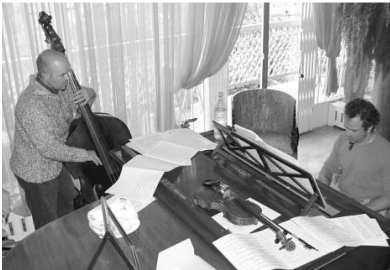
ძმები პიუბენერების დეატი

გრემის კიდევ ერთი ნომინანტი და, რაც მთავარია, ლაურეატი - ბენდ რუფი, გერმანიელი კლარნეტი