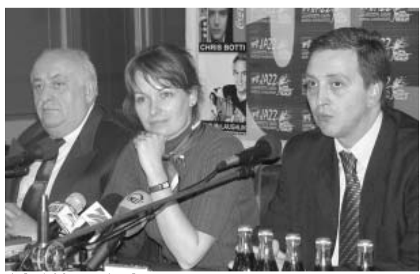
ისინი ჯაზმა გაერთიანა

ყოველი ფესტივალის მონაწილეთა წარმომადგენლებზე, ბუნებრი-