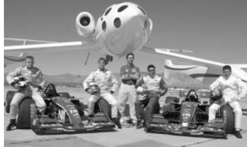
ჩემს კარის ვარსკვლავები სარბოლ და კოსმოსურ ბოლოდებთან პოზირებენ

საგამოცდო გაფრენისას კომპანიის ხომალდმა "საქსნიტან" 64-კილომეტრის სიმაღლეზე გაიფრინა, სადამდე მანამდე კერძო კომპანიის მიერ შექმნილი საფრანკის აპარატს არასოდეს მიიწვინია.