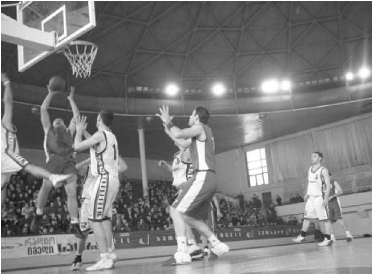
"დინამოს" ჩემპიონობამდე ერთი ნაბიჯი აშორებს

მეორის მსგავსად, მესამე მეოთხედშიც ბათუმელებმა მოიგეს და ბოლო მეოთხედილისთვის ისინი მხოლოდ ორ ქულას აუტყდნენ. გადაწყვეტილებით ნიშნულში "დინამოს" მდგომარეობას ისიც ართუ-