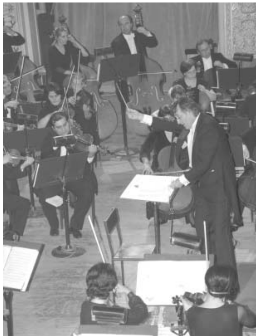
ორკესტრი შტრაუსის ასრულებს

ამჟამად ორკესტრმა საქართველოში ახალ ტრადიციას ჩაუყარა საფუძველი. კომპოზიტორმა მასშტაბური საოპეროლო საღაპრები ჩვენ-