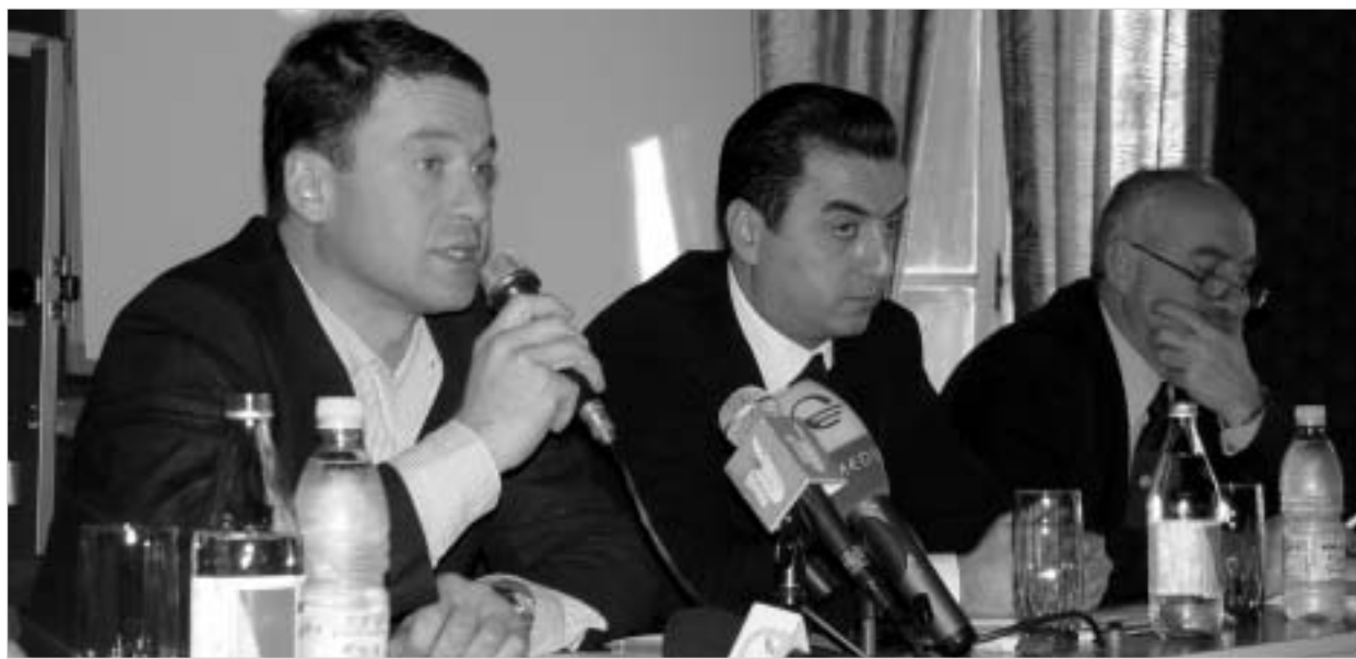
ქარხნის რეაბილიტაციის მმართველი პასიურ ფიგურად ყოფნას არ აპირებს.