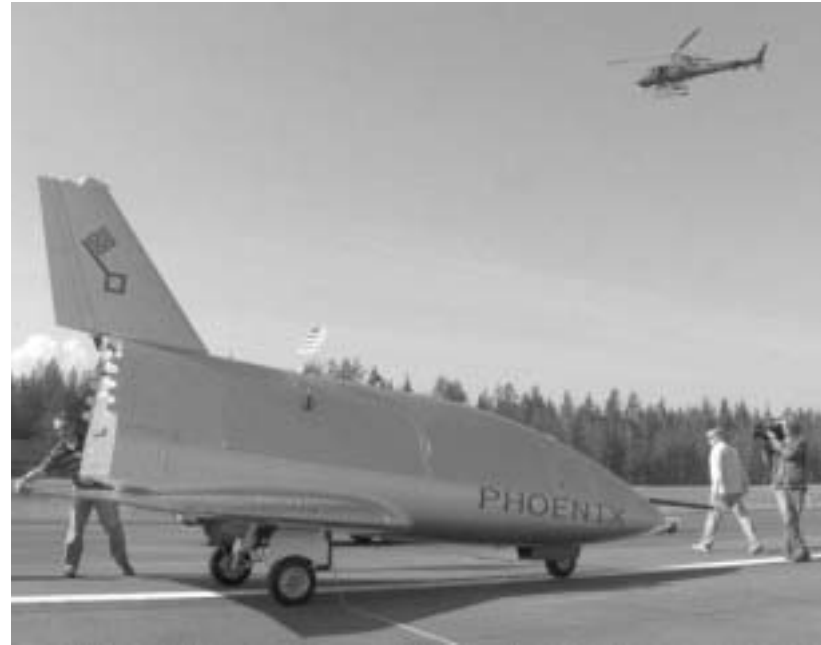
ფინიქსმა პირველი გამოცდა წარმატებით ჩაატარა

თუ ეს ექსპერიმენტებიც წარმატებული იქნება, აპარატს მოამზადებენ იმისათვის, რომ მან 25 კილომეტრის სიმაღლიდან შეძლოს გაოცდის ჩაბარება.