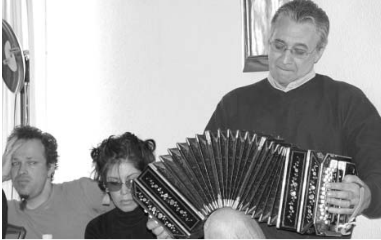
რაულ ხაურენა ბანდონიონით

ის ცნობილ კუბელ კლარნეტისტთან პაკიტო დი რივერასთან ერთად 2002 წელს გახდა გრემის ლაურეატი ნომინაციაში "საუკეთესო ალბომი ჯაზისა და კლასიკის შესაყარზე".