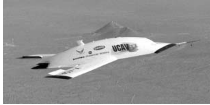
X-45 პირველ საბრძოლო დაეალებას ასრულებს

ლოტი თვითმფრინავებს სრულფასოვნად შეუძლებათ დღეს გავრეცელებული, პილოტირებადი საბრძოლო საფრენი აპარატების შეცვლა. ფიდერისანერზე ჩანს, როგორ უახლოვდება სამიზნე უძრავ ავტომობილს ბომბი და როგორ აყრიან მას", - განაცხადა პროექტის ხელმძღვანელმა რომ პორტონმა.