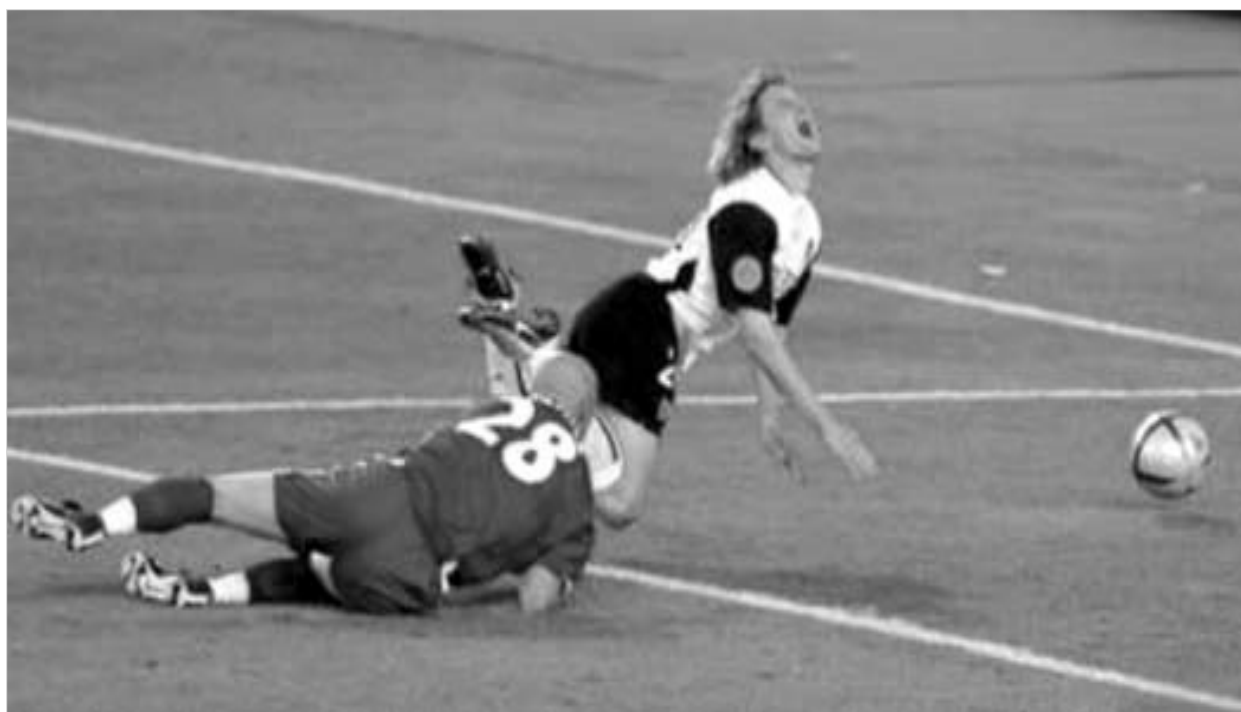
ბარტუზის საბედისწერო შეცდომა.