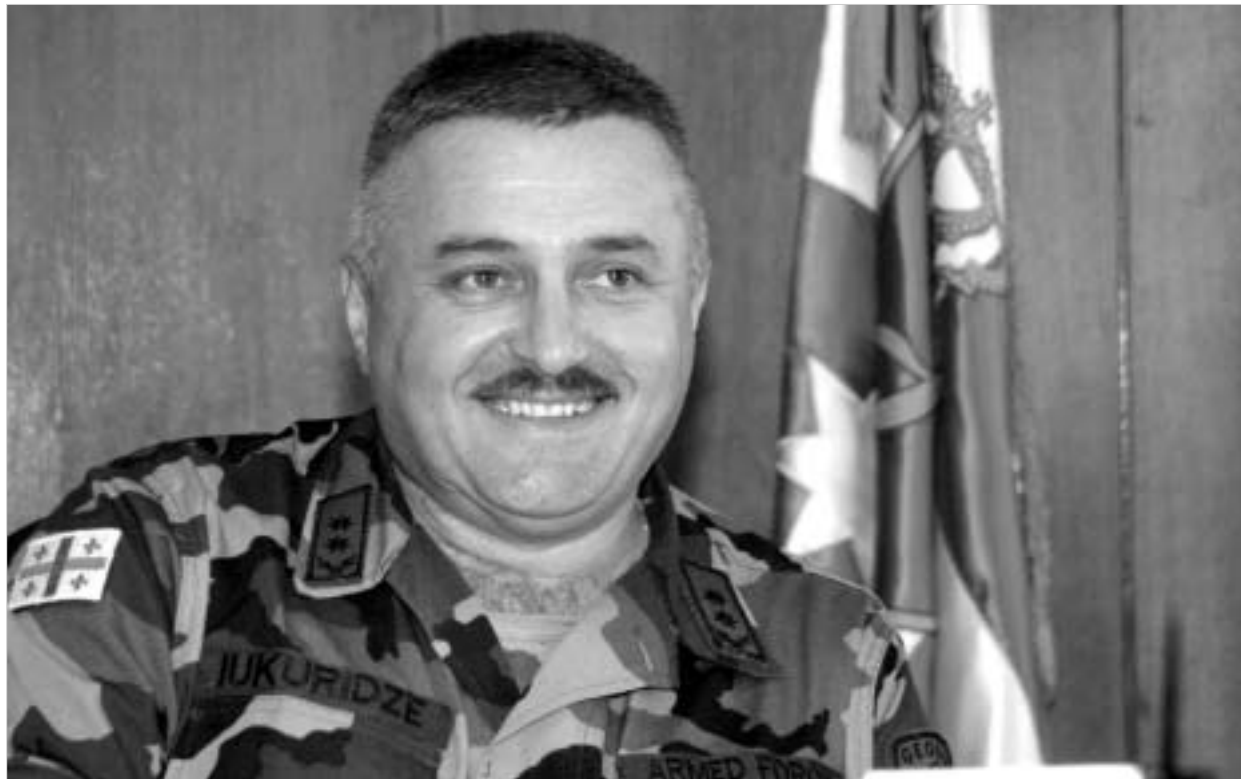
გენერალ-ლეიტენანტი გივი იუკერიძე