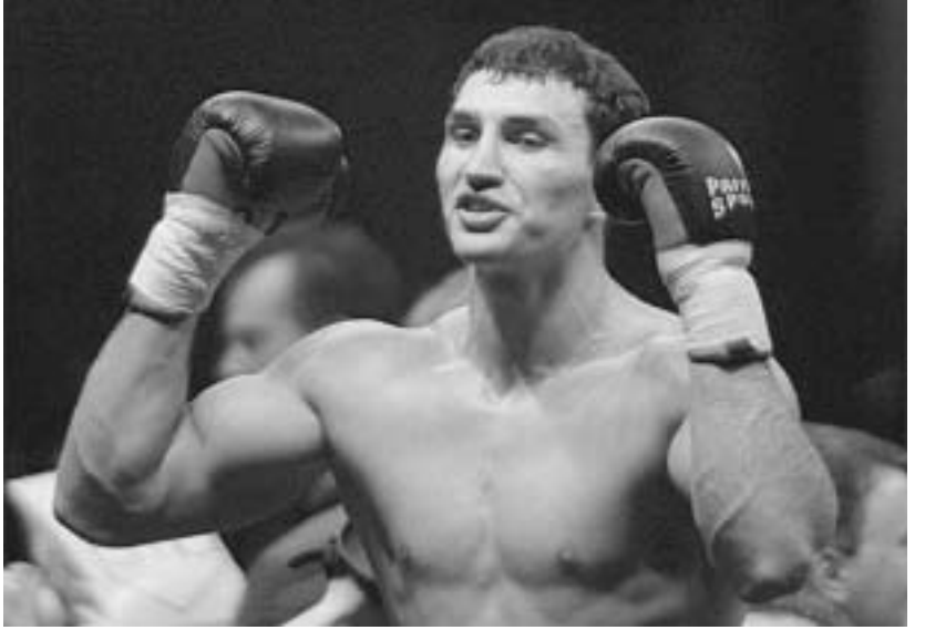
ელადიმირ კლიჩკოს რინგზე არ უშვებენ

ელადიმირი კი გერმანელმა მწრთნელელობაში სხვა მიზეზებს ხედავს და ამის-