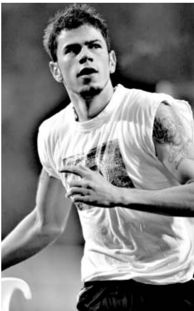
კეჰმანი ამერიკიდან აბრაშოვიჩის გუნდში ითამაშებს.

ახლახან მოგვარდა ყველა დეტალი სერბი მატეა კეჰმანის "სვე ეინდჰოვენიდან" ლონდონის "ჩელსისში" გადასვლასთან დაკავშირებით. 25 წლის სერბმა ინგლისში მუშაობის უფლება მოიპოვა და "ჩელსისთან" 4-წლიანი კონტრაქტი გააფორმა.