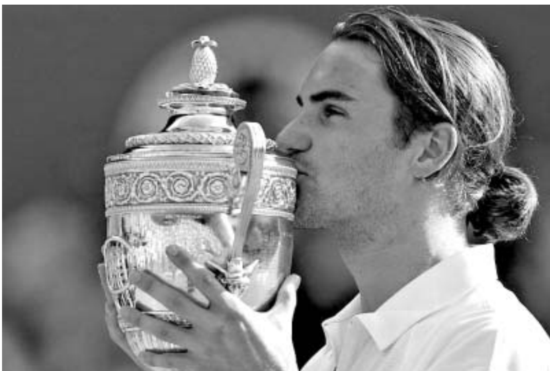
უიმბლდონის შემდეგ ფედერერმა კიდევ ერთი ტურნირის მოგება მოახერხა.

ბრიტანელი გრეგ რუსედსკი ნიუპორტში გამართული პირველობის ტრენინგატორი გახდა. ისე, ერთ დროს ყველაზე ძლიერი მოწოდების მქონე რუსედსკი საერთოდ აღარ ჩანდა პრესტიჟული ტურნირების მეთხედფინალში თუ ნახევა-