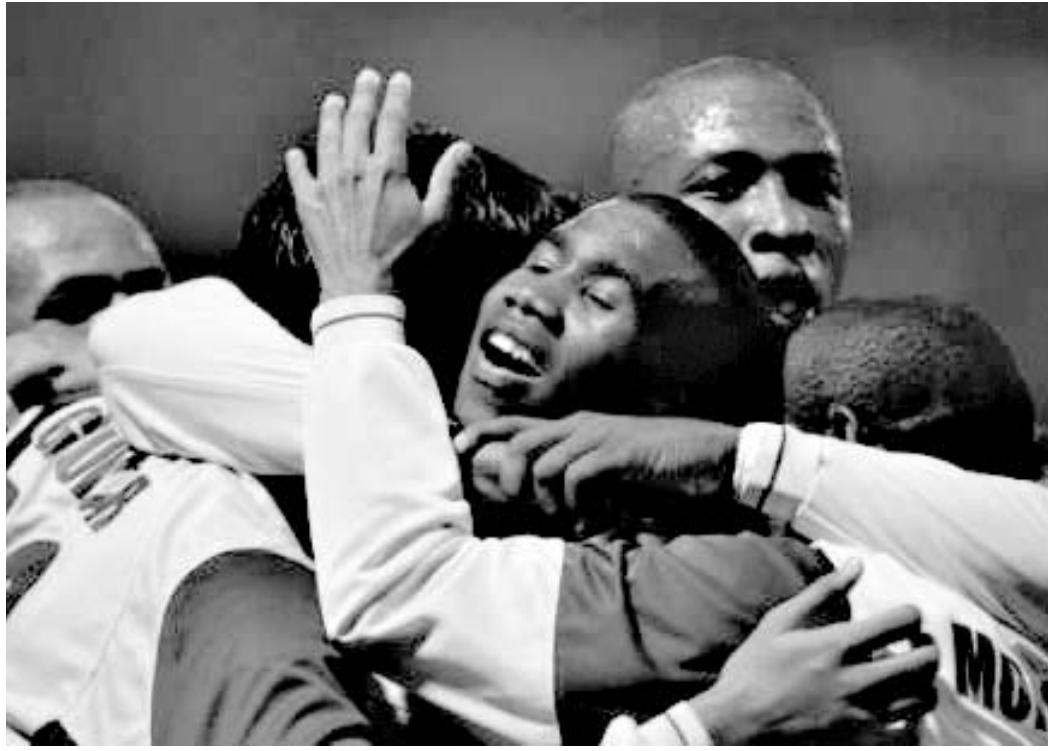
კოლუმბიამ მეოთხედფინალის საფეხურზე გაიწვინა.

ჯგუფის მეორე მატჩში კოლუმბიას და პერუს ნაკრები გუნდები შეხვედრის ერთმანეთს. კოლუმბიამაც და პერუმაც მეოთხედფინალში ადგილი გაინაღდა. აქ გასარკვევი მხოლოდ ის იყო, თუ ვინ დაიკავებდა ჯგუფში პირველ ადგილს. ფრე - 2:2 კოლუმბიას აძლევდა ხელს და მანაც პირველობა არავის დაუთმო.