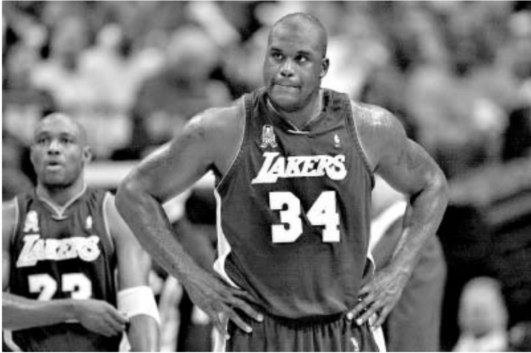
შაკილ ო'ნილი “ლეიკერსიდან” მიდის.

მოკლედ, საქმე იქითვე მიდის, რომ “შაკი” მაიამი ფლორიდას (თუმცა, მზე მას არც კალიფორნი-