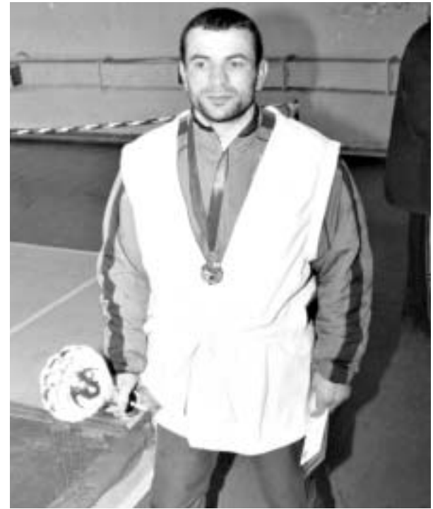
ჩაჩუა შინ დატოვებს.