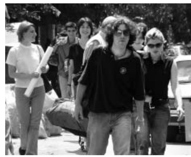
იყალთოს აკადემიაში ტაძრის მოსავლელად მივიღვართ.