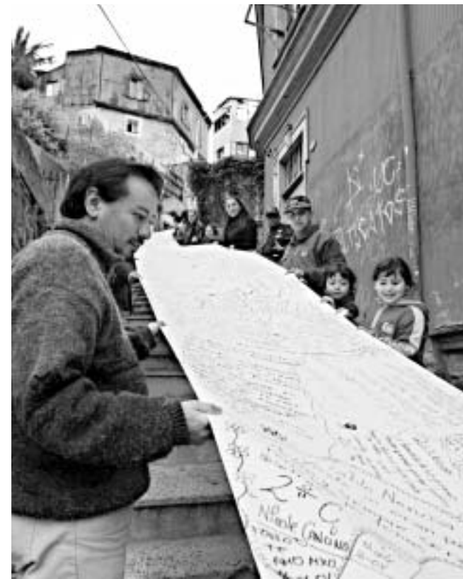
ჩილელები პაბლო ნერუდას 100 წლის იუბილეს 2 კილომეტრის სიგრძის აქციას აღნიშნავენ

საპორტო ქალაქ ვალპარაისოში, ნერუდას სახლთან მისი პოეზიის მოყვარულები შეიკრიბნენ, ქალაქის უზარმაზარი გორაკი რამდენიმე ქუჩაზე გაჭიმეს და საყვარელი ლექსებიდან ამონარიდებით გააფორმეს. ორგანიზატორებს იმედოვნებდათ, რომ ერთმანეთს გადააბამდნენ 1.2 მილის სიგრძის მქონე ქალაქს და მსოფლიო რეკორდს დაამყარებდნენ. განსაკუთრებით აქტიუ-