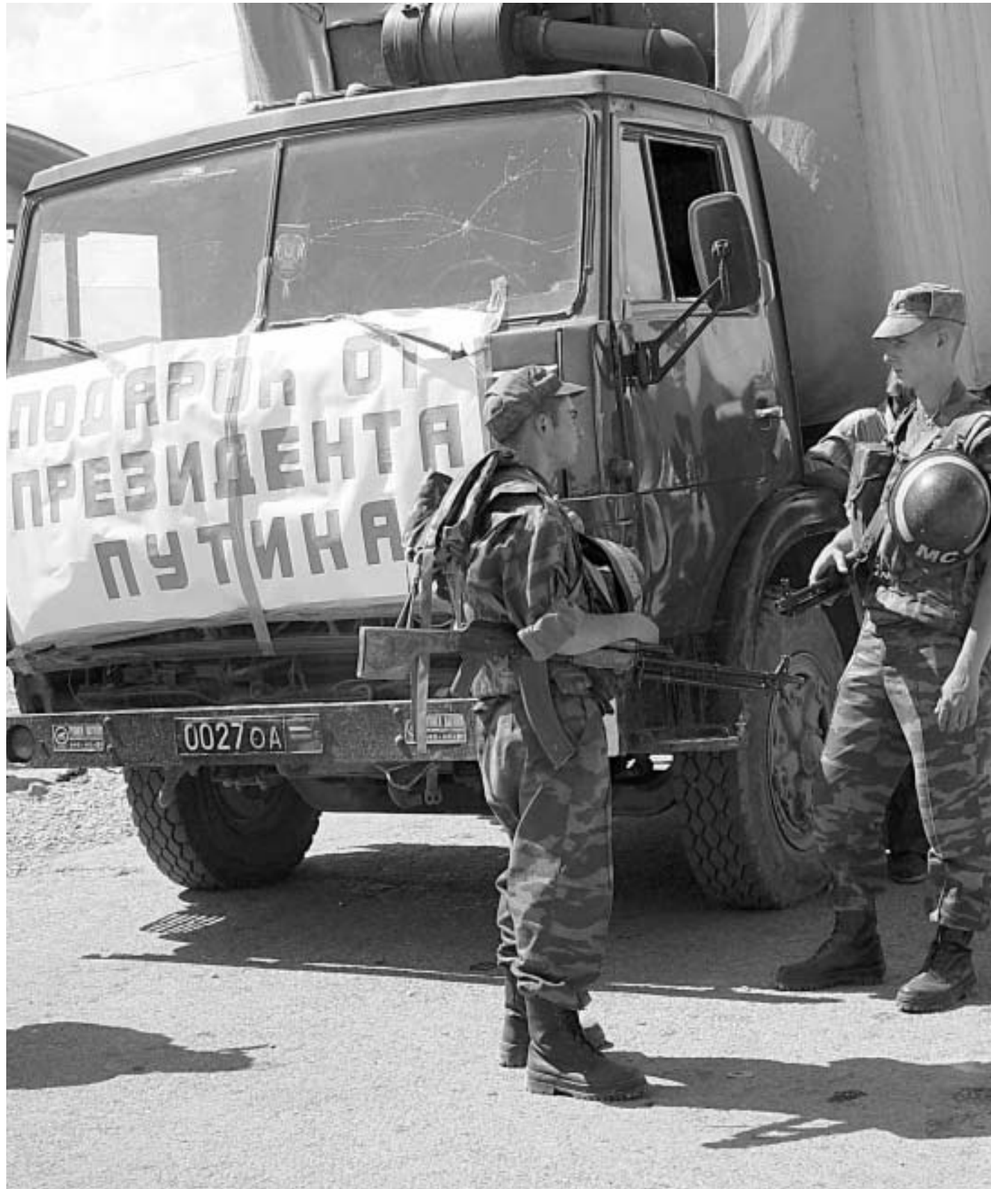
საქართველოს საგარეო უწყების განცხადებით, რუსეთის საგარეო უწყების განცხადებით, რუსეთის საგარეო უწყების განცხადებით...

პუტინი სააკაშვილს ბაძავს, მაგრამ მისი საჩუქარი ერგენტში გაიჭედა