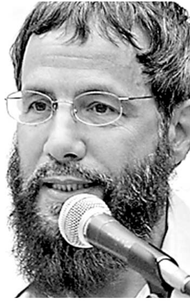
ბრიტანელი ხელოვანი ქეტ სტივენსი და კონსერვატიული სტილი იუსუფ ისლამი ერთად ნერუნ მუსიკას.

1974 წელს მომღერალი კეთილი ნების ელისი სტატუსით თითოპიამი გაემგზავრა. შემდეგ მას უფროსმა მამამ ყურანი ათხოვა, რომელშიც ახალგაზრდამ მრავალი ნაცნობი სახელი ამოკითხა - იმ წინასწარმეტყველებისა, რომელთა შესახებაც კაიოლიკური სასკოლო გაკვეთილებიდან სმენოდა, მაგრამ რომელთა არსებობა უცნობად დარჩა. დაინტერესებულა. და აი, ერთხელაც, მალბიუზე, დიდი უსიამოვნება შეემთხვა - კინლამ დაიხრჩო. მაშინ ის ღმერთს დაჰპირდა, რომ აუცილებლად გადაუხდიდა მადლობას სიცოცხლის გადარ-