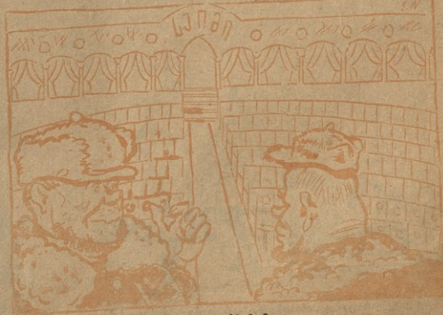
ნახ. ს. ნადარეიშვილის

— რატომ არის ცარიელი სხდომის დარბაზი? — თეიფთარეივლის წყრებში საპარტიროში სხდომის გამო სხდომაზე ვერ გამოცხადდნენ.