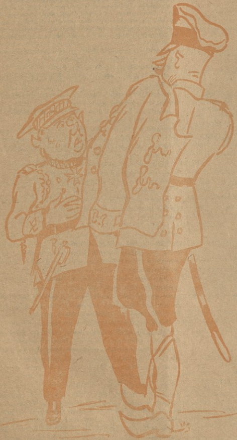
ნახ. ს. ნადარეიშვილის.

— როგორია ჩვენი შტაბის ახალი უფროსის გვანამრთულობის მდგომარეობა? — ახლა კარგია, მაგრამ მომავალში, რა მოვახსენო. აღმოსავლეთის ფრონტზე იმის დაწყებამდე ძველი უფროსის გვანამრთულობაზე კარგი იყო.