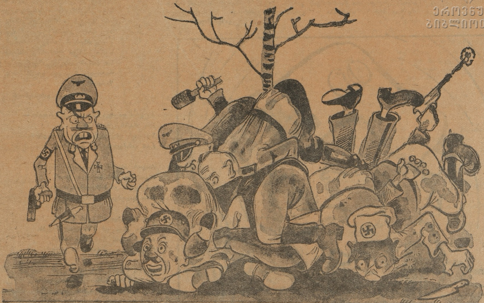
— არიქა, მივაგენით, გვეშველა. — ყოჩაღ, მამაცებო, აბა მომასხენეთ, ვის მიაგენით?