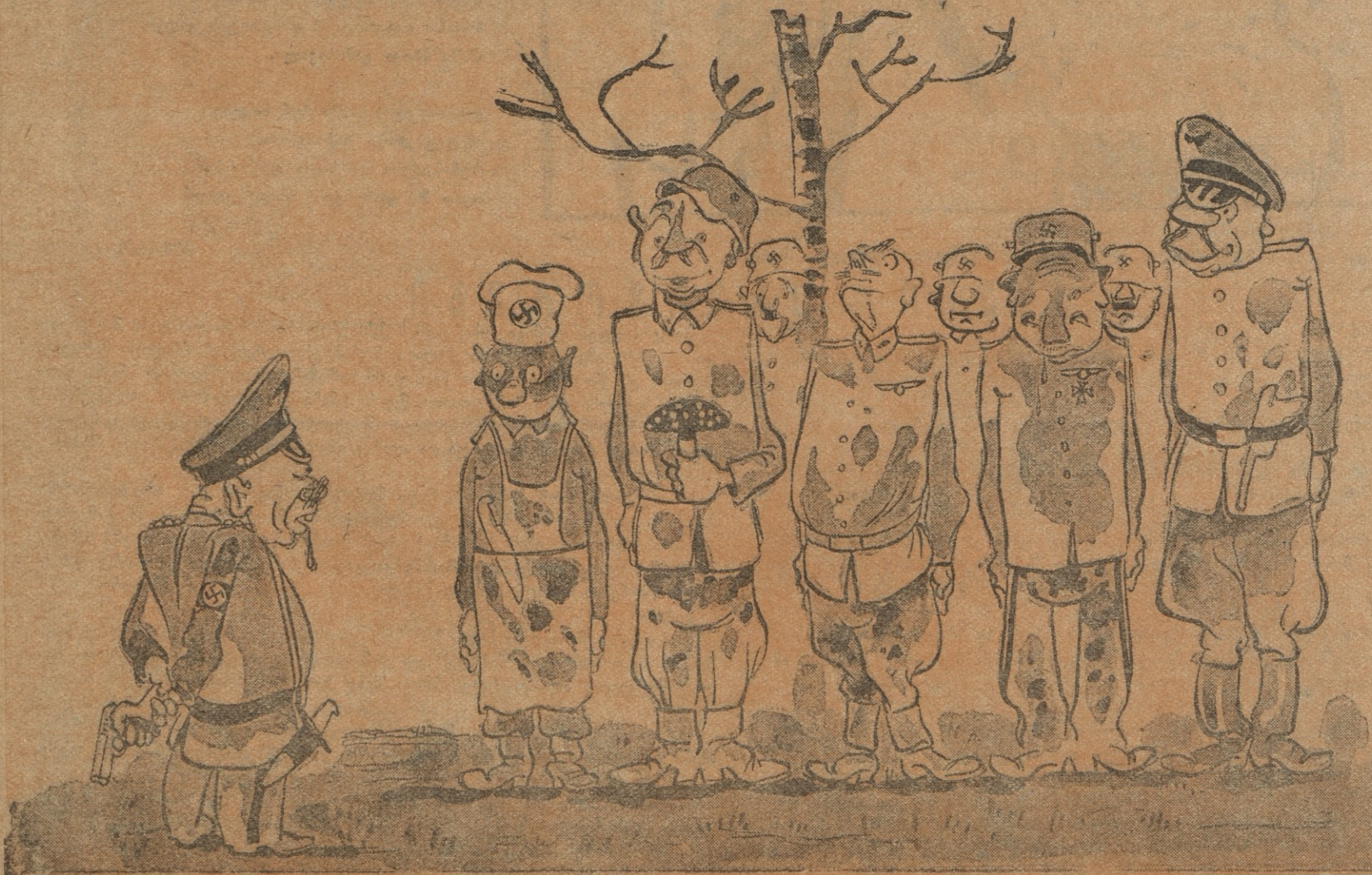
— სოკოს მივაგენით, ჰერ პოლკოვნიკო, ერთი ცალი სოკო ვიპოვეთ. — რა ვუყოთ, ეგეც ნადავლად ჩაგვეთვლება ამ გადამწვარ სოფელში, სადაც კატებსაც ვეღარ ვპოულობთ... გადაეცით მზარეულს შემოწვას.