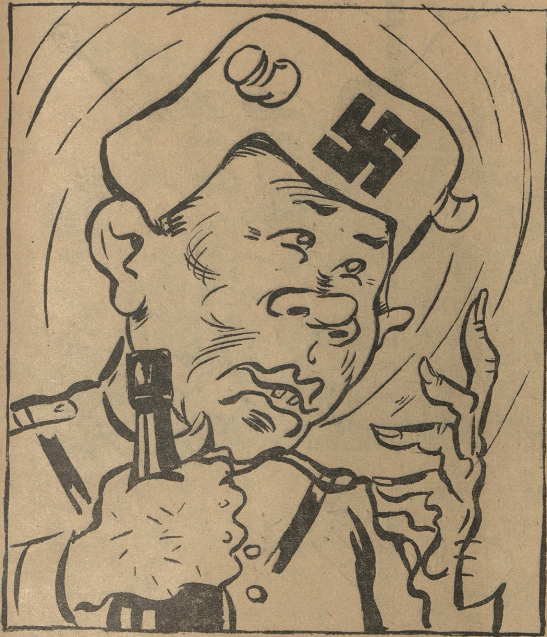
გერმანელი ჯარისკაცის „ზეშთაგონებული“ სახე.