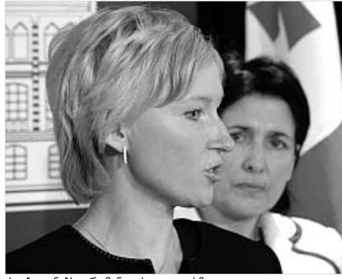
ქალბატონებს ერთმანეთის უკეთ ესმით.

"ჩვენს ქვეყნებს შორის ისტორიულად ყოველთვის კარგი ურთიერთობა არსებობდა. ესტონეთი ერთ-ერთი იმ ქვეყანათაგან იყო, ვინც საქართველოს ევროპის საბჭოში განწერიანებას დაუჭირა მხარს" - განაცხადებს გუშინ ესტონეთის საგარეო საქმეთა მინისტრმა კრი-სტინა ოულინდის. "თქვენ, ალბათ, ბევრი მუშაობა მოგინებთ, მაგრამ იმის იმედი ნამდვილად უნდა ექონდეთ, რომ ევროპა თქვენთან იქნება" - მოგვინოდა და დევაიამედა ქალბატონმა ოულინდმა.