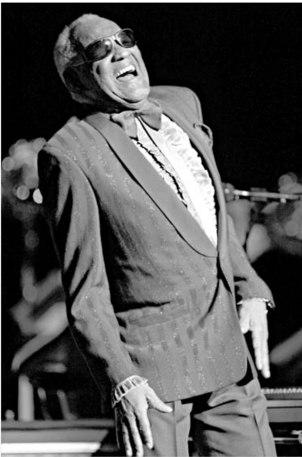
„შე მუსიკასთან ერთად დავიბადე“ - ნერადის ავტობიოგრაფიაში - „ამ დიდი სიყვარულის ახსნა მხოლოდ ასე თუ შეიძლება მუსიკა ჩემი სხეულის ნაწილი იყო“.

“რეი ჩარლზის შემოქმედება იმის დასტურია, რომ მუსიკა მართლაც კვების ყველა საზღვარსა და კატეგორიას. რეი ჩარლზი მრავალ მუსიკალურ ჟანრში გრძობდა მინიურად თავს და ამ დროს არც საკუთარ “შეს” დალატობს. მისი მუსიკა, მისი სულია” - ნერად ვენ მორისონი ჟურნალ “როლინგსტონის” ამრილის გამოცემაში.