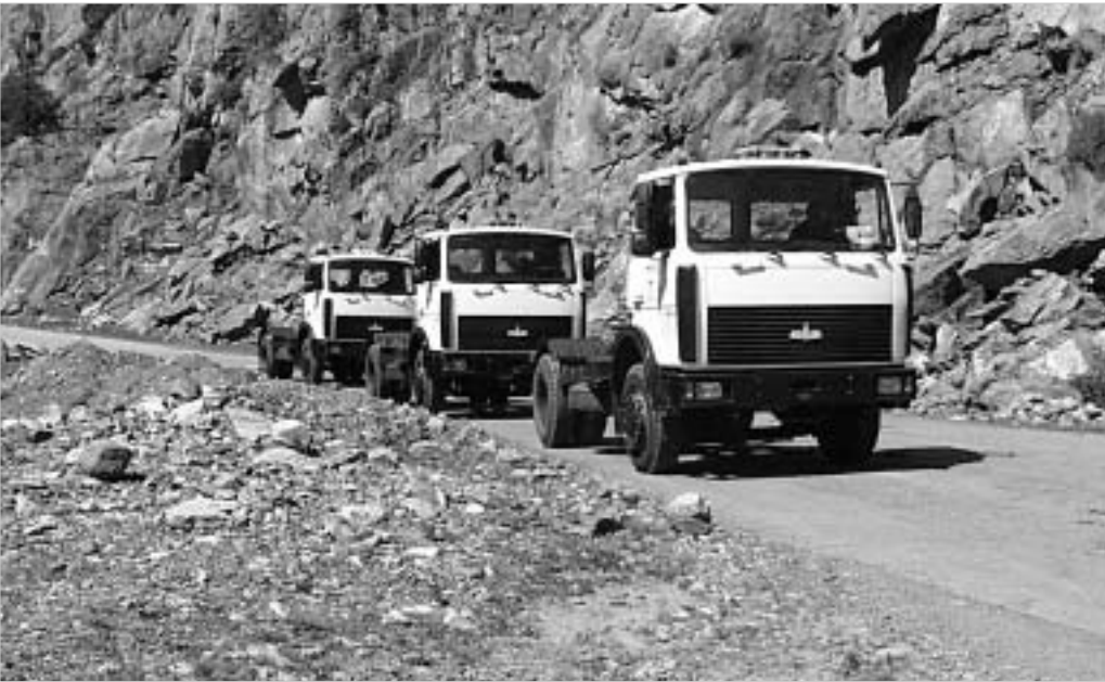
სამშაბათიდან თბილისის მოსახლეობას კრანსდარიდან გამოვჩავენლი სამი ნავის და ექვსი სანსტოვავებელი მანქანა მოემახურება.

ევროპის, თითქმის ყველა ქვეყანაში ბორდიურები და ტროტუარები შავ-თეთრ ფერებშია შეღებილი. ამიერიდან არც თბილისი ჩამორჩება ევროპულ სტანდარტებს და, გზის მდგომარეობას თუ არ გავითვალისწინებთ, ბორდიურები და ტროტუარები თანამედროვე სტანდარტებს დააკმაყოფილებს. რაც შეეხება გზის პრობლემას, მისი მოგვარება ქალაქის ბიუჯეტის დამტკიცების შემდეგ გახდება შესაძლებელი. თუმცა, რამდენად მოგვარდება ეს პრობლემა, წინასწარ არაფერია იცის. იგივე შეიძლება ითქვას თბილისის ჩაბნელებულ ქუჩებზეც. თბილისში არსებული 11 ხიდს აღდგენილი სამუშაოები ჩაუტარ-