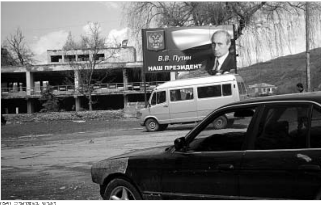
ქართულ-ოსური კონფლიქტის მშვიდობიანი მოგვარება და დიალოგი გრძელდება. ცხინვალში ვარდას მართლაც ელოდებიან.

"ჩემი პრეზიდენტი პუტინია!" - ამბობს ცხინვალის შესასვლელში მდგარი უზარმაზარი ბილბორდი. ის გორი-ცხინვალის სარკინიგზო გადასარტყნზე სულ ახლახან გაჩნდა - ალბათ, არჩევნებისას. 31 მაისის შემდეგ ცხინვალი ცხოვრების ახალ რიტმზე გადავიდა - გაძლიერებული ბლოკ-პოსტები, ფორმიანი და შეიარაღებული ადამიანები და მათი შემხედვარე ფორგუნული მოქალაქეები... ქალაქში უცხო სახის გამოჩენა ეჭვს და უნდობლობას ბადებს; და თუ ეს უცხო ქართველი აღმოჩნდა, ის აუცილებლად მოხვდება ცხინვალის მილიციის განყოფილებაში. ჩემი დაკავებისა და ცხინვალის ჯერ სამართალდამცავ, შემდეგ სპეცსამსახურში წარდგენის მიზეზიც ეს იყო. თუმცა ჩხრეკისას ჟურნალისტის დამადასტურებელი დოკუმენტი აღმომოჩინეს. რამდენიმე საათიანი საუბრის შემდეგ ერგნეთის ბაზრობიდან მომავალ სამართლებრივ ტაქსი ვიჯეტი და თბილისისკენ მოვლიდი.