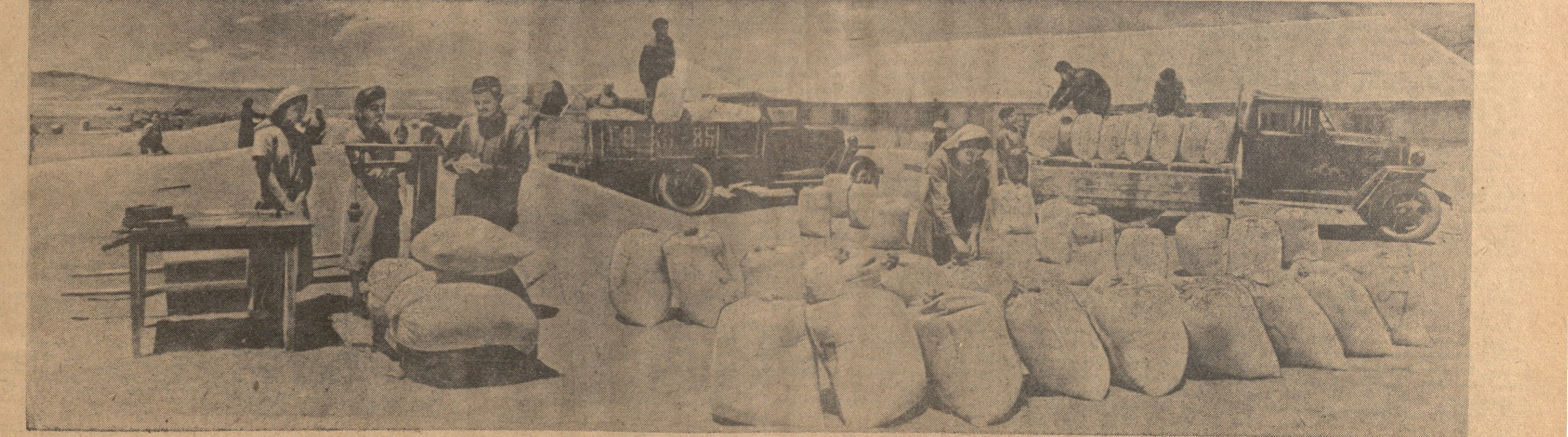
პირველი ბანალური უარი სახელმწიფოს წინაშე. წითელწყაროს რაიონის სოფელ ვადაძეში მუშაკების კოლმეურნობაში...