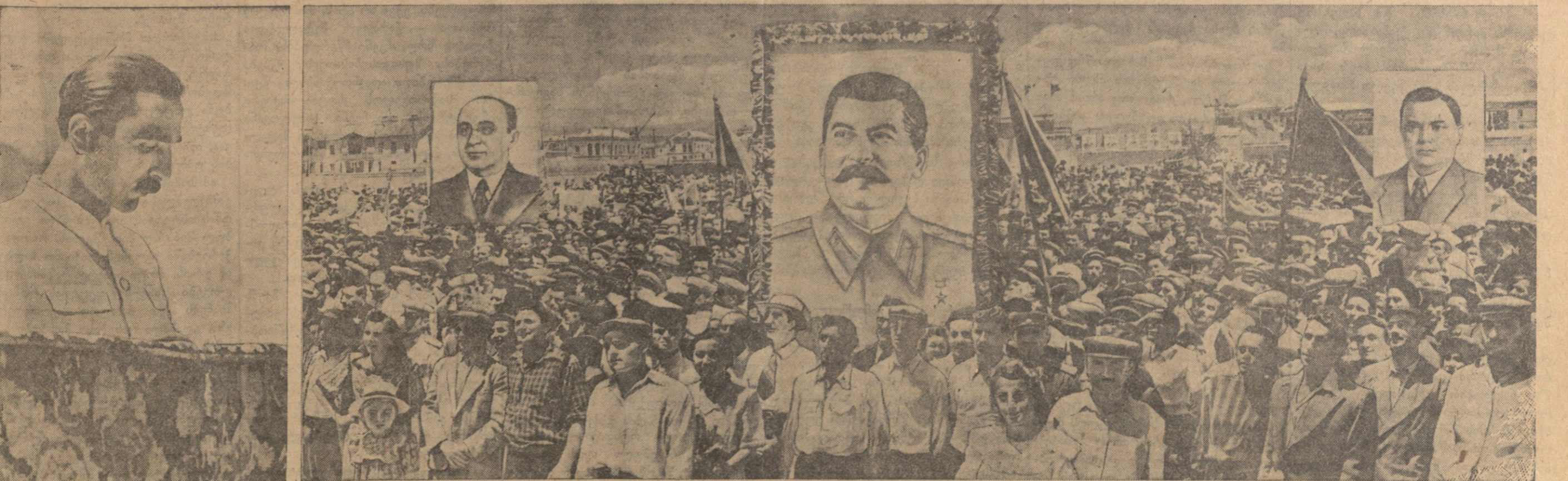
ამირკაპაშვილის მემორიალური მარხის მინისტრთა საბჭოს თავმჯდომარის ამირკაპაშვილის მიმართული მიტინგის მონაწილეთა შემგომი აღმავლობის მიტინგის. საბარტველოს ქ. ბ. (ბ) ცენტრალური კომიტეტის მიტინგის ამხ. მ. ს. კ. გ. კ. გ. კ.

ტონობით მუშის ჩაბარებს აგრეთვე სოფელ ქვემო ჰედის, სოფელ არბოშიკის, და სოფელ ზემო ჰედის კოლმეურნეობებმა. სახელმწიფოსათვის მუშის ჩაბარება კარგად მოაწეს სოფელ მარხანის მე-18 პარტიკილობისა და მალენკოვის სახელობის, არხილესკის კორეის სახელობის და საბათლოს მიქოიანის სახელობის კოლმეურნეობებმა.