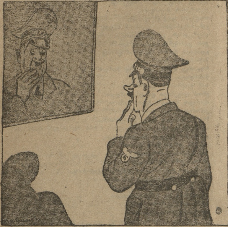
ნახ. პორ. ეფიმოვიცა

— წინანდელ მარცხს მე ვაბრალებდი ფელდმარშალ ბრაუნსჩიხს, ახალი დამარცხებიათვის კი — პახუზიხგება შენ მოგვიწევს ეფრეიტარო შიტლერ.