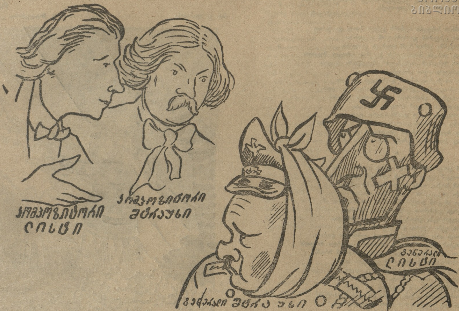
კომკომუნისტორები ლისტი და შტრაუსი (გენერლებს ლისტსა და შტრაუსს) თქვენი მუხიკა უკვე დამთავრდა, ჩვენი გვიჩებიც ვიდარ დაგიფარავენ.