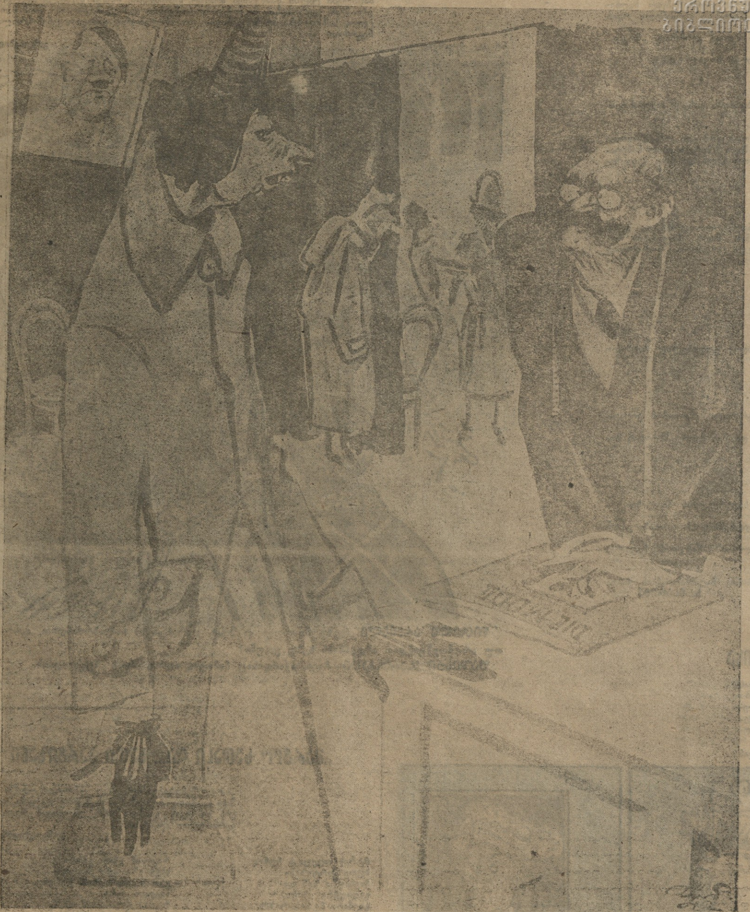
— ხომ არაფერი გაქვთ სამხიარულო გრელი ჩახაცმელი... ქმარი მომიკლეს ფრონტზე.