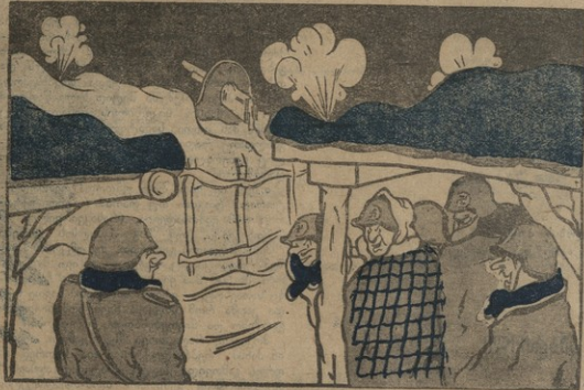
ნან. ა. კრეტკოვის

ფაშისტი სმარტნი (ჯარისკაცის): ვაწაწილებო, უკანასკნელად ერთი სიტყვა მინდა ვთხრაო.