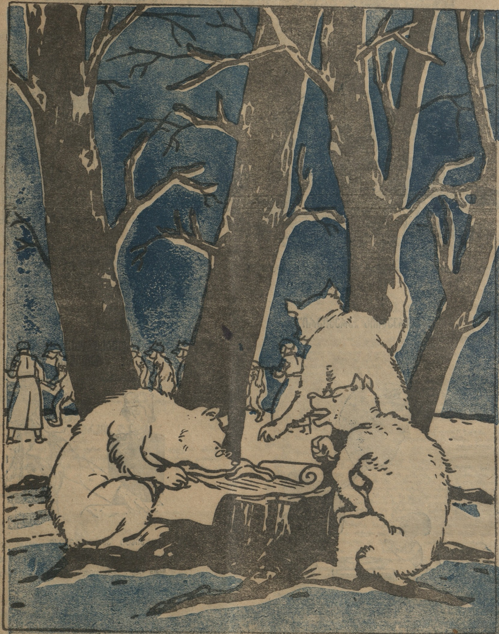
ჩასწერე: სირცხვილად და თავის მოჭრად მიგვაჩნია, რომ ეგ მხეცები ჩვენს სახელს ატარებდნენ, რისთვისაც პროტესტს ვაცხადებთ.