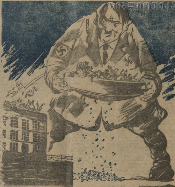
ნან. ვ. ლობხისა

მავდენი ხაჭებების შრენის უბნის ზონებს აბრბრე, აბრბრე ვაჭრებლად ვაჭრებლად ებრბრე ცხრბრე აბრბრე. ფე ვინც აღმარბრე ხაჭებობის თქვე ერთი გროშა — არაფერს პატრონს კი აგზავნის უღებლად... ხაჭებობის.