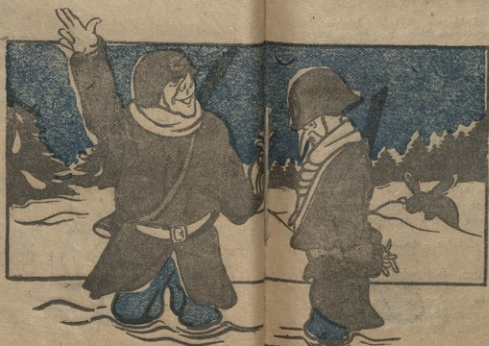
ნან. ა. კრეტკოვის