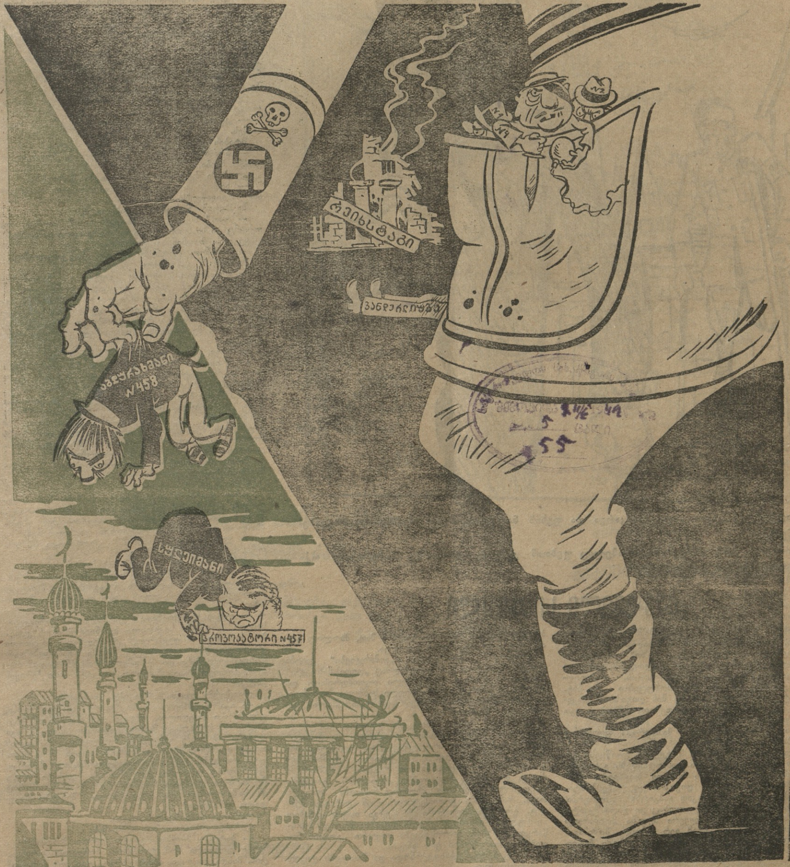
ნახ. გ. ლომიძისა