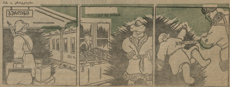
1. ბერბონილი კომპარტისტა, ცუქნობილი „ცურე მუკავალი“ სანკრებობა მ. შავალ თფილი ვინადიბენ და მერე კე... 2. „ურტი ბევი და კიპანინი“ თარბი ვაგინი ფარკო უფინმა...