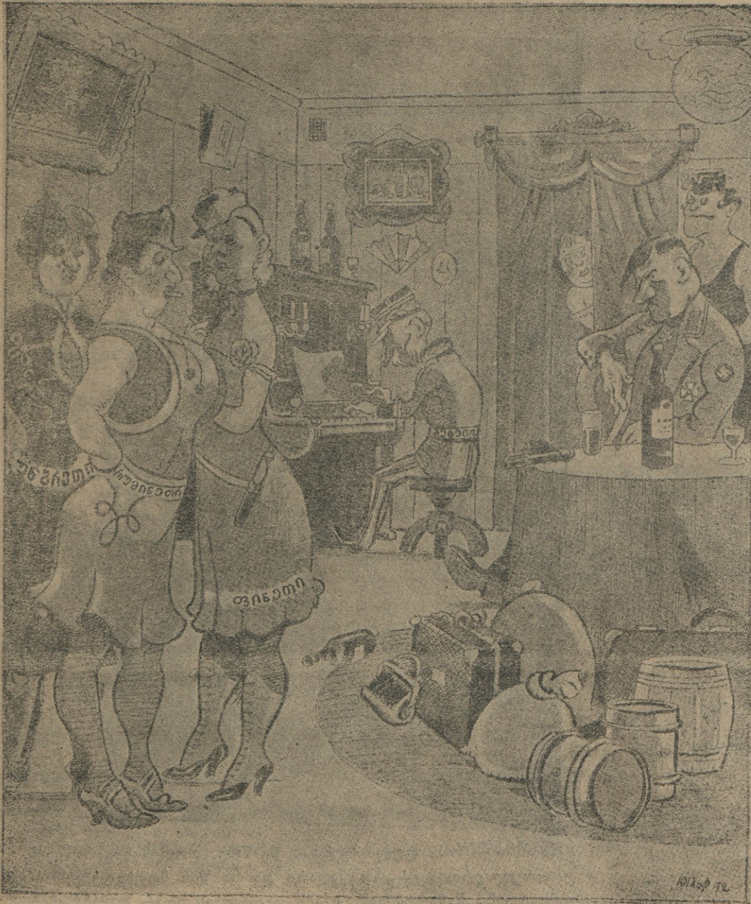
— არ ვიცი, ჩვენს შორის რომელი უფრო მეტად უყვარს ფიურერს, მაგრამ ყველას კი ერთნაირად გვძარცვავს.

„არიელთა“ პოლკში თუმცა ბევრი იყო ქურდი, ფლიდი, მაინც ფრიცსა გაიძვირას იქ სახელი ჰქონდა დიდი.