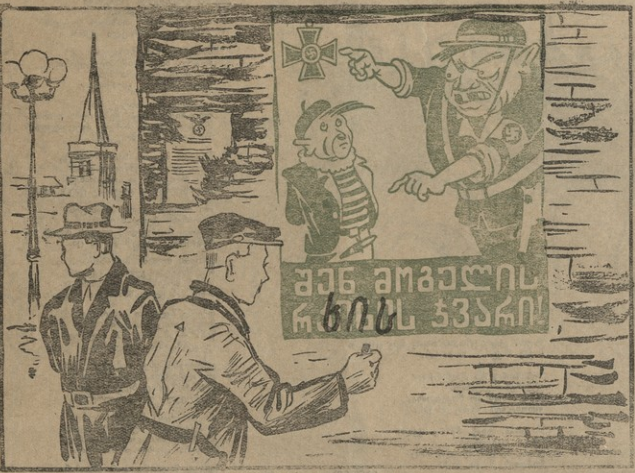
ნან. გ. ლომბისი