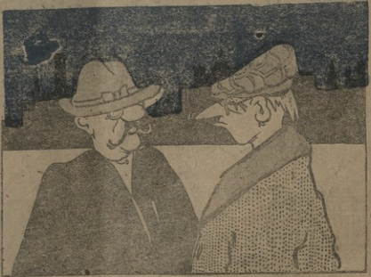
— ვაგო, კასლინგეს პრემიერად დანიშნის შემდეგ გერმანისა და ნარევეის შორის ზავი ჩამოვირბინებო? — არასტობის. შეუღლებელი! — როგორ, ავი კვლობი პიტერის ურნაპაროლი მიანა? — მგ იხი კვლობს არ ვეკვლობს. მგ ვაზობ ფსაისტური გერმანისა და ნარევეის ხალხს შესახებ.

ფრანკოის პარს სწრება რომ ვიხილვის აბივივილი! დანიშნის უნდა მალო მიხედება ზავი გერმანისა და ნარე- ვის შინს.