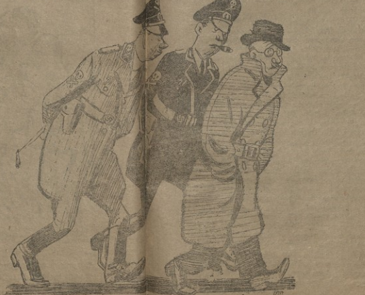
ნან. შ. ვახუშტისა