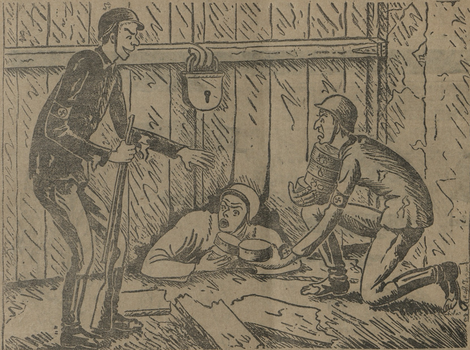
გუშაბი (ქურდ ფარისკაცებს) — ნუ გეშინიათ ბიჭებო, გამოიტანეთ თუ კი რამ ღარჩა საწყობში ხვრელს მე თითონ ამოვაშენებ. მხოლოდ პირობა არ დაივიწყოთ — მესამედი ჩემია.