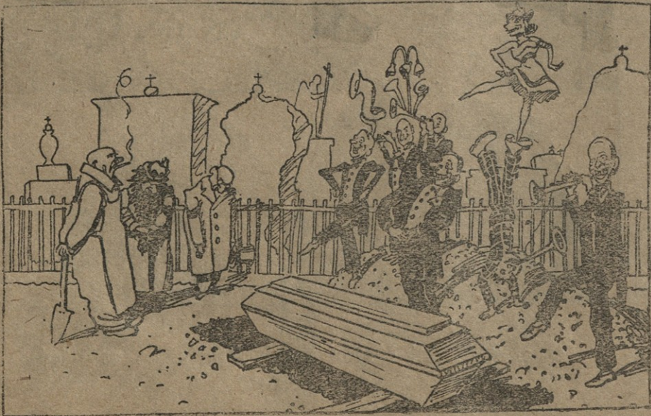
— ჩვენი მხიარული პროგრამის შემდეგი ნომერი იქნება — პატრიცეზულ ჰანსის კუბოს სამარეში ჩაშვება, ჯაზ ექსტენტრიკის აკომპანიმენტით! ძვირფას მიცვალებულს შევხვდეთ ტაშის კვრით!