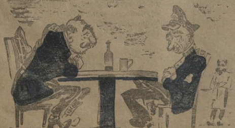
გერმანოსი ფილმისეკურ შიხარულად არის გერმანულეთიანს. — ნოვაკი რომ შინაფურლ დამოკიდებულეთი უნდა გადაჩრჩეს შინაურ პატრიოტობას.