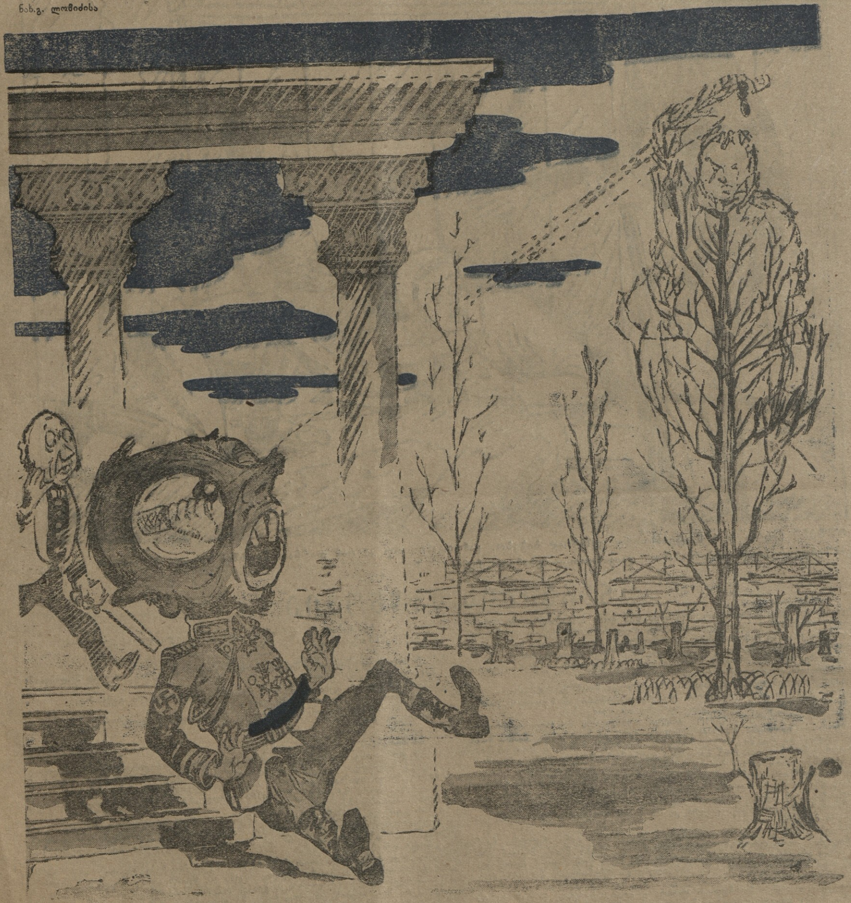
ტერბოვენი — შეიპყარით, მოჭკალით! მსახური — ნუ გეშინიათ, თქვენო ბრწყინვალეზავ, ეგ პარტიზანი არ არის, მაგ ხესაც მოვაჭრეინებ.