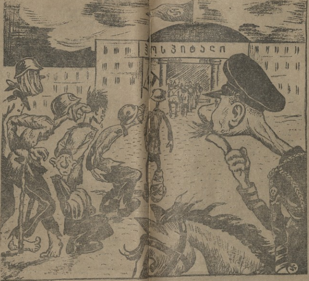
— წინ, იერისი... საავადმყოფოსკენი არ ძარბი ხარცველი არ დარჩეს დატყავებლი.