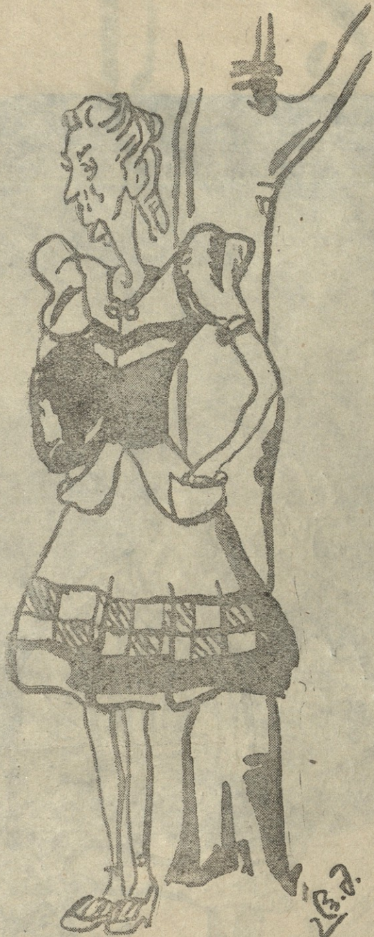
— ჩემი უფროსი თოთხმეტი წლის იყო და ფიურერმა ფრონტზე გაგზავნა. ნეტავ მოხუცი მაინც ყოფილიყო: გადარჩებოდა.