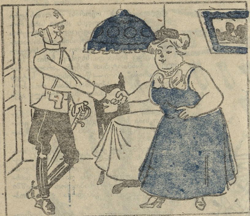
1. ეს ფინელი „ბანოვანი“ იყო ჰანსის მოტრფიალი. იგი ნაზად თვალს ნაბავდა, როს პრაწავდა ჰანსი თვალღებს.