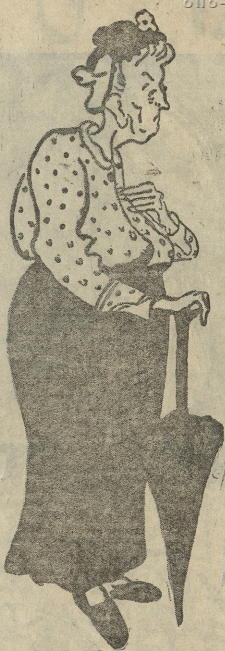
— ჩემი შანსი სამოცდაათხმეტი წლის იყო და ფიურერმა ფრონტზე გაგზავნა. ნეტავი ბავშვი მაინც ყოფილიყო: გადარჩებოდა.