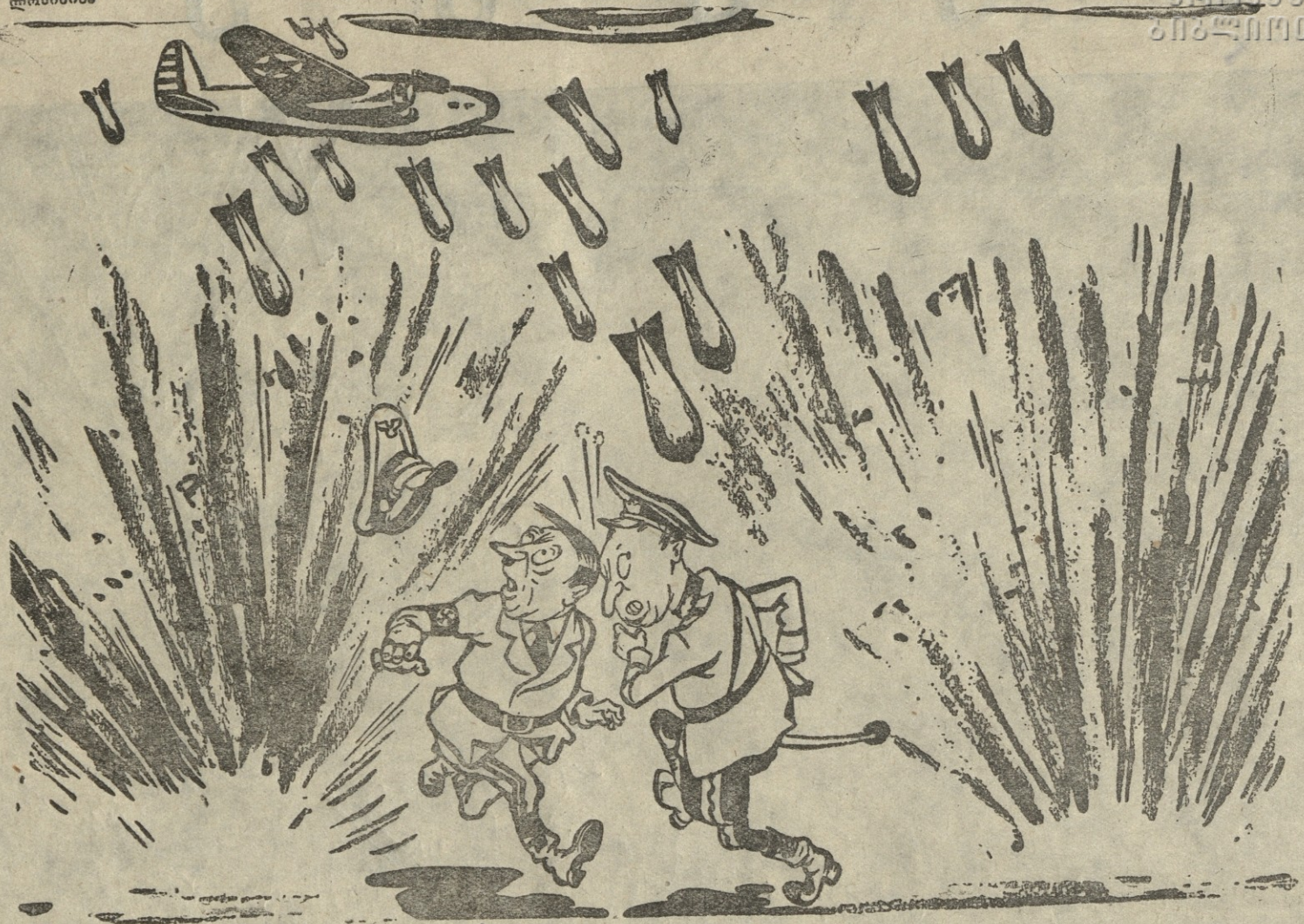
ანტონესკა: — მიშველე ფიურერ, მიჭირს! ჰიტლერი: მომხმარე ანტონესკა, მე უარეს დღეში ვარ!