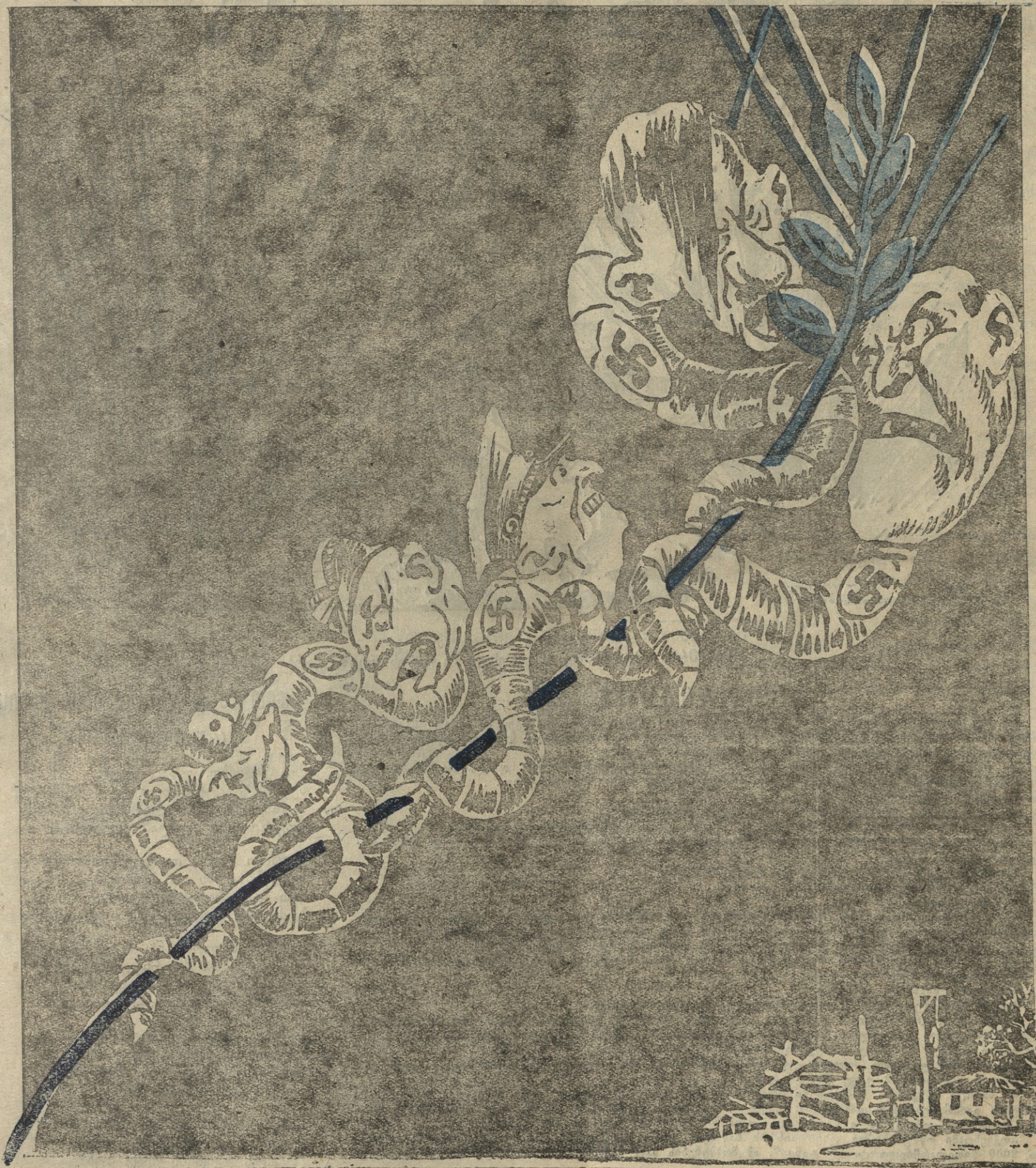
ნახ. მ. ვაღბოლსკისა