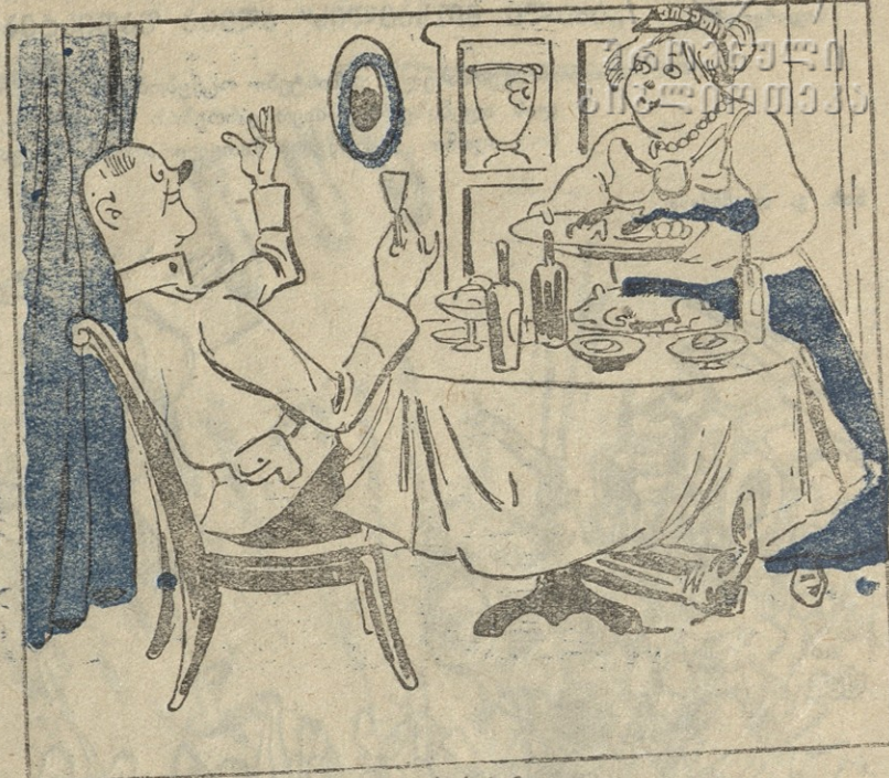
2. თავბედურმა დაბირებამ „ბანოვანი“ დაარტყა: მიიწვია ჰანსი სახლში მისთვის ხარჯი გაიმეტა.