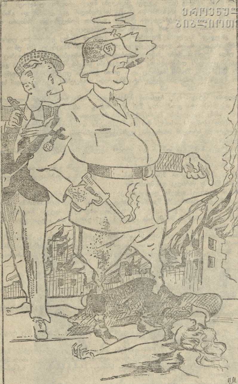
ფაშისტი პოლკოვნიკი (ფაშისტი ჟურნალისტი): — ასე ჩასწერეთ: ჩვენს მიერ ოკუპირებულ ოლქების მოსახლეობა ფეხქვეშ ფიანდაზად გვეფინება.