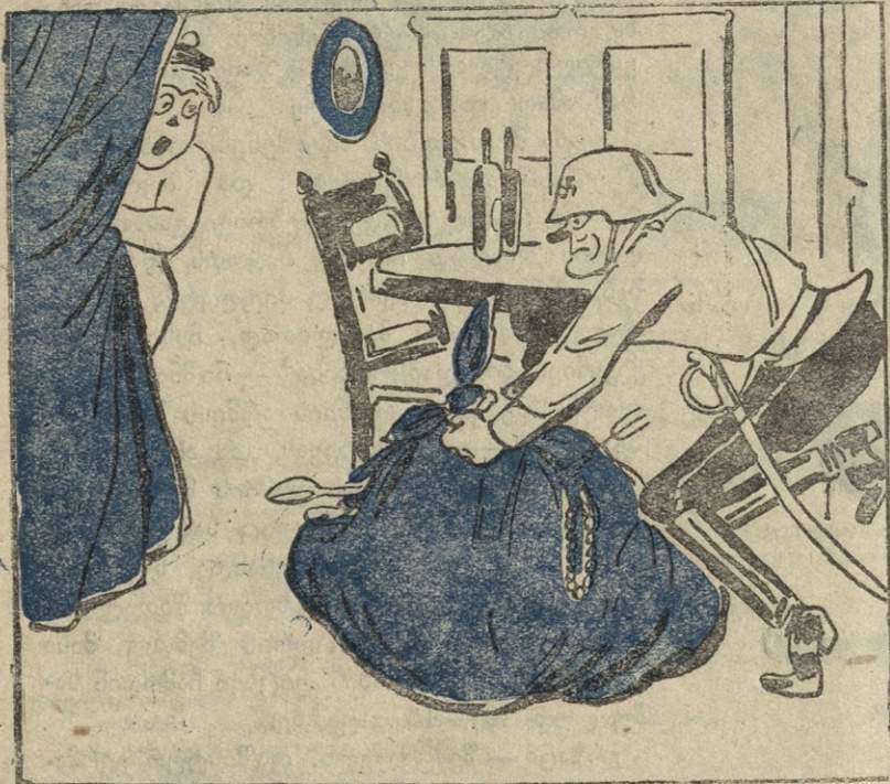
3. ჰანსმა კარგად იქეიფა დააყოლა ზედაც ყავა; შემდეგ თავის მასპინძელი მთლად გაშქურდა, გაატყავა.