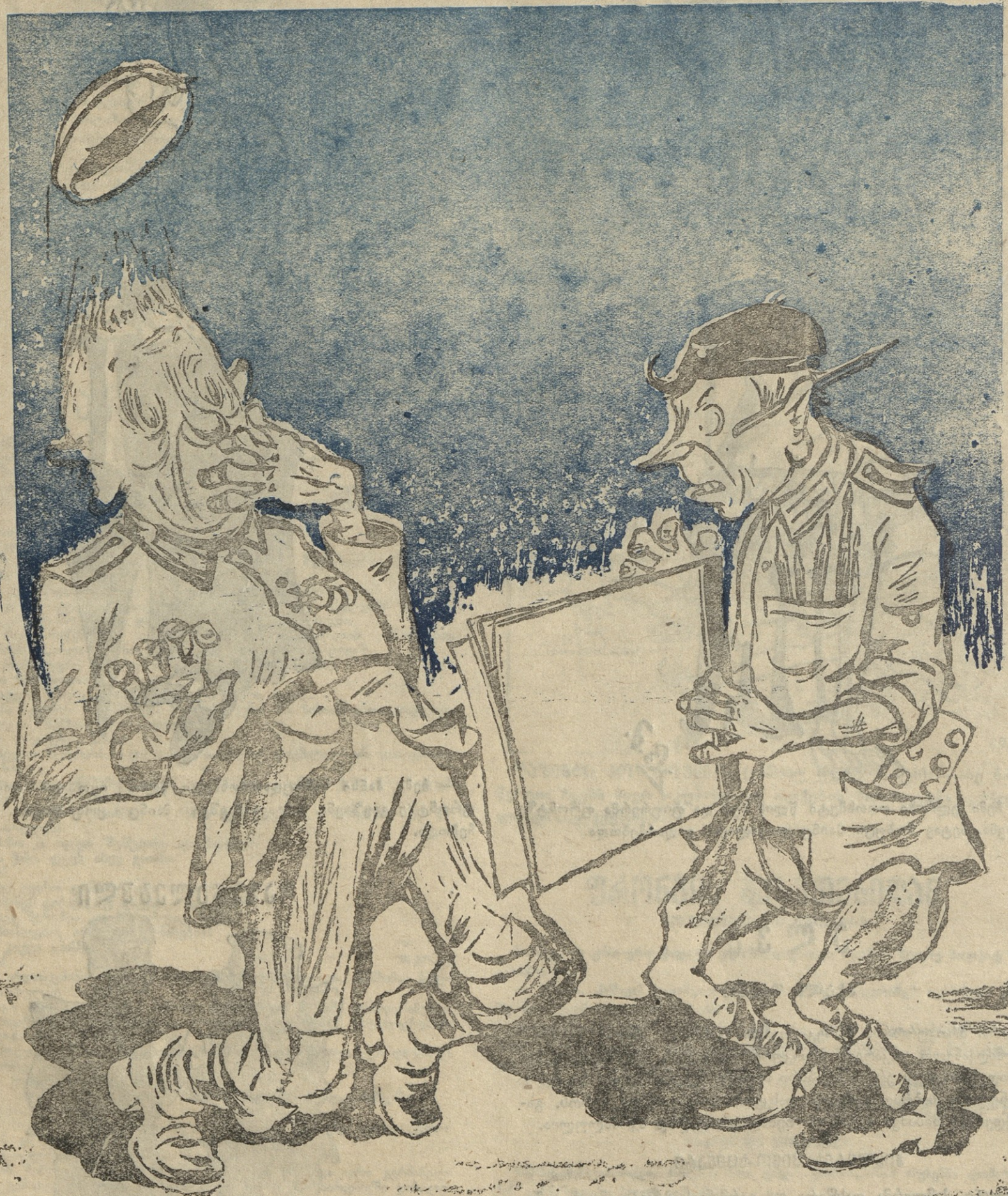
— რის გეშინიათ ბატონო პოლკოვნიკო?.. ნუ თუ თქვენც წაიკითხეთ, რომ ინგლისელი მოქალაქენი მეორე ფრონტის დაუყოფ- ნებლივ გახსნას მოითხოვენს..