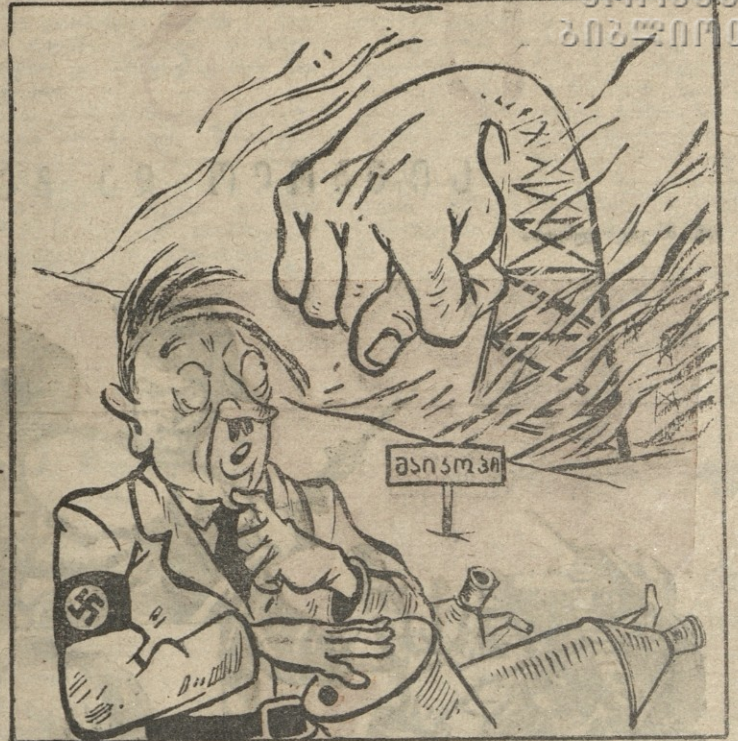
მაგრამ ნატვრა არ აუხდა, არ ახდებდა აღარც აწი,— ზენზინის და ნავთის ნაცვლად მან მიიღო მხოლოდ ბრანწი.