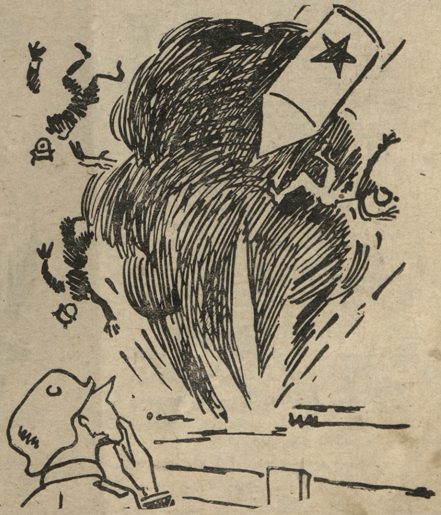
— მიწის დასაპყრობად გამოგზავნეს, ესენი კი შაერში აფრინდნენ.