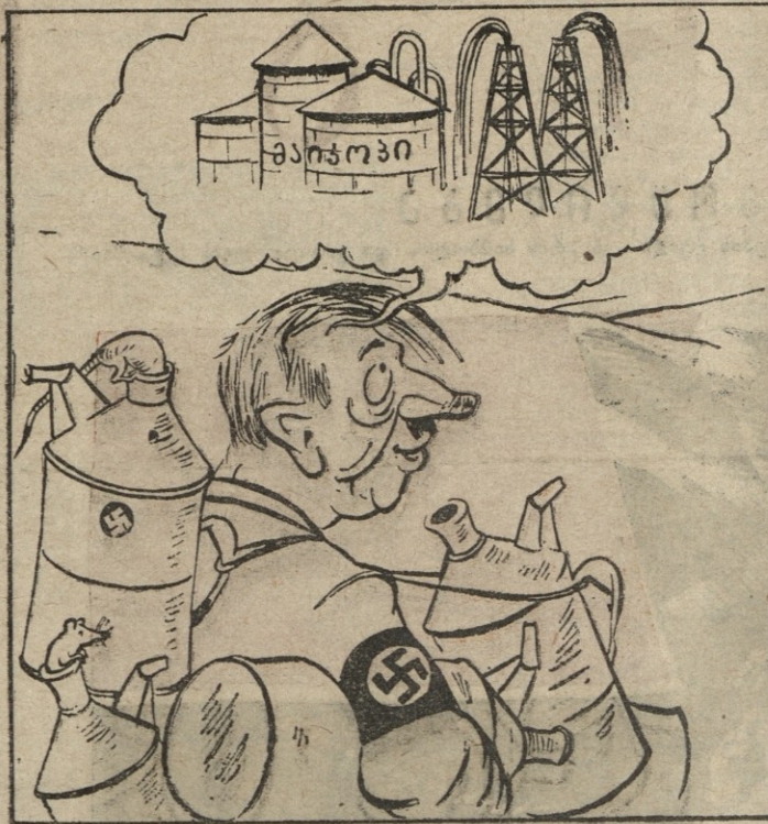
საბჭოთა ნავით შემწავროდა ეს ბანდიტი არამზადა, მასზე იმედს ამყარებდა, თან ჭურჭელიც მოამზადა