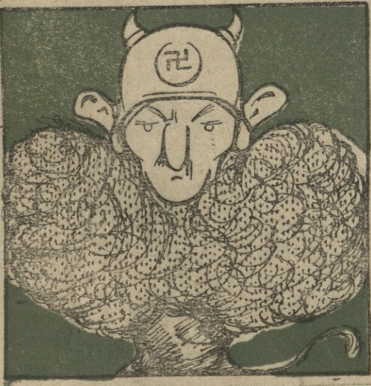
1. გერმანიაში: გერმანელ-ჯარისკაცს ათანასწორებენ ლომთან.