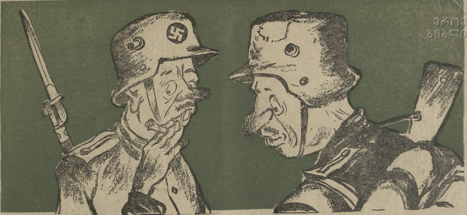
— სამხრეთში დიდი სიცხეები სცოდნია. — ალბად ამიტომ არის, რომ რუმინელთა ჯარის ნაწილები კავკასიაში თანდათან დნებიან.