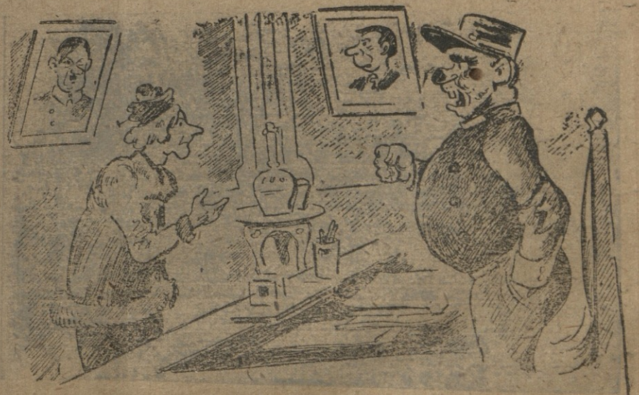
— დედაბერო, თქვენი შვილიშვილა ანტიგერმანულ საქმიანობას განაგრძობს. დებულობ თუ არა ზომებს? — დიახ, ვღებულობ — სახელდობრ რას? — ხელს ვუწყობ, რითაც შემიძლია