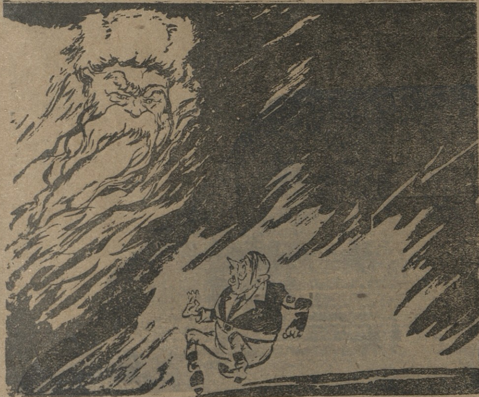
ჰიტლერი: ისევ რუსულ ზამთრის აჩრდილი? მე ამას არ დაგუშვებ, მე ამას ვერ გადავიტან.