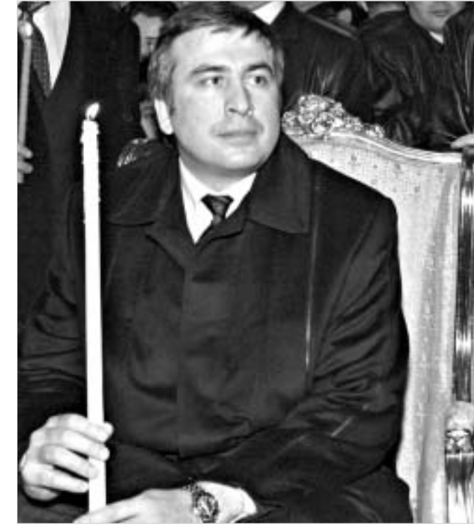
მას ლეიტი მოძებელი ძალა აქვს. თითქმის ორი მიტრი სიმაღლის, ახივანი, წარმოსადგენი მამაკაცი, ფართო მხრებითა და უღვეი ენერჯის პატრონი. 36 წლის საქართველოს ახალი პრეზიდენტი, მიხეილ სააკაშვილი თითქოს განგებამა შექმნილი ამ ზომისა,

საოცრებები კი სააკაშვილმა უკვე მოახდინა. მოხუცი შევარდნაძე ვარდების რევოლუციით აიძულა ხელისუფლებიდან წასულიყო, მოვიანებით კი თბილისის კონსტრუქციულ დაარუნა აჭარის ავტონომია, სადაც რუს უსაზღვროებთან გარიგებული ადგილობრივი ურჩი ფეოდალი პარამუნდა, და რომელმაც იქაიური სხვადასხვა სახის უკანონო ვაჭრობის სა-