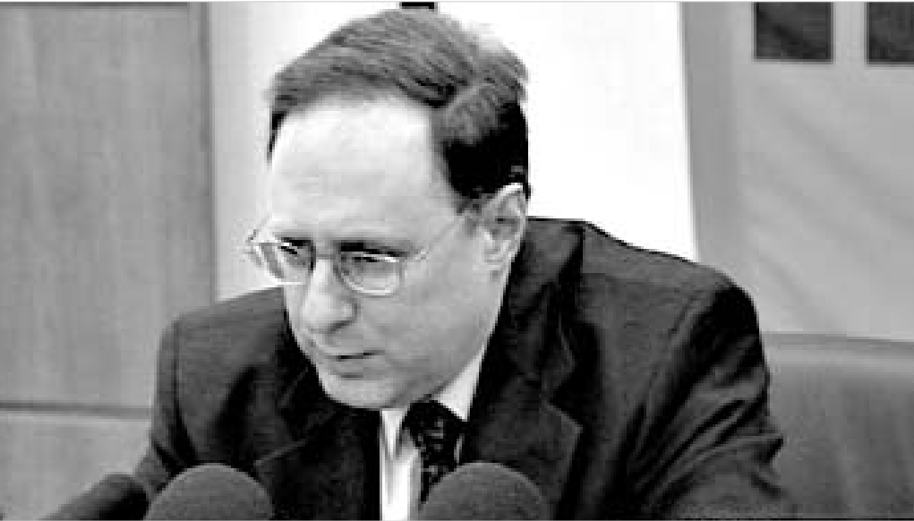
ალექსანდრ ვერშოვი: "საქართველოს ტერიტორიული მთლიანობა ყველა დინამიკურ-სტრატეგიული მხარე უნდა დაცვას".

კონტროლის ქვეშ განხორციელდება, - უტიფრად ამტკიცებს ივანოვი, მაშინ, როდესაც როტაციის პროცესს ბოლომდე ქართული თავდაცვისა და უშიშროების კომიტეტის თავმჯდომარე გივი თარგამაძე. იგი დაბეჯითებით ირწმუნება, რომ სვიატოსლავ ნაბზდოროვი ცხინვალს პირველ ავგიუსტს აუცილებლად დატოვებს, მიუხედავად იმისა, სურს თუ არა ეს რუსულ მხარეს. "მე ვეფირობ, სერგეი ივანოვი გამოსული უნდა იყოს იმ ასაკიდან, როდესაც საკუთარ კუნთებზე ყურება სიამოვნება, - მიიჩნევს თარგამაძე. ამ დროს კი, რუსეთის თავდაცვის მინისტრი თვითკმაცოფილებას მისცემია და "იტარ-ტასთან" ინტერვიუში სიამაყით აღნიშნავს, რომ "საინფორმაციო პრესინგის პირობებში, რუსი სამხედროები მანდამტოვებულ ვალდებულებებს გენშტაბის უფროსი.