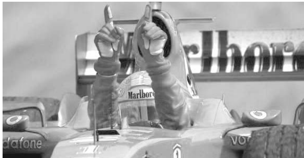
მიხაელი ფაქომრჩივად ჩემპიონია.

არ გვგონოთ, რომ ამით დასრულდა დიაგორიძეთა წარმატებები. გარდა იმისა, რომ როდოდელი დიაგორის უფროსმა და შუაიანა ვაყებმა - დავამეტოსმა და აკუსილაოსმა დაიდგეს ოლიმპიურ ჩემპიონთა გვირგვინები, 432 წელს უფროს ძმებს არც უმცროსი ძმა - დორიუსი ჩამორჩა და პანკრატიონში იმარჯვა. ყველაფერ ამას დაუერთო ისიც, რომ ოლიმპიურ ჩემპიონთა "მოდგმას" დასაბამი დაუდო მამამ, დიაგორ როდოსელიმ, ბექდაულებელმა ვაჟავანამ! ამხლა შესაძლო იმისთვის დამჭირდა, რომ გუშინ "ფერარის" გერმანელმა პილოტმა მიხაელ შუმპენბერგმა სრულიად მშვიდად, აუღელვებლად, პირველად შემოეპრობა "პოკენაიმის" ტრასას 66-ჯერ და... ჩვეულოდ სურათი - შუმპენბერგ გამარჯვებულის შამპანურით ხელში. მიმდინარე სეზონის "სამედიკალინოების" 12 ეტაპიდან მიხაელმა თერთმეტში გამარჯვა. მისი გადამკიდ