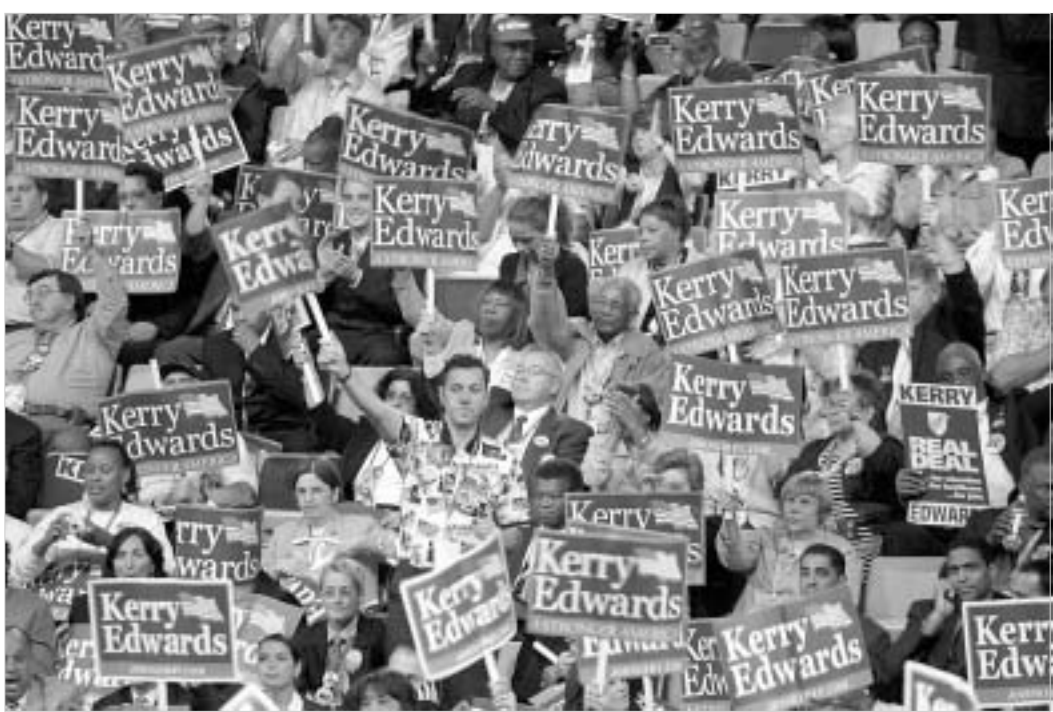
26 ივლისს აშშ-ს დემოკრატიული პარტიის ყრილობა გაიხსნა.

ქალაქი ბოსტონი, რომელიც ინგლისური კოლონიალიზმის წინააღმდეგ ბრძოლის დანაშაულის ისტორიული სიმბოლო გახლავთ, ორშაბათს კიდევ ერთი მნიშვნელოვანი მოვლენის მომსწრე გახდა. მთელი კვირის მანძილზე ბოსტონის თავზე F-16 ავიაგამანადგურებლები იფრენენ, ხოლო ყურეს საბრძოლო კატერები გააკონტროლებენ. 26 ივლისს, ფლიტ-სტირტზე მდებარე კონფერენციის სასახლეში აშშ-ს დემოკრატიული პარტიის ყრილობა გაიხსნა, რომელსაც 5 ათასი დელეგატი და 15 ათასამდე მიმომხილველი ესწრება.