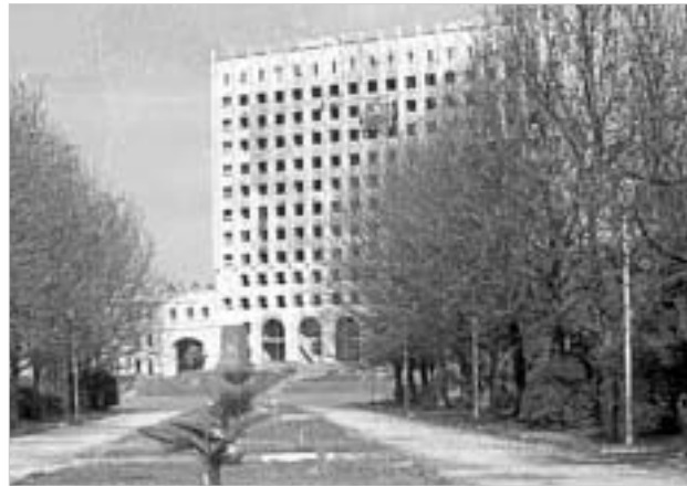
იქ, სადაც ჩვენი ბიჭები დაიღუპნენ კულტურული მემკვიდრეების ერთად ის ერთხელ ისევ ისე დგას, დანახვითგადასწრებით. საბჭოთა მთავრობის მოვლით, ჩემთვის არავის უთქვამს, არ ქნაო ეს... პირიქით, აფხაზი ბიჭები იდგნენ ჩემს გვერდით და მიცვადნენ.

იგი წარმოშობით სოხუმელია, ამჟამად დევნილი ჟურნალისტი. მან აფხაზი მეგობრების დახმარებით შეძლო დიდი ხნის უნახავ სოხუმში შესვლა. უსაფრთხოების მიზნით, მის ვინაობას არ ვამხელთ.