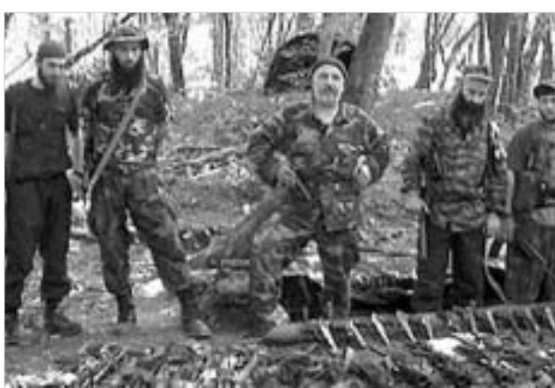
"ბექაში" ბრწყინვალედ ჩატარებული ოპერაცია: ავტობუსის ასლან მასხადოვი.

გუშინ ჩეჩენურმა სააგენტო "კავკაზცენტრმა" გაავრცელა ვიდეოჩანაწერი, სადაც 22-23 ივნისს ინგუშეთში ინგუშებისა და ჩეჩენი მოჯაჰედების მიერ განხორციელებული სამხედრო ოპერაციის ფრაგმენტებია მოცემული. ვიდეოკადრებზე აღებჭვრილია ინგუშეთის შინაგან საქმეთა სამინისტროს შენობაში შაჰიდების ისლამური ბრიგადის "რიადუს-სალიხინის" ამირა, აბდალა შამილ აბუ-იდრისი. ჩეჩენი მეთაური მას მოჯაჰედების მიერ საბრძოლო აღჭურვილობისა და იარაღის საწყობის დაკავებისა და ამ სამხედრო ოპერაციაში მონაწილე მოჯაჰედების რაოდენობის შესახებ პატივს ახარებს. აბდალა შამილის მონაცემებით, ოპერაციაში 570 მეტროლი მონაწილეობდა. ოპერაციის მსვლელობისას ამოღებული იქნა 700 ერთეული ავტომატური (ცეცხლსასროლი იარაღი, 800 ერთეული პისტოლეტი, სხვადასხვა კალიბრის 1 მლნ ზანზა, ათეულობით ყუმბარტყორცნი, ტყვიამფრეკვერი და სხვა სახის იარაღი, ასევე საბრძოლო ფორმა.