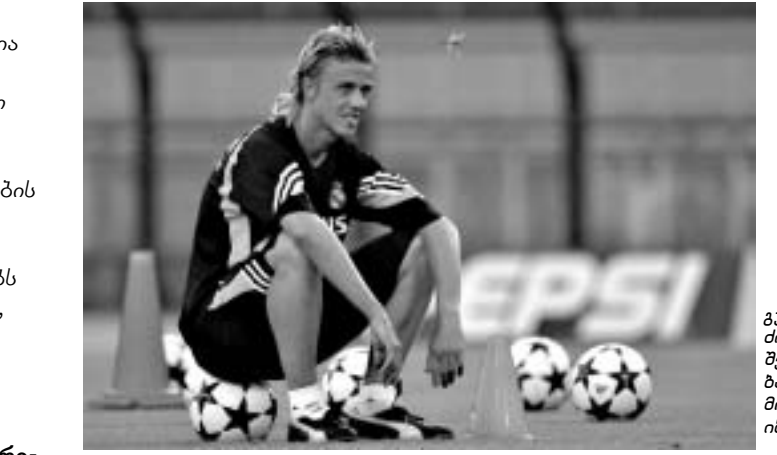
გუტი ძირითად შემადგენლობაში მოსახვედრად იბრძობებს

- და რა მოხდა კვირუბის მწვრთნელობისას? - განსაკუთრებული არაფერი.