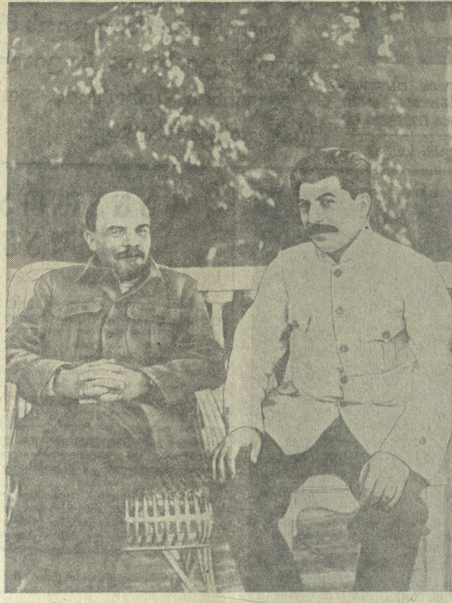
მ. ი. ლენინი და ი. ბ. სტალინი ბრესტში 1922 წელს.