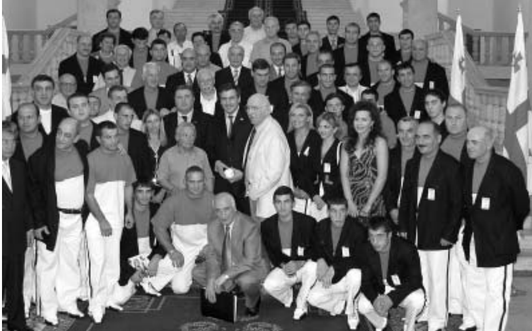
აპრილსა და ოქტომბრს.

ლი ჩვეული ენერჯული და შემართული ნაბიჯებით შეეგება დელეგაციის წევრებს.