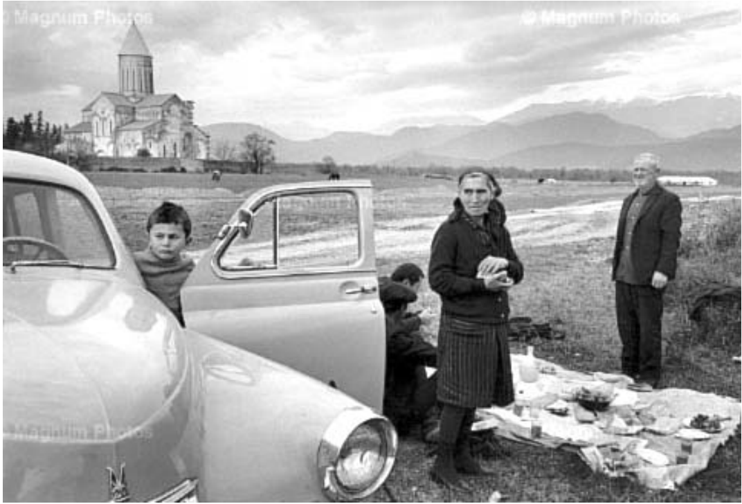
კარტიე ბრესონის მიერ დაწარმოებული "ალავერდი" 1972 წელს.

მის ნამუშევრებზე ასახული ადამიანები თითქოს საკუთარ თავში ან საუბარში არიან დანთქმული, ისინი "კლასიკური" სახით არასოდეს დგანან კამერის წინაშე. კარტიე-ბრესონის კამერა ადამიანი სულში აღწევს, და ყოველი ფოტოსურათი რეალობას ასახავს, ცხოვრებიდან ამოღებული წამი. ეს ჩე გევარასა თუ მერლინ მონროს პორტრეტებში ყველაზე ცხადად ჩანს: სექსუალური მერლინი, რომელიც ყოველ ფოტოსურათზე თითქოს მხოლოდ სუ-