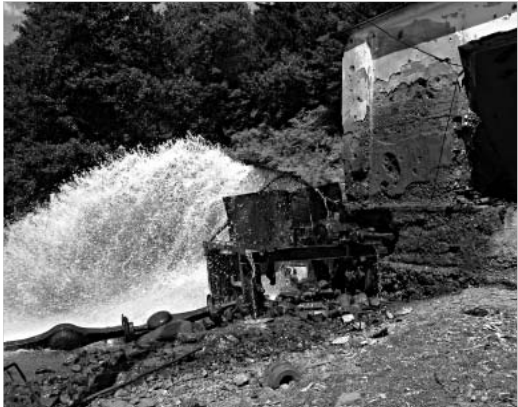
საერთაშორისო სტანდარტების წყლი უქმდ რომ არ იღვრებოდეს, ერთი ადამიანის მიერ დღე-ღამის განმავლობაში მოხმარებული წყლის ოდენობა, მაქსიმუმ, 230-350 ლიტრია.