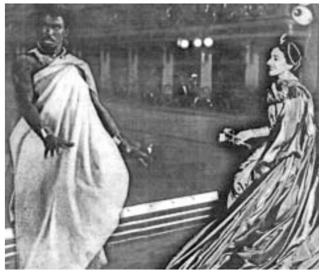
ღმერთთან წილნაყარნი: ვახტანგ ჭაბუკიანი და მარია კალასი.

ბატონი ავთანდილი ერთობლივი წიგნის დაწერას მარია კალასისა და ვახტანგ ჭაბუკიანის შესახებ იმით ხსნის, რომ "მარია კალასმა ვოკალური ხელოვნებაში ისეთივე სასწაული მოახდინა, როგორც ვახტანგ ჭაბუკიანმა ბალეტში." ასოციაცია "მზეჭაბუკისა" და საზოგადოება "მარია კალასის" ეგი-