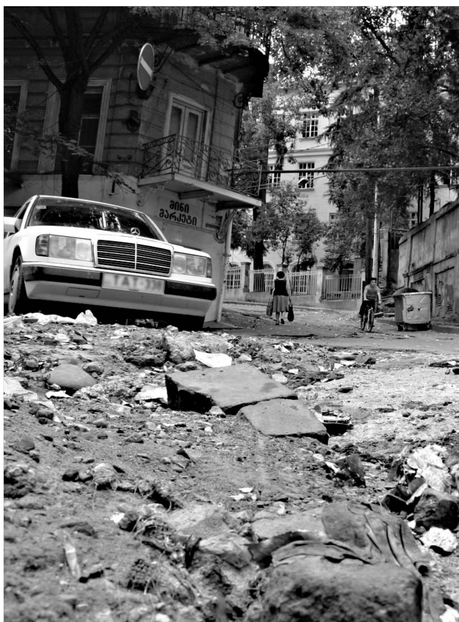
თბილისის ქუჩები და მერსედესები ერთმანეთთან შეესაბამება

თუ დავეთანხმებით მოსაზრებას იმის თაობაზე, რომ ქვეყნის სახე მისი გზების, მაშინ შეიძლება ითქვას, რომ ჩვენი გზების "პატრონთა" წყალობით, საქართველო საკმაოდ "ცხვირპირადამტვრეულად" გამოიყურება. იმის მიხედვით, თუ როგორ უფლის გზას, ქვეყანა აჩვენებს, რამდენად აქვს მას ცივილიზებულად ცხოვრების კულტურა. მით უმეტეს, მნიშვნელოვანია გზის მდგომარეობა ქვეყანაში, რომლის მთავარ საერთაშორისო ეკონომიკურ და, ლამის, პოლიტიკურ ფუნქციად ტრანზიტული ფუნქციაა ქვეყნის. თუმცა, იგივე ტურისტების განვითარებისთვისაც, რაც უკვე ახალი ხელისუფლების ერთ-ერთი უმთავრესი პრიორიტეტია, გზების განვითარება ერთ-ერთი უმნიშვნელოვანესი წინაპირობაა.