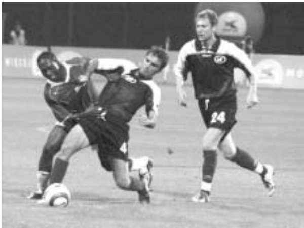
ვისლა კრაკოვში გამდგმებით ვიტედა.

ვისლა კრაკოვში გამდგმებით ვიტედა. "ვისლა" კრაკოვში გამდგმებით ვიტედა.