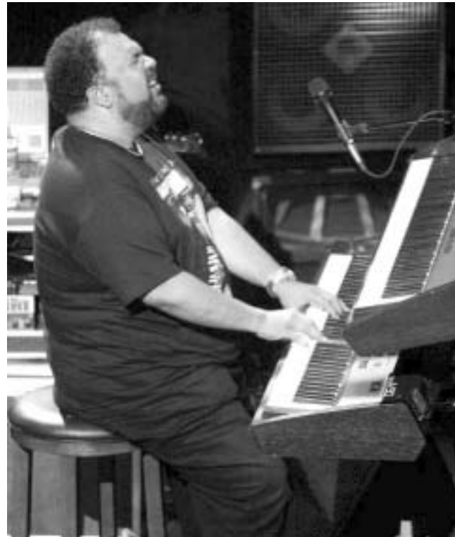
ქორჯ დიუკი თბილისის სექტემბერში ეწევა.

ერთხელ, ვორჯმა რადიოთერმომ ფრანგ მეციოლინეს ჟან-ლუკ პონტის მოუსმინა და როდესაც შიტყმო, რომ მუსიკოსი სან ფრანცისკოს ეწეო, მის პროდიუსერს საკუთარი ჩანაწერები შესთავაზა; თანაც, საკმაოდ თამამი განცხადებით: "არ არსებობს სხვა პიანისტი ჩემს გარდა ამ ადამიანისთვის". ამგვარად მოხდა მუსიკოსი ჟან-ლუკ პონტის ჩანაწერში; ხოლო, ამ ალბომის გამოსვლიდან ცნობილი გახდა, რომ პონტისა და დოუკის ერთობლე-