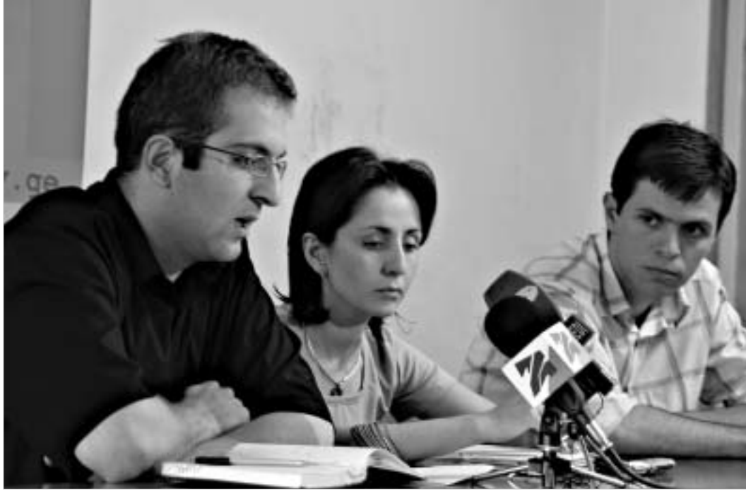
სასამართლო არის არა ხელისუფლების დამოუკიდებელი შტო. არამედ რეალურად პოლიტიკის და ნაწილობრივად დამოკიდებული შტო.

„სასამართლო გუშინდელი გადაწყვეტილებით ხელი საკუთარ უმწიფროსს მოაწერა და კიდევ ერთხელ დაადასტურა, რომ საქართველოში სასამართლო დამოუკიდებელი და სამართლიან გადაწყვეტილებებს ვერ იღებს. მოსამართლის გადაწყვეტილებას განაპირობებს არა კანონი, ადამიანის უფლებების დაცვა და სამართლიანობის პრინციპი, არამედ, ხელისუფლების წარმომადგენლების ან სხვა გავლენიანი პირების პირდაპირი მითითებები და კორუფცია. ჩვენ ვფიქრობთ, რომ სასამართლო სისტემის ძირითადი რეფორმა სასამართლო განხორციელდეს, რათა საბოლოო საზოგადოება, რომელიც სამართლიანობას და მიუკერძოებლობას, ადამიანის უფლებების დაცვას და დემოკრატიული პრინციპებით ხელმძღვანელობს, მართლმსაჯულების აღსრულებაში ჩაერთოს.“ - ასეთია „თავისუფლების ინსტიტუტის“ პოზიცია. „კმარას“ ლიდერს თუ თუთბერიძეს კი იმედს აქვს, რომ ისეთი