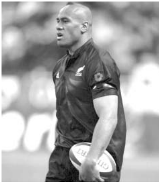
შესაძლოა, ლომუს თამაში განაახლოს

ახალზელანდიელი მორაგბის ათწლიანი ავადმყოფობა, შესაძლოა, სამ თვეში დასრულდეს