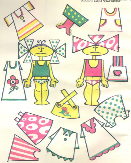
დახმარეთ გოგონებს თავისი კაბის მოძებნაში