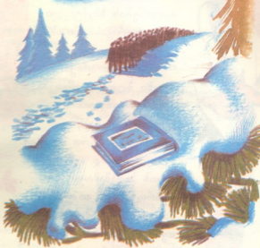
სამტაკარი პაწა პაწასული

იმ დღიდან ჩემი მეგობარი, როგორც კი პაწაწინა