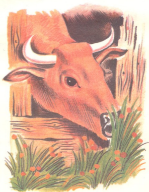
მხატვარი ვამა ქარხული