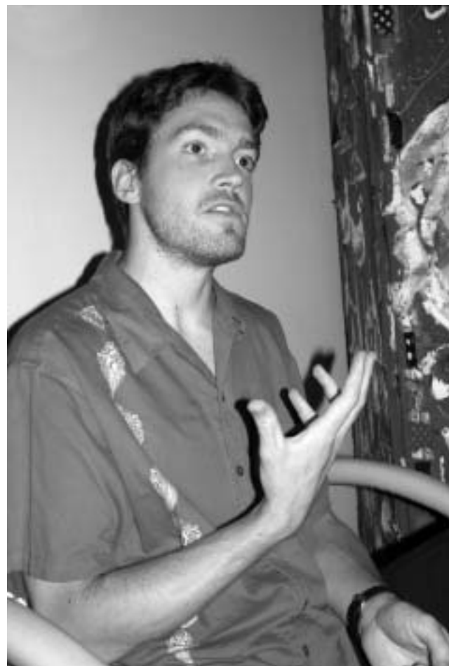
დღეში თუნდაც ათი წუთის განმავლობაში დააკვირდით თქვენს თავს. მოცხვეთი თქვენთვის მოსაფრთხილებელი მდგომარეობა და თვალყურით ადევნეთ თქვენს გონებას. აი, ეს არის მთელი პრაქტიკა.

იოგა დიდ სიამოვნებას მანიჭებს. სასიამოვნოა, როცა გრძობთ