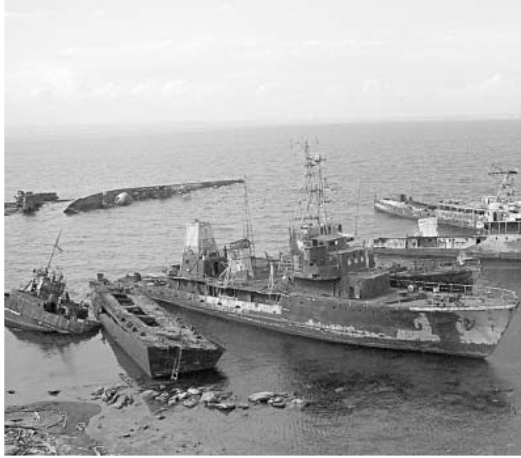
ნარგინი. მიტოვებული გემების სასაფლაო