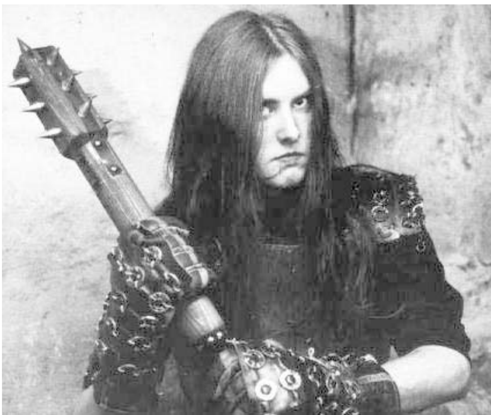
ვარგ ვიკერნესის ერთ-ერთი ყველაზე ცნობილი აქცია ეკლესიებისთვის სცეხლის მოკიდება იყო.

ორივე მიმართულებით იმარჯვა. ნორვეგიელი "ბლეკ მეტალის" შემსრულებლები მთლად ასე შორს ვერ წავიდნენ, მაგრამ პოპის დედოფალს დიდადაც არ ჩამორჩებიან.