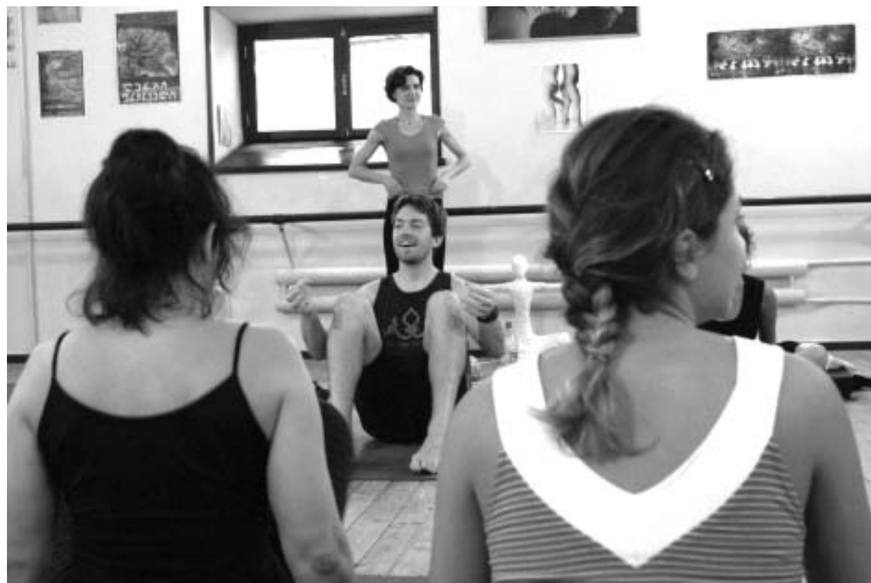
ზაზაპა აპოლალოპოლოსი ფოტოგრაფი

როგორ მალდები სულიერად, როგორ უბრუნდები ბუნებრივ მდგომარეობას.