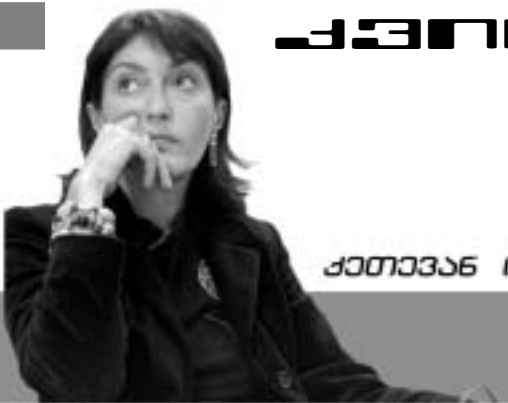
კეთილანობილი იტალიური დამამშრებელი