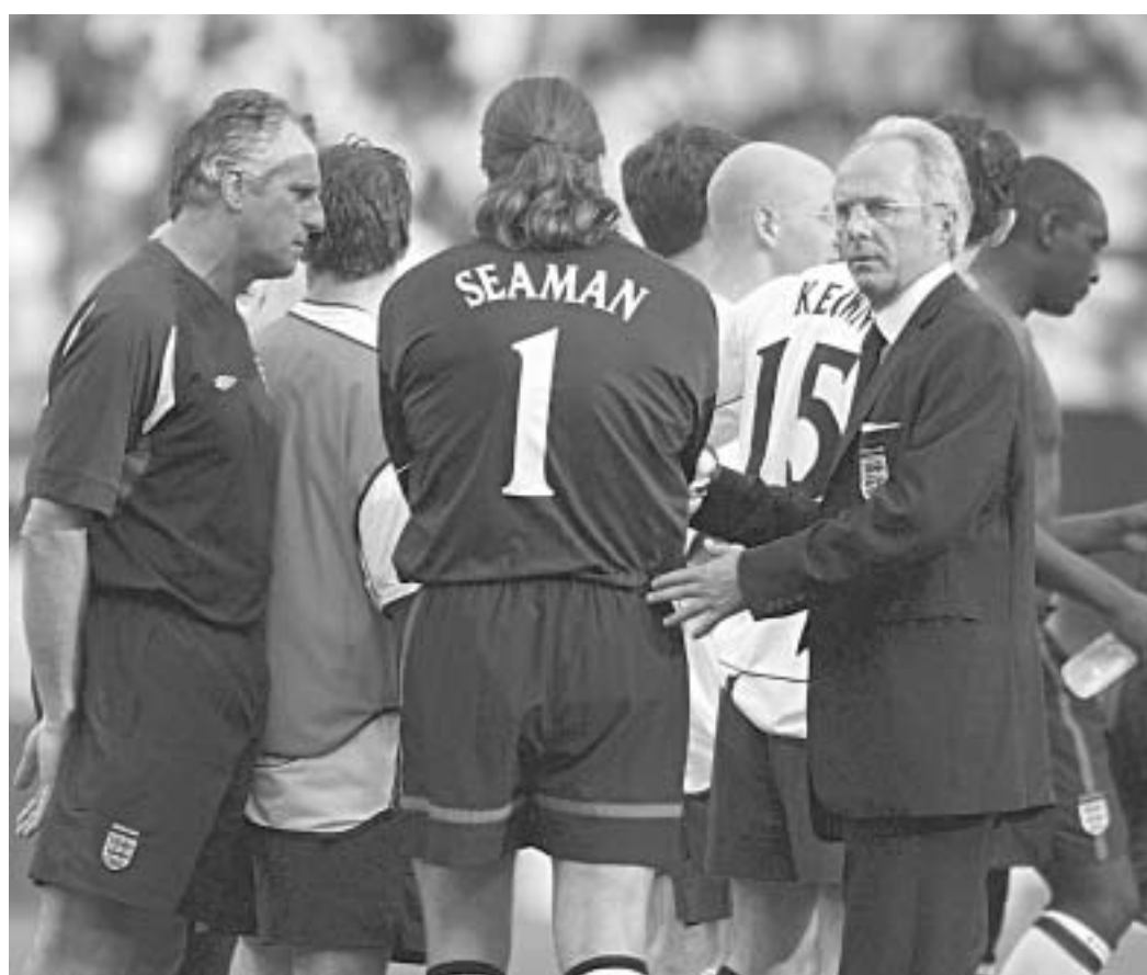
სვენ გორან ერიქსონი ინგლისის ნაკრებს 2008 წლამდე გაუძღვრის

სი დელ'ოლიოს (თან მათი ჩხუბის დეტალები ინგლისურ ტაბლოიდებში მოხვდა), შემდეგ კი ინგლისის ფეხბურთის ასოციაციის მდივანმა ფარია აღამმა საზოგადოების ყურამდე მიიტანა თავისი სექსუალური ფანტაზიები სვენ-გორან ერიქსონთან. დესერტად, კი მან საკმაოდ ცუდად ისაუბრა შვედის სექსუალურ შესაძლებლობებზე. თუმცა, ინგლისელებს სულაც არ სურთ ერიქსონის სექსუალური თავგადასავლების წარმატებებზე ფიქრი. ისინი შვედისგან შედეგებს ითხოვენ და სურთ, ინგლისის ნაკრებმა, რომელსაც 1966 წლის შემდეგ არაფერი მოუგია, ბოლოს და ბოლოს რაიმე სერიოზულ წარმატებას მიაღწიოს. ამიტომ, ბრიტანელებმა თვალი დახუჭეს ერიქსონის სექსუალურ თავგადასავლებზე, მით უფრო, რომ ამ საქმეში მთავარი დარტყმა საკუთარ თავზე ინგლისის ფეხბურთის ასოციაციის აღმასრულებელმა დირექტორმა მარკ პელიოსმა აიღო. ხუთი შეიღის მამამ, რომელსაც, ასევე, ჰქონდა სექსუალური კონტაქტი მის აღამთან, ქალბატონის აღიარების შემდეგ თანამდებობიდან გადადგომის შესახებ განცხადება გააკეთა. პელიოსის "განცეპების ვაცის" რომა თავისი საქმე გააკეთა და ერიქსონი თანამდებობაზე დაბრუნდა კომისია არც ფარავდა, რომ სურ-