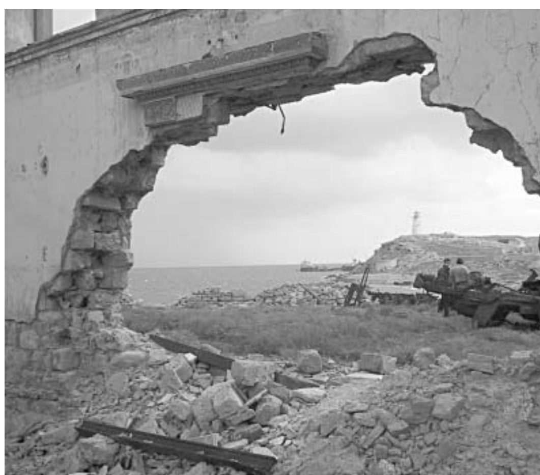
"ასეთი საშინელი, შემზარავი და უცნაური ადგილი არასდროს შემხვედრია".

რაც კუნძულზე დახვდათ, ისინი მაინც შოკში ჩააგდო.