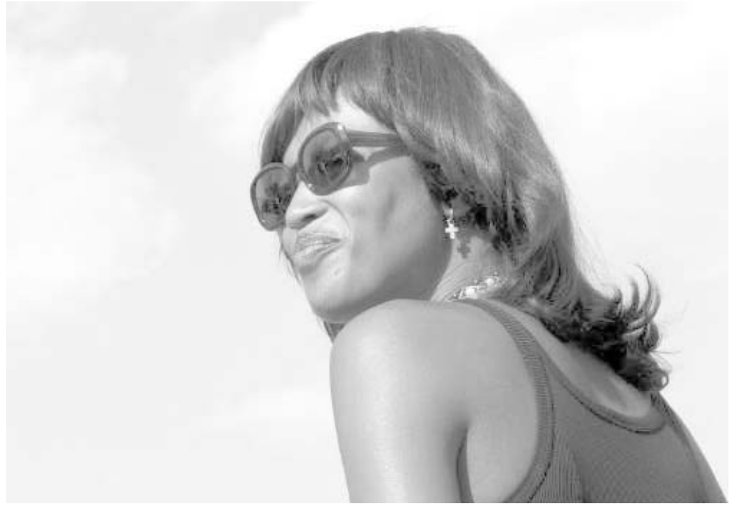
ოლიმპიური ჩირაღდნის ესტაფეტაში ნაომივ მიიღებს მონაწილეობას.