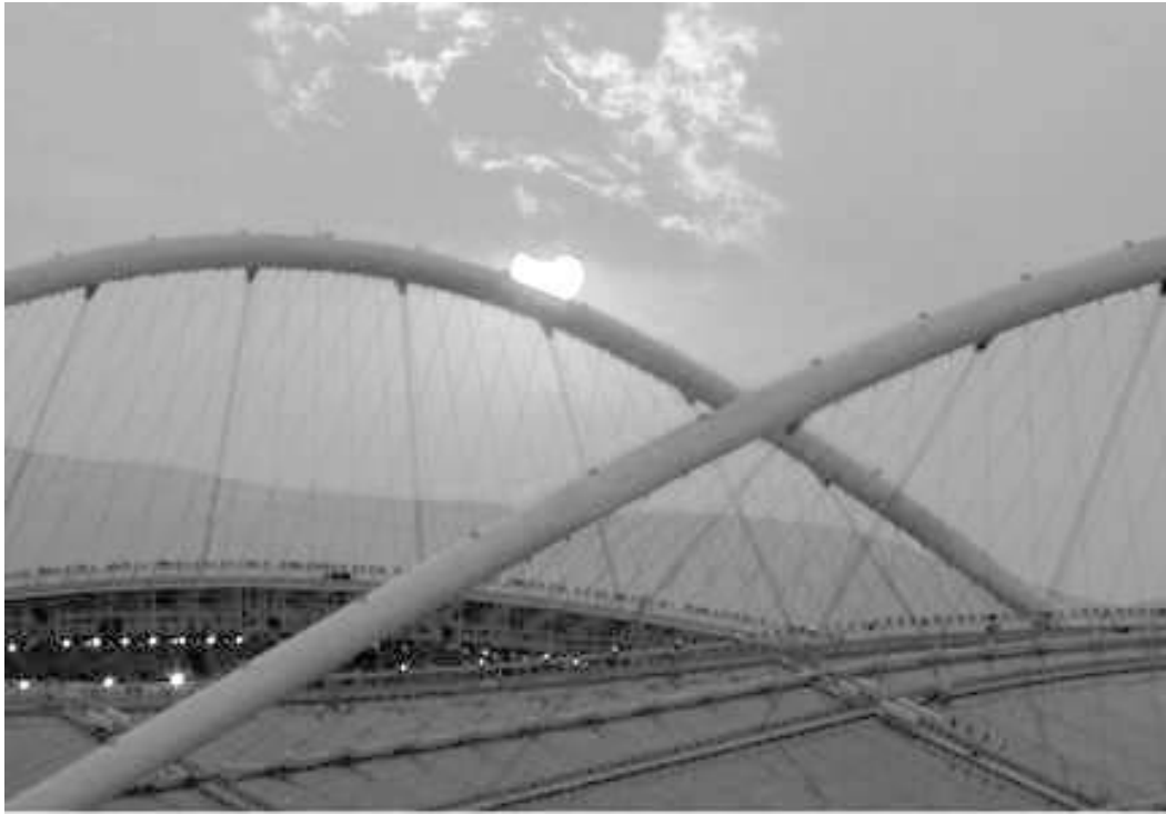
სტადიონი რომელზედაც ოლიმპიური თამაშების საზეიმო გახსნა შედგება.