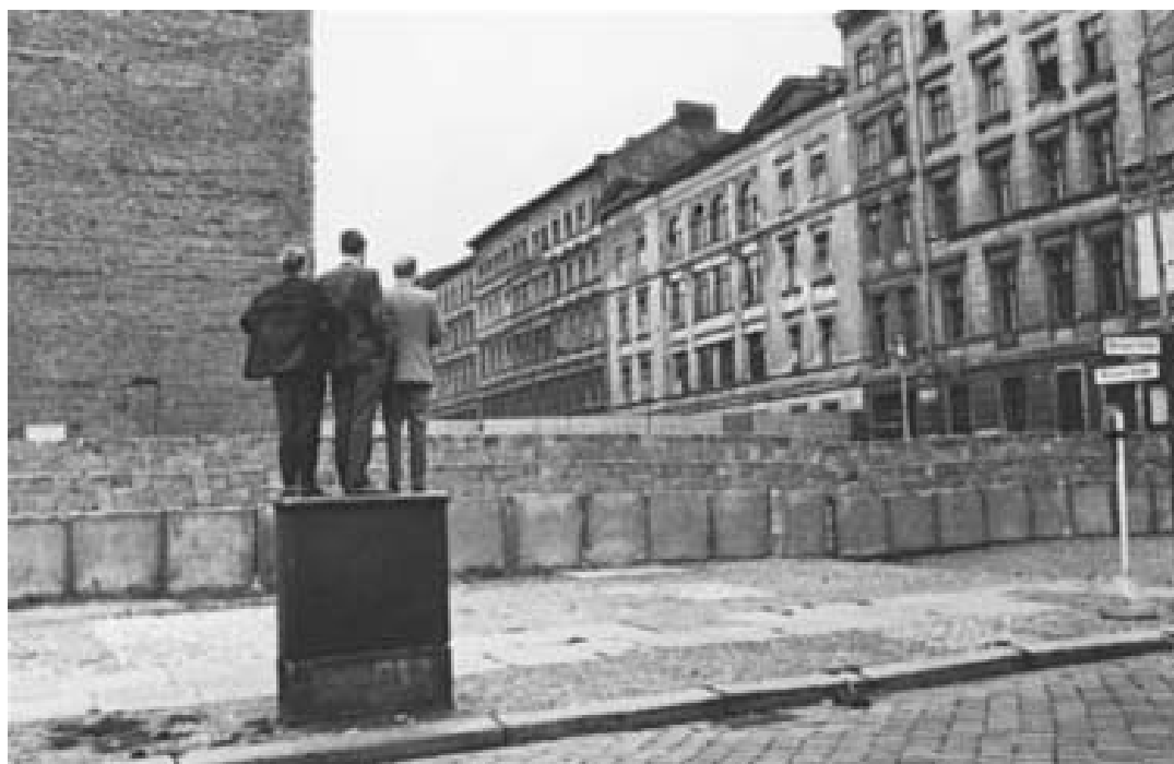
ანრი კარტი-ბრესონის ბერლინის კედელი.

ტურისტების ბერლინის კედლის ნაწილებს დიდი ენთუზიაზმით ყიდულობენ. ზოგი "ნანგრევი" ყალბია, ზოგი - არა (ცხადია, დროთა განმავლობაში სულ უფრო მეტი ყალბი "საქონელი" ჩნდება). გრა-