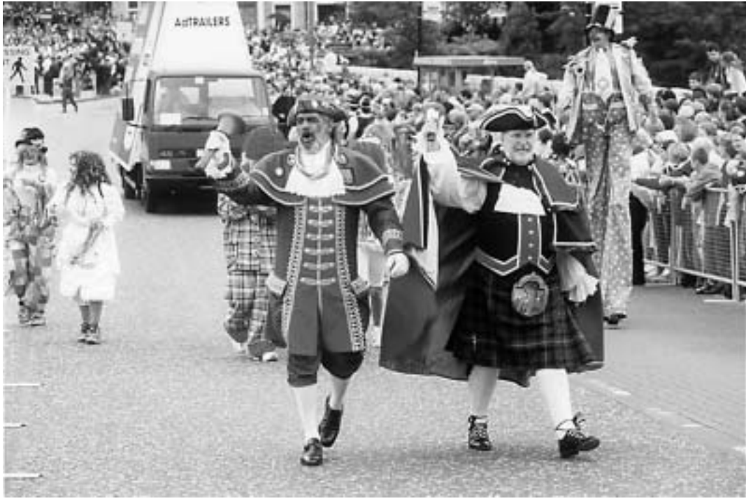
ერთი თვის განმავლობაში შოტლანდიის დედაქალაქის ყველა ნერტილში, თეატრალური დარბაზებიდან დაწყებული სკოლებით, ეკლესიებითა და რესტორნებით დამთავრებული თეატრალური სანახაობები, კომიკური, მუსიკალური და საცეკვაო შოუები გაიმართება.

ედინბურგის არაფორმალური ფესტივალის არსებობის პირველ ხანებში "ფრინჯი" მოყვარულების, ავანგარდისტებისა და ნაკლებად ცნობილი ხელოვნების თავმჯდომარის წარმოდგენადაა. კაბარე ეკლესიის შემოღობვაში, იაფფასიანი ბილეთები, სტუდენტური "კაპუსტნიკები" - ასეთ ასოციაციებს იხვევდა მაყურებელი თავდაპირველი "ფრინჯი". ახლა ვითარება შეიცვალა. ავანგარდისტებს პოპულარული ვარსკვლავები ჩაენაცვლენენ, იაფფასიანი ბილეთები შეცვალა შემოსავლიანმა კონტრაქტებმა და საქმიანმა მოლაპარაკებებმა ლონდონის უესტ-ენდში წარმოდგენის გამართვის თაობაზე. ამ ცვლილების კლასიკური მაგალითია ბრიტანელი იუმორისტის - პოლ მერტონ-