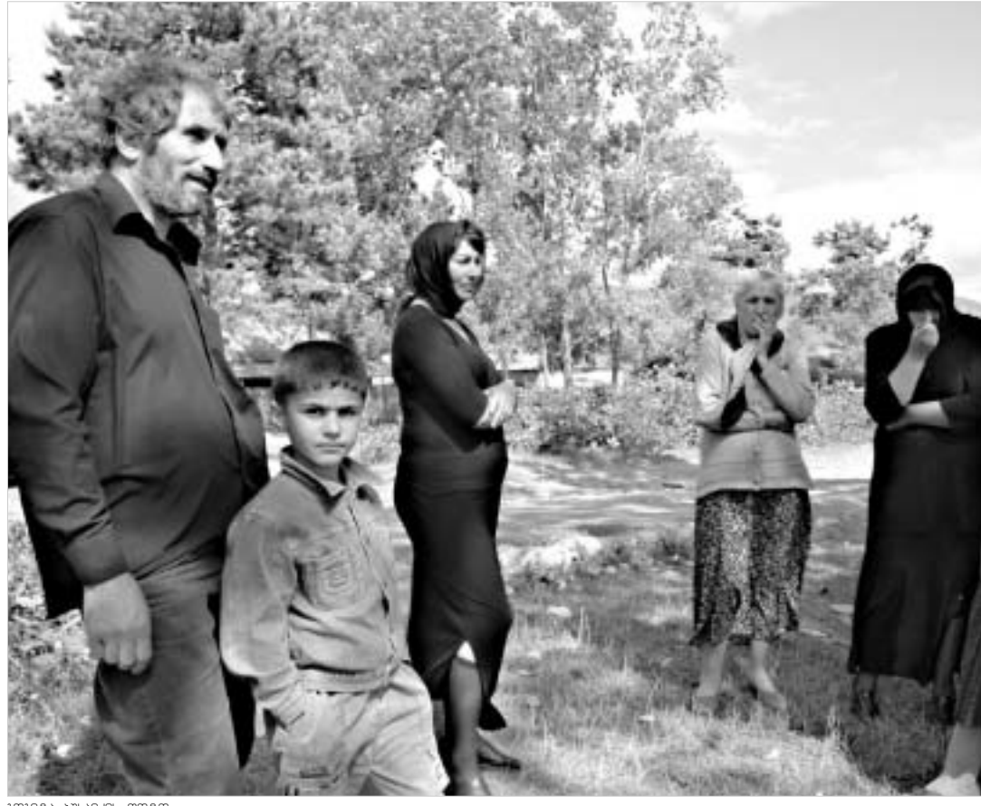
საქართველოს ხელისუფლებამ ცხინვალის რეგიონში, ჭერ-ჭერობით, ცეცხლის ჩაქრობის მიუღწია.

რომ სეპარატისტები და მათ უკან მდგარი რუსეთი დიალოგზე უარს ამბობენ და მიდიან „ ვითარების უკიდურეს პროვოცირებაზე. “ მოვლენათა კიდევ უფრო გართულების შემთხვევაში, პრემიერ-მინისტრმა პასუხისმგებლობა ოსურ და რუსულ მხარეს დააკისრა. “ჩვენ არ გვაქვს უფლება, მათასი ადამიანი დიდი ღიახვის ხეობაში და 6 ათასი ადამიანი პატარა ღიახვის ხეობაში დავეტოვოთ მხარდაჭერის გარეშე. “ სამშვიდობო პროცესებზე საუბრისას გუშინ პრეზიდენტმა სააკაშვილმა უშიშროების სამსახურის სხდომაზე საჯაროდ გაიხსენა კრაზი, რომელიც 1992-1993 წლებში რუსეთთან მოლაპარაკებებს მოჰყვა. იგი საუბრობდა სამშვიდობო მოლაპარაკებებზე, რომელთა გაფორმებიდან რამდენიმე დღის შემდეგ საქართველომ დაიკარგა აფხაზეთი. “რა თქმა უნდა, ჩვენ უნდა მივიყვით სამშვიდობო პროცესებს, მაგრამ თავს არ ვავისუფლებთ...” გუშინ საქართველოს უმაღლესი ხელისუფლების წარმომადგენლებმა აერაერთულ აღნიშნეს საეთაპრობო თანამშრომლობის მხარდაჭერის შესახებ. წუხუდ პრეზიდენტი შეხვდა ამერიკელი კლასი საქართველოში რჩინარდ მაილსს და ეუთო-ში ამერიკის ელჩს სტივენ მინიკესს. დახურული შეხვედრის შემდეგ საგანგებო ბრიფინგზე მიიკე-