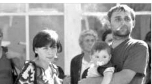
აქაურობას არ დატკობთ. ჩვენი მინაა.