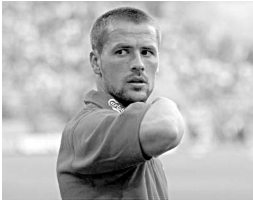
ოუენი კარმირას "რეალში" გააგრძელებს

ინგლისური ფეხბურთის "ოქროს ბიჭუნა", მსოფლიოს ერთ-ერთი ყველაზე სახელგანთქმული თავდამსხმელი, "ლივერპულის" სიმბოლო, ინგლისის ნაკრების უმთავრესი იმედი, მაიკლ ოუენი მშობლიურ "ლივერპულს" ტოვებს. ის იმავგზას დაადგა, რომელსაც დევიდ ბექჰემი ერთი წლის წინათ - მადრიდის "რეალის" მიმართულებით.