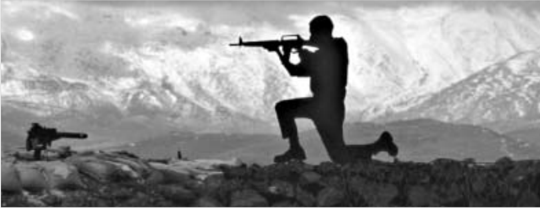
გეგმა ლაზას სექტორში შეიარაღებული ძალებისა და მდინარე სრულ გაყვანას და მდინარე იორდანეს დასავლეთ სანაპიროზე არსებული ასზე მეტი დასახლებიდან ოთხის დახურვას გულისხმობს.

ისრაელის არმიის მალლოზების განცხადებით, ისრაელმა შესაძლოა, გოლანის მალლოზებიდან თავისი ჯარი გამოიყვანოს, რაც სირიასთან მომავალი სამშვიდობო ხელშეკრულებით არის გათვალისწინებული.