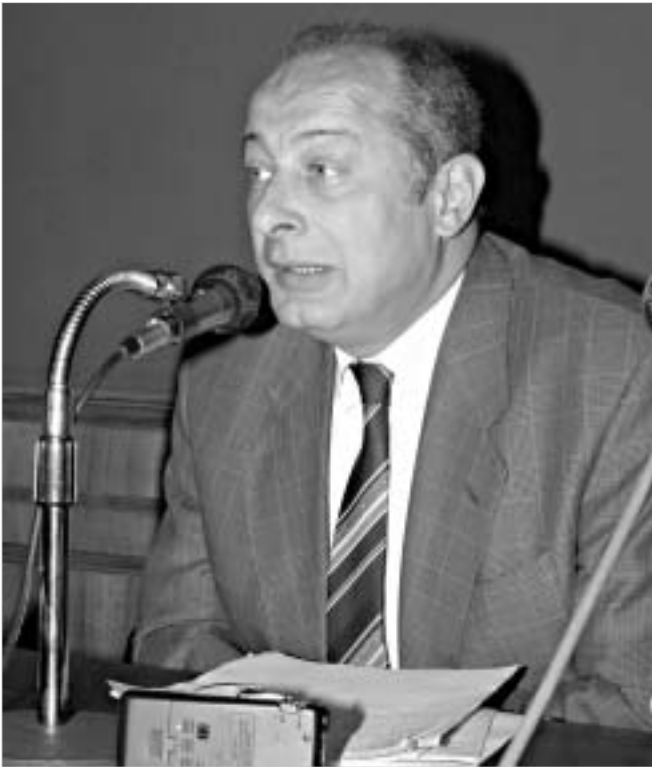
თავის დროზე ნოდარ ჯავახიშვილი სისხლის სამართლის პალატის დეპუტატის იმნიტეტმა იხსნა.

საქართველოს ყოფილი ბანკის ყოფილი პრეზიდენტი, ყოფილი პარლამენტარი ნოდარ ჯავახიშვილი, რომელიც სამართალდამცველებმა გუშინწინ დააკავეს, სავარაუდოდ, დღეს წარდგება სასამართლოს წინაშე. ამჯერად, მართლმსაჯულება მხოლოდ იმას გადაწყვეტს, შეუფარდოს თუ არა მას წინასწარი პატიმრობა.