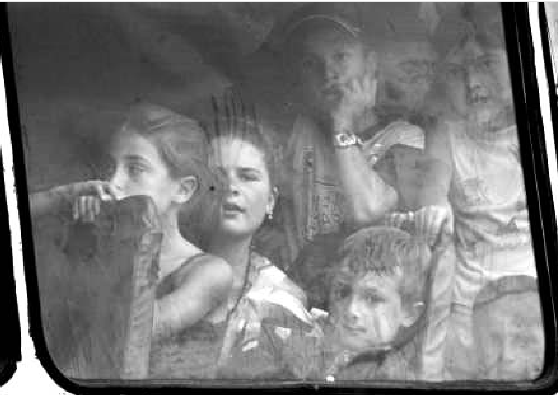
ლიხვის ხეობელი ბავშვები ახალ სასწავლო წელს მშობლიურ კერებზე და მშობლიურ სკოლებში მზადდებიან.