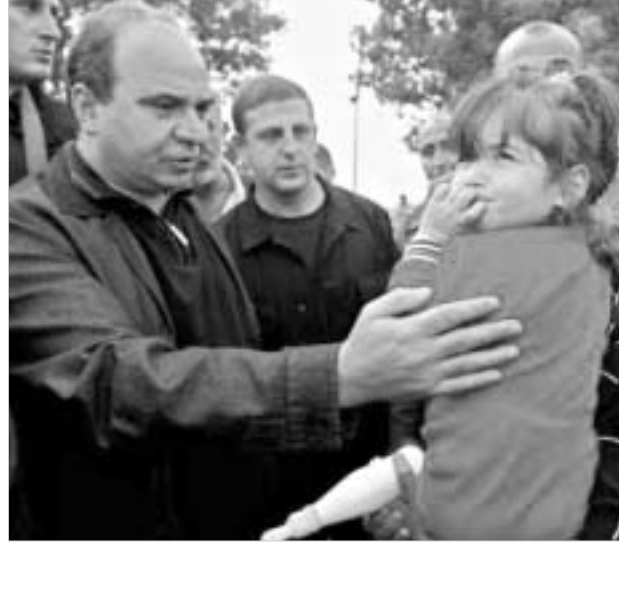
პრემიერ-მინისტრის შეფასებით, ცხინვალის რეგიონში მცხოვრები ქართველი მოსახლეობა შეშინებული უფრო კატასტროფის წინაშე აღმოჩნდა.

ზონაში, ეცნობიან სიტუაციას, აკეთებენ გამაფრთხილებელ და მკაცრ განცხადებებს, თუმცა ჯერჯერობით, უმეტედად, ოსური მხარე ცეცხლს მათაც უხსნის. საქართველოს პრემიერ-მინისტრი კონფლიქტის ზონაში მთელი ღამე იმყოფებოდა, მაგრამ მამინ, როდესაც იგი დიდი ღიახვის ხეობიდან შემოულითი გზით პატარა ღიახვის ხეობის ქართულ სოფლებში მიემართებოდა, ოსურმა შეიარაღებულმა ფორმირებებმა მის კორტეჟს სხვადასხვა სახის იარაღიდან ცეცხლი გაუხსნეს. პრემიერ-მინისტრის ცეცხლის ზონიდან გაყვანა მოხერხდა. “ეს რუსეთის ხელისუფლების და სამხრეთ ოსეთის სეპარატისტული მთავრობის პასუხია საქართველოს ხელისუფლების სამშვიდობო პოლიტიკაზე და დღეს სამშვიდობო მოლაპარაკებების გამართვის წინადადებაზე, ოსი ბოეიკებისთვის კარგად იყო ცნობილი, რომ ეს საქართველოს პრემიერ-მინისტრის კორტეჟი იყო და რომ მას სწორედ ამ დროს და ამ ადგილზე უნდა გაეყოლია, ამდენად ნათელია, რომ ისინი მიზანმიმართულად, დამიზნებით ისროდნენ,“ - აღნიშნა ზურაბ ფეხნაიმ ფაქტის კომენტარებში. გუშინ დილით, დიდი ღიახვის ხეობაში ყოფილა პრემიერ-მინისტრმა სოფელ თამარაშენში მეღანეცილების ოჯახს მოინახულა და ოსი სწავლებლის მიერ მოკლული თამაზ მეღანეშვილის ჭრიუსუფლებს პირადად მიუსამძიმრა.