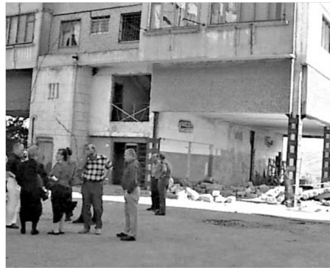
ქალაქის მთავრობის საბიუჯეტით აღადგინებული ავარიული სახლების რეკონსტრუქციის სამუშაოების პირობები გააუმჯობესოს.

აღნიშნული პროექტი ითვალისწინებს, საქართველოს დედაქალაქის შესახებ კანონის საფუძველზე, დაფუძნდეს შერეული საკუთრების სააქციო საზოგადოება, სადაც თბილისის მთავრობა აქციების 25 პროცენტს მფლობელი იქნება. დანარჩენ დამფუძნებლებს კი უნდა წარმოადგენდნენ ინვესტორები, რომელთა წილიც 25 პროცენტს არ უნდა აღემატებოდეს. "ასეთ შე-