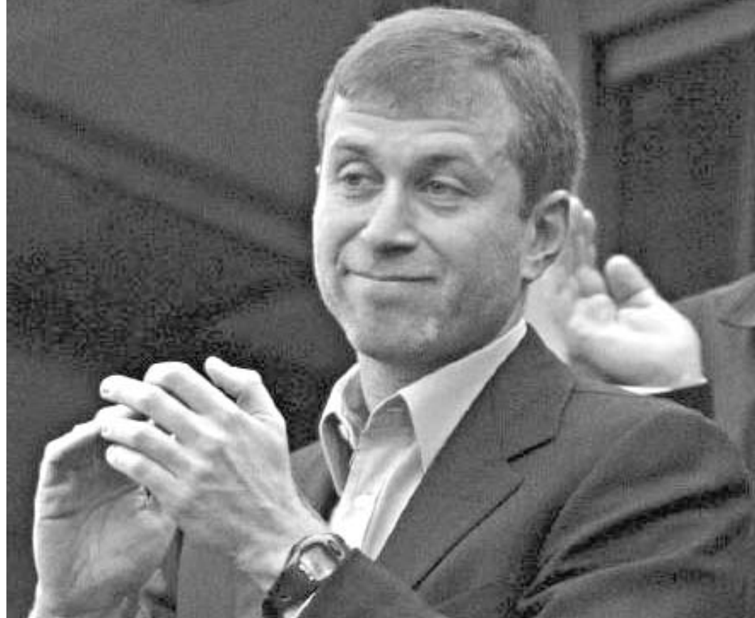
აბრამოვიჩის "ჩელსის" წელს დიდ წარმატებას უწინასწარ მეტყველებენ

მიუხედავად ყველაფრისა, ბევრი ფიქრობს, რომ წლევიანდელი სეზონი "ჩელსის" იქნება. რუსი ოლიგარქის რომან აბრამოვიჩის მიერ გუნდის ყიდვის პირველ წელს "ჩელსიმ" დიდ შედეგებს ვერ მიაღწია. მართალია, ის მუდამ მონიშნავდა შორის იმყოფებოდა, მაგრამ ამბიციური აბრამოვიჩისთვის ეს საკმარისი არაა. "აბრამოვიჩის ერის" მეორე წელს გუნდში მნიშვნელოვანი ცვლილებები განხორციელდა და ეს სამწვრთნელი შტაბსაც შეეხო და ფეხბურთელთა სწორედ ამან ჰქვია "ლურჯები" წლევიანდელი ჩემპიონატის მოგების უპირველესი ფაქტორებია. გუნდიდან წავიდნენ - ზუან სებასტიან ვერონი, ჯიმი ფლოიდ პასელბანიკი, ერნან