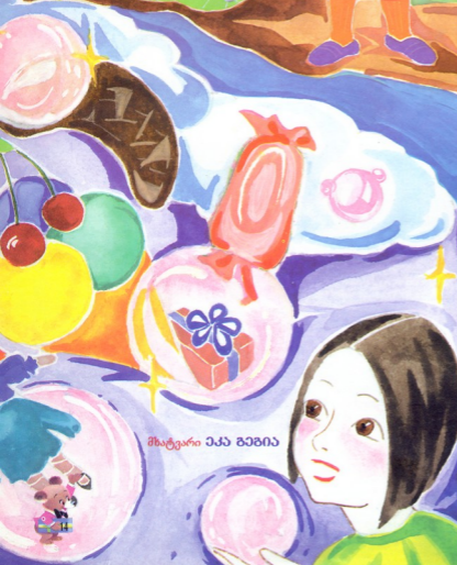
მხატვარი ეკბ ზაზბი