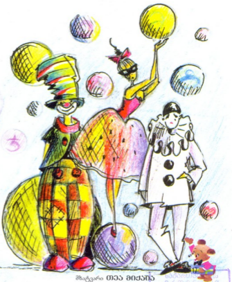
შატკარი თაა მიძინა

ცირეც ყველას გიყვართ - ვის კლოუნები გამხიარულებთ ყველასე მელად, ვინ ავრობატეპის თავბრულამხვევ ვარჯიშებს შესწერებისართ სურნეაქაშეკრული, ვინ - კეკელიბრისტების მაღაყებს ბაგიორზე, ბურთზე, მავითულზე, ერთმანეთზე შედგმულ სკამებზე... ახლა გაწვთინილი ცხოველები! ახლა თეფშების, ბურთების, რგოლების ბაზრიაღ-ტრიალი ჟონგლიორების ხელში! ჩვენ გვიხდა, სიტყვებით ჟონგლიორობა გასწავლით. აიღეთ სიტყვა კეკელიბრისტია . შეეჯობრეთ ერთმანეთს, ვინ მეტ სიტყვას გამოიყვანს მისი შემადგენელი ასოებიდან. (რომ არ დაიბნეთ, ჯერ ერთი მარტივი სიტყვის მაგალითზე ვაჩვენებთ, როგორ უნდა ეს „სიტყვების გამოყვანა“. ავიღოთ სიტყვა „აზრი-აღა“. აქედან შეიძლება გამოვიდეს სიტყვები - აზრი, ბაზარი, ბრაზი, ბია, მზა, ჭაზრი, ზარი, რაზა, ლარი და სხე). დაიწერეთ იმდენ-იმდენი ქულა, რამდენი სიტყვაც გაქვთ თითოეულს. ახლა ამ ქულებს მიუმატეთ სხვა „მონაგარიც“ - სამ მეტმარცვლიან ყოველ სიტყვაში 5-5 ქულა მიითვალეთ, ორმარცვლიანში - 3-3 ქულა, თითო მარცვლიანში კი - თითო ქულა. შეკრებით თქვენი ქულები და გამოავლინეთ გამარჯვებული. აი, ნახავთ, როგორ მოვაქონებთ ასეთი თამაში. სხვა დროს თქვენ თვითონ აირჩიეთ რამე სიტყვა და „ჟონგლიორეთ“.