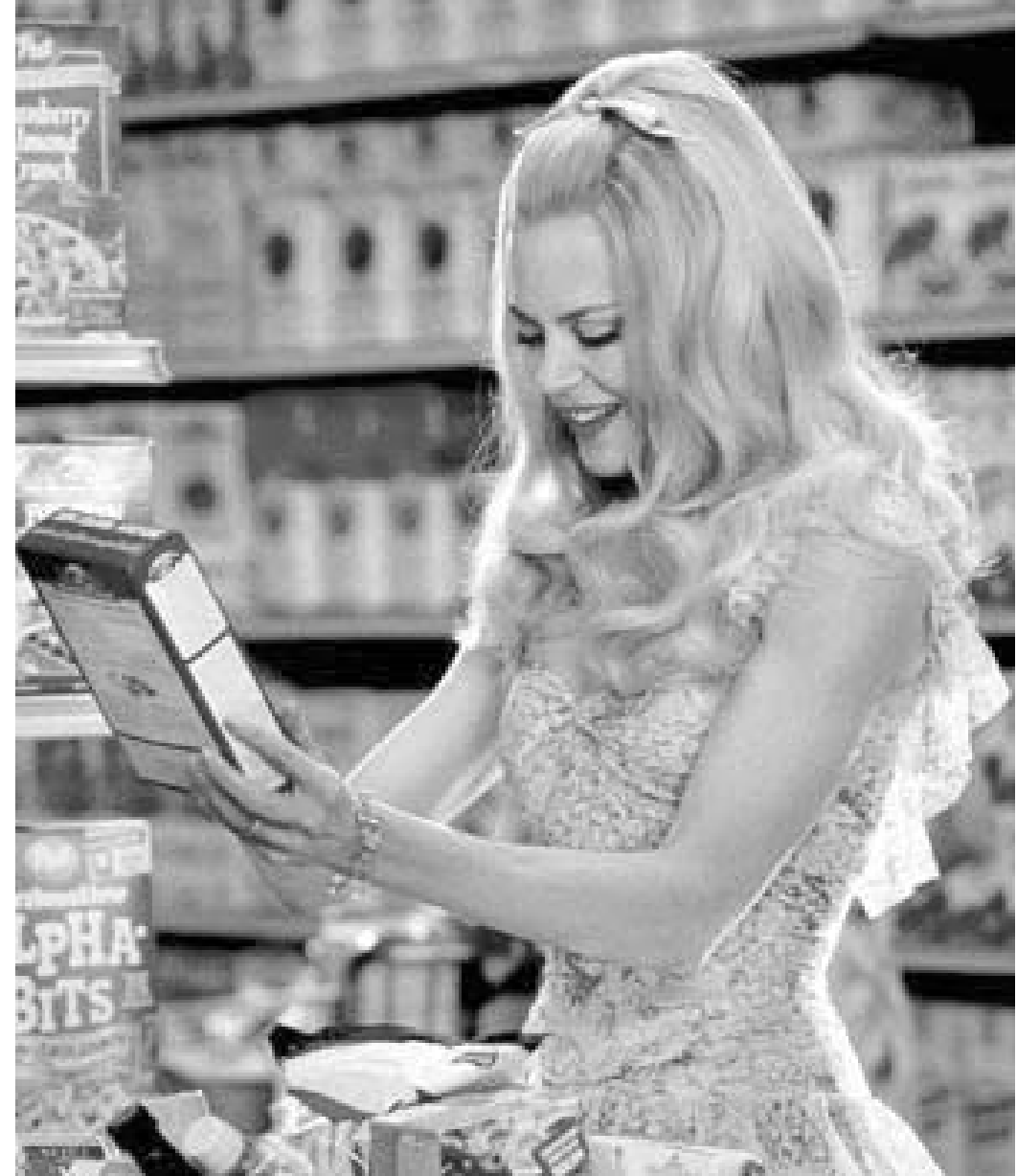
მოდის ახალი ტენდენციები თბილისშიც შეინიშნება.

ფილმის სიუჟეტი, ალბათ, ბევრისთვის ნაცნობია. ცნობილი ტენდენციები ჯოჯოხეთის (მას ნიკოლ კიდმანი ასახიერებს) გახმაურებულ სანდალში ეხვევა და სამსახურს კარგავს. იგი იძულებულია ქმარ-შვილთან ერთად პროვინციულ ქალაქ სტეპფორდში გადავიდეს საცხოვრებლად. სტეპფორდის პასტორალური ყოფა ჯოჯოხეთის საკმაოდ უჩვეულოა: "შემდეგული ქმრების" "ნესიერი ცოლები" აქ ძირითადად მაღაზიებში სიარულით, სახლისა და ეზოების მორთვით და ტკბილეულის გამოცხობით არიან დაკავებული, ვენბიანად უყვართ საკუთარი ქმრები და ყოველთვის იღიმებიან. ჯოჯოხეთის მოუწვევადგილობრივ ნეს-წყობილებისადმი დამორჩილება. თუმცა, ბრძოლა ხანგრძლივი და დაუნდობელი იქნება.