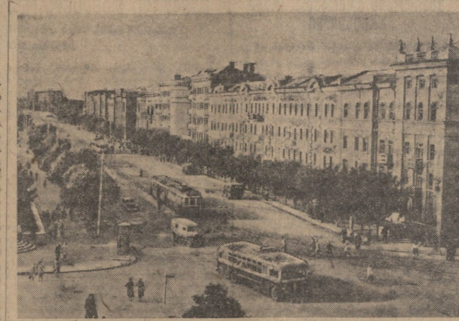
სარაინის სსრ. ქალაქი სტალინი. არტომის ქუჩა. (საქმის ფოტოკოორდინატი).