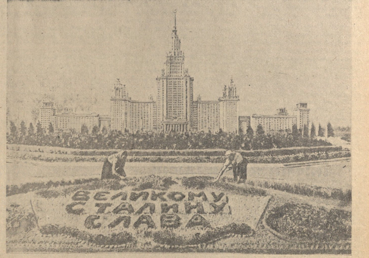
მოსკოვი. მოსკოვის სახელმწიფო უნივერსიტეტის მაღალ შენობისათვის ღენინის მთებზე.

დიდი აღმავლობით შრომობენ სხვა საქართველო კოლექტივები. ყრილობის აღსანიშნავი შეჯიბრების დღეებში იმ მუშათა რიცხვი, რომელიც შრომის ჩქაროსნულ მეთოდებს დაუფლენს, ქარხანაში 10 პროცენტით გადიდა.