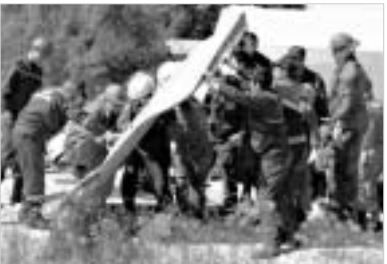
სამი დღის წინ მომხდარ ავიაკატასტროფებს ძნელად მიაწერ შემთხვევითობას.