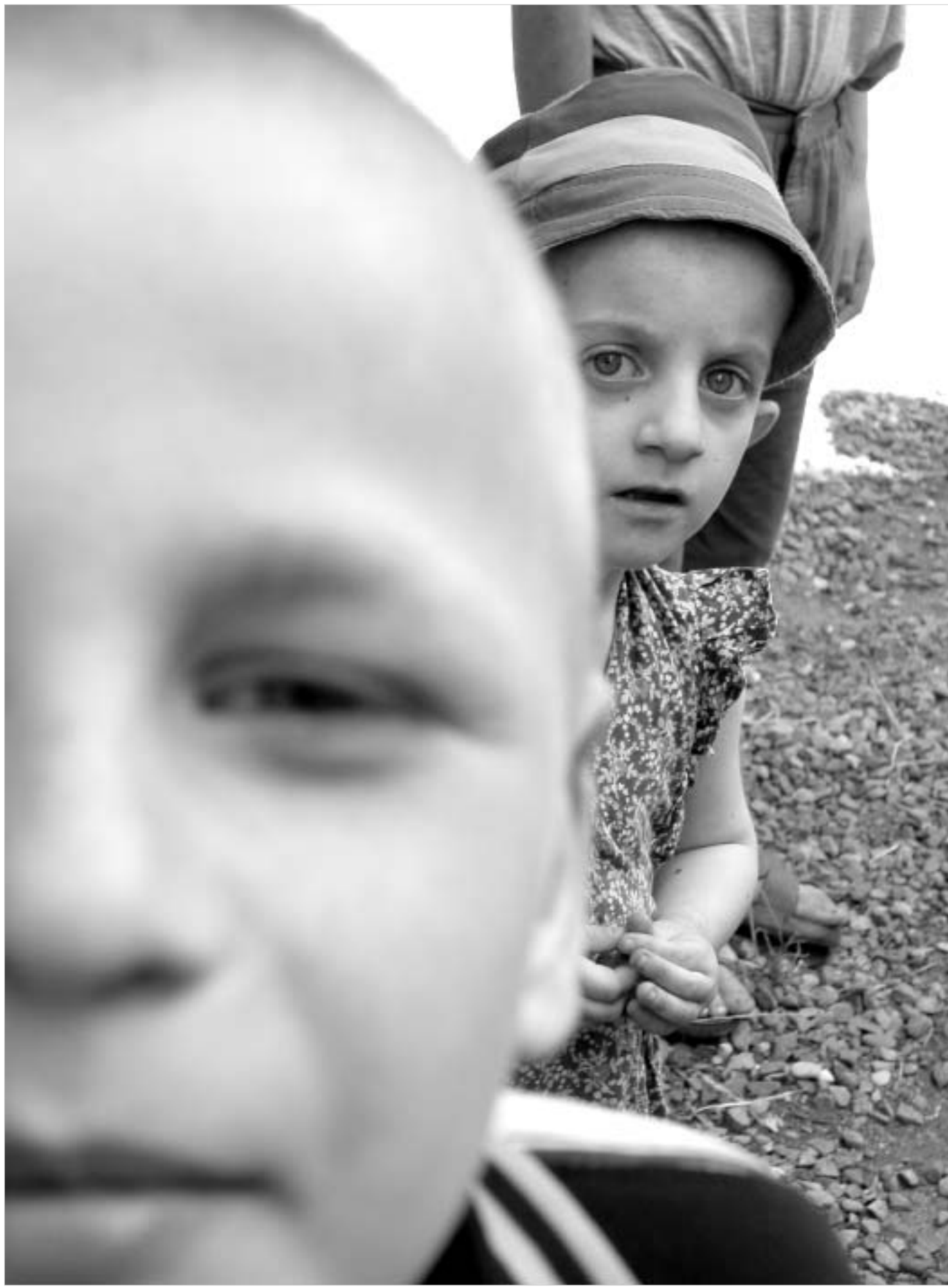
ბავშვთა სახლის აპოლონის ფოტო

უპატრონო ბავშვების 87 პროცენტს მშობლები ჰყავს