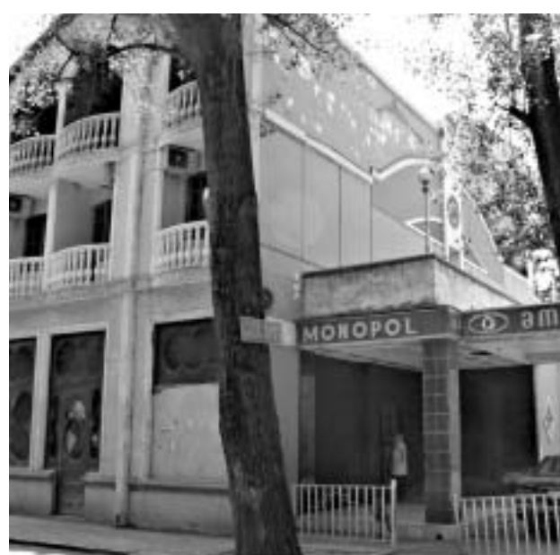
კინოთეატრი "მანხაი" საბჭოთა კავშირის დაშლის შემდეგ სახელმწიფო გადაიბარა.