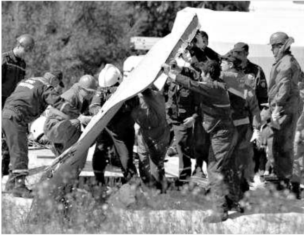
სამი დღის წინ მომხდარ ავიაკატასტროფებს ძნელად მიანერ შემთხვევითობას.

მაგრამ უამისოდაც მოსკოვის ანალიტიკური წრეები შემაშფოთებულ პროგნოზს აკეთებენ: ისინი მომხდარს ლოკალურად უკვე შირებენ ჩეჩნეთში დაგეგმილ რეგარემე საპრეზიდენტო არჩევნებს. საგარეოდ, იქვერის წინააღმდეგობის მებრძოლთა აქტივობა თავის კულმინაციას არჩევნების დღეებში მიაღწევს, რაც, თავის მხრივ, რუსეთის სპეცსამსახურებს კონტრდატყვისათვის