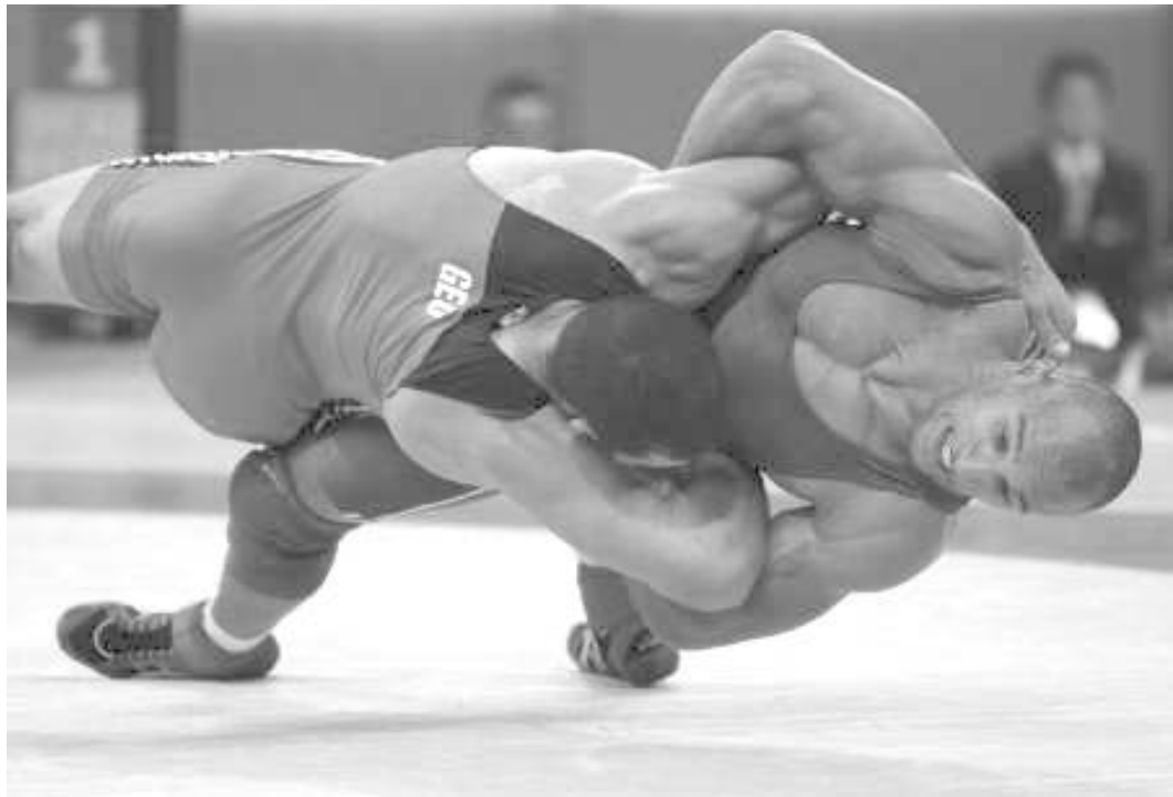
ეგვიპტელმა ქართველმა მარტოლა აკობა.