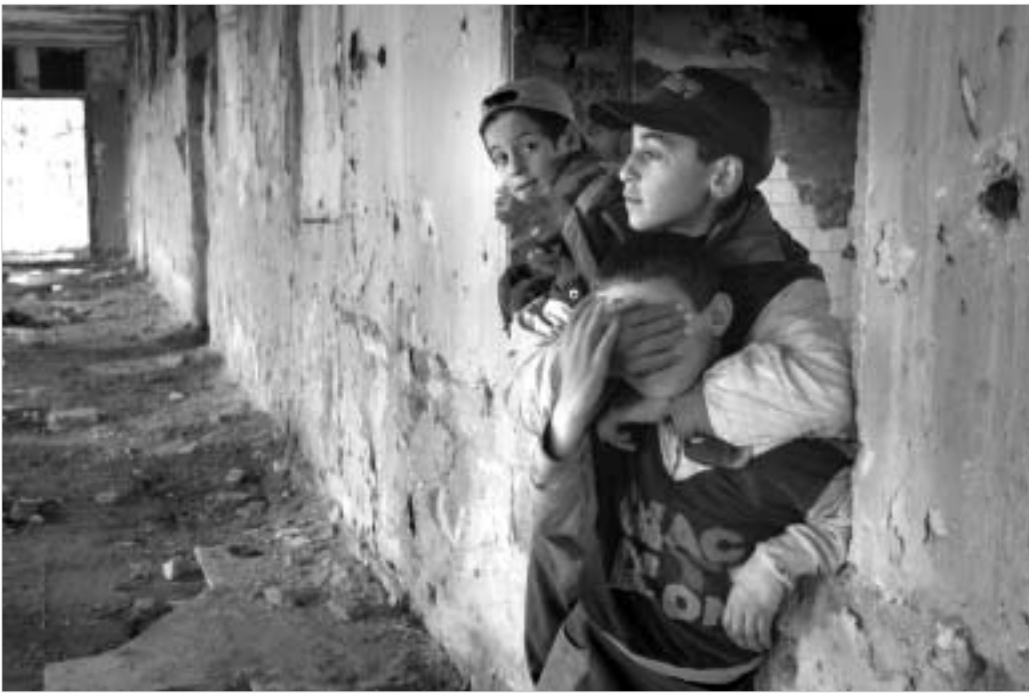
ბაიასი უკონკლავაბილი ობოლი