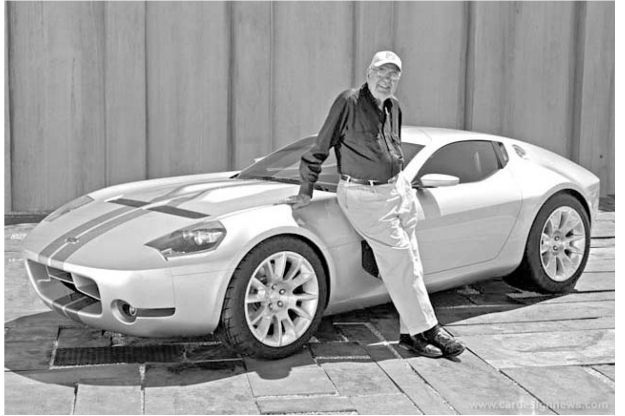
81 წლის ქროლ შელბი თავის მორგებულ კონცეპტუალურ ავტომობილს

შელბიმ შეკვეთის მიხედვით დამზადებული პირველი კონცეპტუალური ავტომობილი, სახელად "შელბი კობრა", წლის დასაწყისში, დეტროიტის ავტოსალონზე წარმოადგინა. როგორც "ფორდის" წარმომადგენლები ამბობენ, ეს ავტომობილი ახალი პროექტისთვის ბაზისად იქნება გამოყენებული. "შელბი" GT-ს პლატფორმას, მის აგრესიუტებს და დაკიდების სისტე-