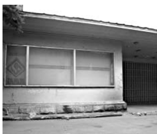
თავის დროზე ნუგზარ შევარდნაძემ კინოთეატრი "გაზაფხული" 97700 დოლარად შეისყიდა. არა "ქართული ფილმისგან", არამედ დამოუკიდებელი მს "გაზაფხულის" ხელმძღვანელებისგან. რომელმაც უკანონოდ გასცა კინოთეატრი.