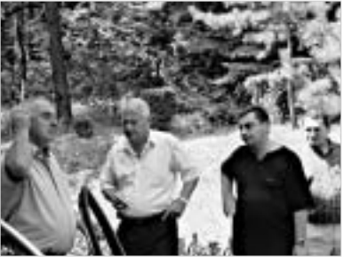
დარბაზიდან გამოსვლა და "დრუჟბის" გამაყრუებელი ხმის გაგონება ერთი იყო. მექანიკური ზუზუნის დასასრულს ხის ტყევის (ანუ ნაქცევის) ხმა თავად მოვისმინე და ვინმესთვის კითხვა არც დამჭირებია.