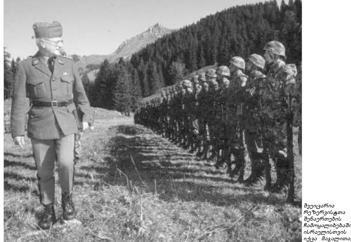
შვეიცარია რეზერვისტთა შენახვის ჩამოყალიბებაში ისრაელისთვის იქცა მაგალითად.

ყველაზე ინტენსიურ სწავლებებს სწორედ შევიცარიის უტარებენ. ყოველ მათგანს საკუთარი იარაღი თუ სამხედრო აღჭურვილობა სახლში აქვს.