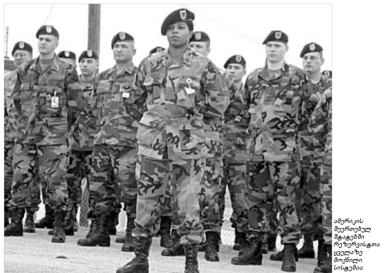
ამერიკის შეერთებულ შტატებში რეზერვისტთა ყველაზე მოქნილი სისტემაა.

მსოფლიოში ყველაზე კარგად ორგანიზებული სარეზერვო სისტემა ამერიკის შეერთებულ შტატებშია შექმნილი. იქ სამი ტიპის სარეზერვო ჯგუფი არსებობს: შერჩეული რეზერვისტები, პირადი მზადყოფნის რეზერვისტები და გადამდგარი სამხედროები. შერჩეული რეზერვისტების ჯგუფი (Selected Reserve), პრეზიდენტის განკარგულებაში მყოფი ყველაზე სწრაფად მობილიზებადი რეზერვისტთა ჯგუფია. პირადი მზადყოფნის რეზერვისტთა ჯგუფი (Individual Ready Reserve) არიან პროფესიონალი ჯარისკაცები, ვინც სამოქალაქო სამსახურშია, მაგრამ რომელთა გამოძახებაც შესაძლებელია აქტიური ჯარისკაცების ჩასანაცვლებლად. მესამე ჯგუფი კი (Retired Reserve), უმეტესწილად, 715 ათასი გადამდგარი სამხედრო პირისაგან შედგება. ამერიკის შეერთებული შტატების სარეზერვო ჯგუფში მომსახურე ყველა მოქალაქის მთავარი მიზანია ქვეყნის დაცვა და მშვიდობის შენარჩუნება. შერჩეულ შტატებში რეზერვისტების მობილიზაცია ელვისე-