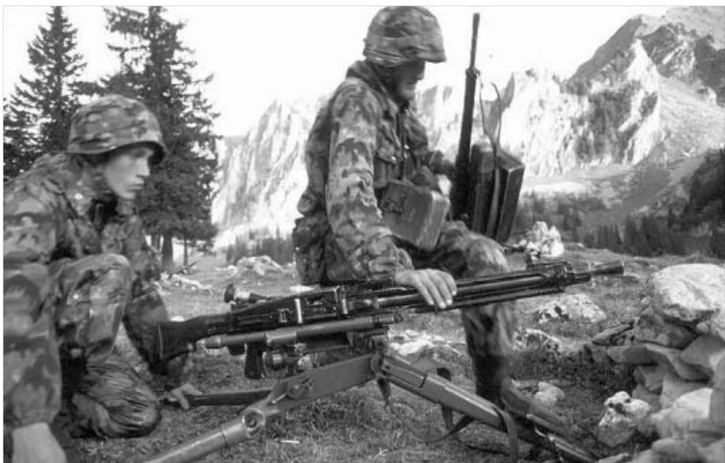
შვეიცარიის - მხარი ნეიტრალიტეტის ქვეყანა, რომლის შეიარაღებული ძალების უმეტეს ნაწილს რეზერვისტები ქმნიან.

ომისათვის არ ვემზადებით, მაგრამ ქვეყანას დაცვა სჭირდება