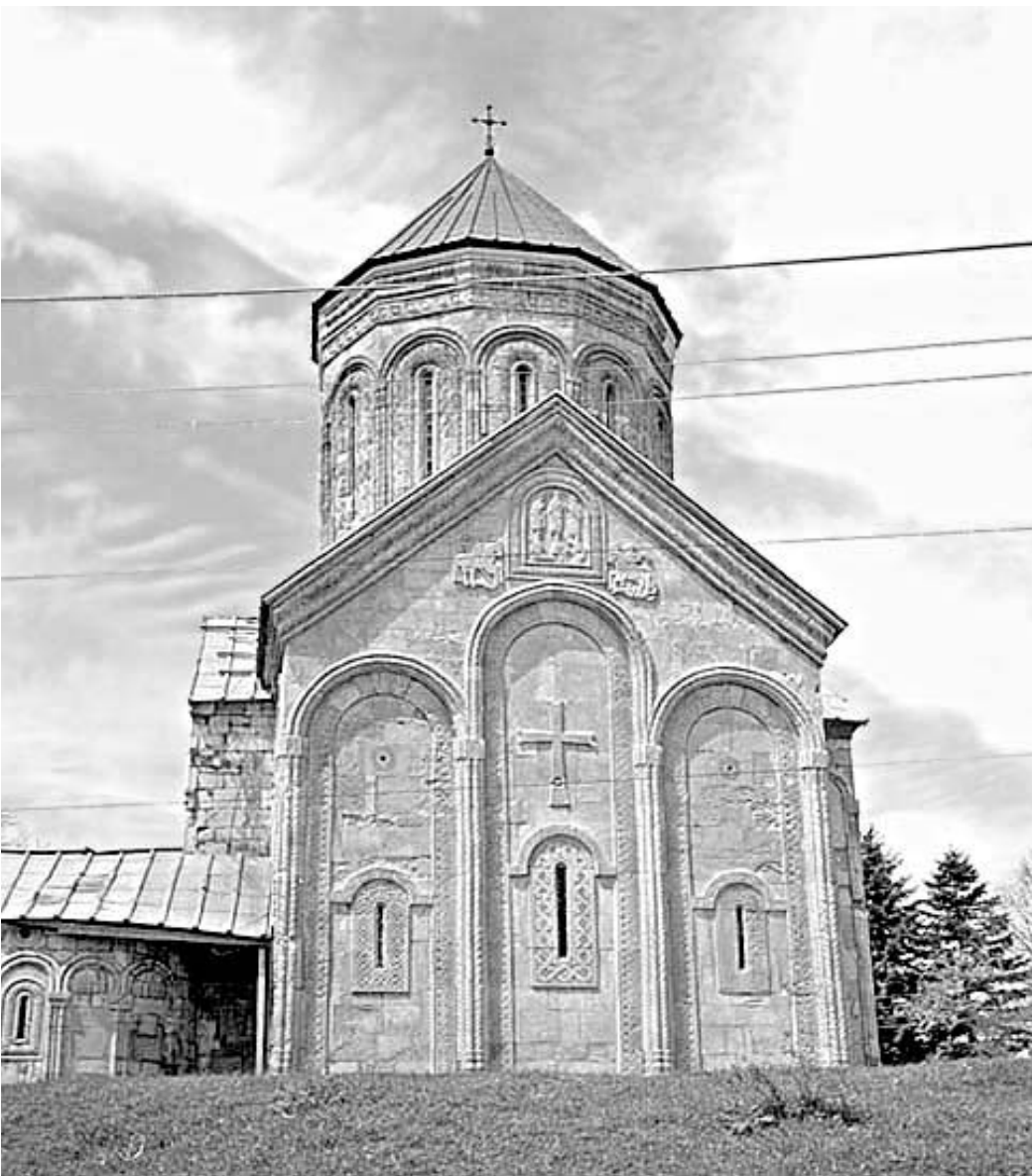
ადრე ისე უბრალოდ კი არ აგებდნენ. "გრძობილი ანთეიდენი" და წლებს გადასცემდნენ. როგორც ნიკორწინდას.