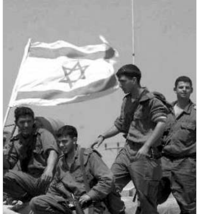
ისრაელელი რეზერვისტები - სამხედროები, რომლებიც 11 თვე შვებულაში არიან.