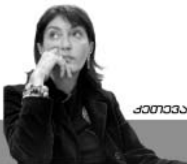
კეთილშობილი იმპერატრიცა ნარკოტიკების