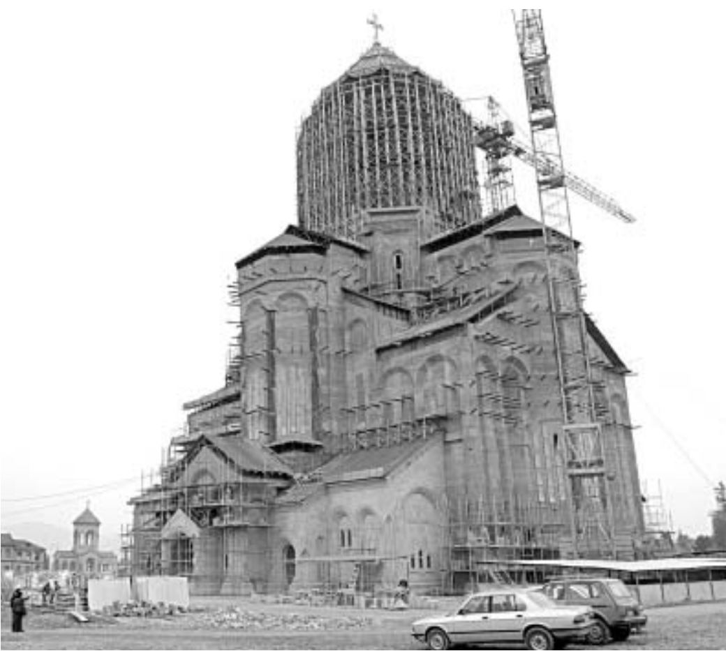
რატომ გადავწყვიტეთ. რომ მარცხდამარცხ ახლა უნდა ავაშენოთ ყველაზე დიდი მონასტერი და ისიც აუცილებლად თბილისის თავზე.

მშენებლობის მანია რომ დიდი ხანია შეგვეყარა, ეს უკვე ყველასათვის ცნობილი ფაქტია. ჯერ იყო და მთელ სახელმწიფოს ლოჯები მივუშენეთ, მერე ესეც არ ვიკმარეთ, ძველ სახლებს დავერიეთ და მთელი თბილისის "ნუცუბიძე" ქცევა გადავწყვიტეთ. მერე მშენებლობამ ისე გაგვიტაცა, რომ საერო ნაგებობებით სამშობლოს დამახინჯება არ ვიკმარეთ და ახლა სასულიეროს მივადექით. და დაიწყო "ფართო მასშტაბიანი" მშენებლობები ყველგან, სადაც შეიძლება და არ შეიძლება. დოლიძის დასაწყისში, ხილანის ბოლოში, ნუცუბიძის I, II, III კვარტლებში, გლდანის გადასახვევსა თუ გადმოსახვევში, მისახვევსა თუ მოსახვევში, მოკლედ, ყველგან დაწყებული თუ დასრულებული ეკლესიები სოკოებივით მომრავლდა. მერე რა არის ამაში ცუდიო, მკითხავენ? - ცუდი არაფერია, თუ მთავარი ხარისხია და არა რაოდენობა. და მერე ვინ თქვა, რომ ეკლესიათა ასეთი სიმრავლე რწმუნის გამსაზრდელელიაო. ყოველ უბანს, ქუჩას და მალე ეზოსაც, რომ საკუთარი ეკლესია ექნება, ვცხონდებით? - არა მგონია. ადრე რამდენიმე სოფელს ერთი საერთო ეკლესია ჰქონდა და ეკლესიასაც ავტომატურად რამდენიმე კარი. თითოეული კარი თითო სოფლისა იყო. ადრე ეკლესიაში წასვლა რიტუალი იყო და ცოტა ძალისხმევასაც მოითხოვდა, ანუ ერთი სოფლიდან მეორეში, ქალაქის ერთი ბოლოდან მეორეში უნდა წახულიყავი. ახლა კი აქვია "ახლოში", გადირბენ და გადმოივლიან.