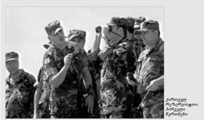
ქაპის რაიონის სოფელ საყარეს ტერიტორიაზე გუშინ რეზერვისტთა წვრილი შემადგენელი ეტაპი ჩატარდა. ფიზიკური მონაცემებისა და ჯანმრთელობის მდგომარეობის მიხედვით შერჩეულ რეზერვისტებს საქართველოს ეროვნული გვარდია ერთი თვის განმავლობაში სავალ პირობებში ყველა შესაძლო ამოცანის შესასრულებლად ამზადებდა. ამ წნის განმავლობაში ჩატარდა საცეცხლე, ფიზიკური და ტექნიკური წვრილი, რაშიც ეროვნული გვარდიის ინსტრუქტორებს ამერიკელთა მიერ მომზადებული ოფიცრებიც ეხმარებოდნენ. ბოლო სამი დღის განმავლობაში კი, რეზერვისტები დასახლებული პუნქტის პირობებში სასულიერო ტექნიკური ჯგუფის შეტევაზე გადასვლას სწავლობდნენ. ღონისძიებას თავდაცვის მინისტრი გიორგი ბარამიძე, შეიარაღებული ძალების გენერალური შტაბის უფროსი ვახტანგ კაპანაძე, ეროვნული გვარდიის სარდალი სოსო ქუთათელაძე და გენერალური შტაბის დეპარტამენტის უფროსები დაესწრნენ. ბარამიძის თქმით, არაპროფესიონალმა სამხედროებმა ოპერაცია ოპერატიულად და მაღალპროფესიულ დონეზე ჩატარეს, რაც ქვეყანას სასიკეთოდ წაადგება.