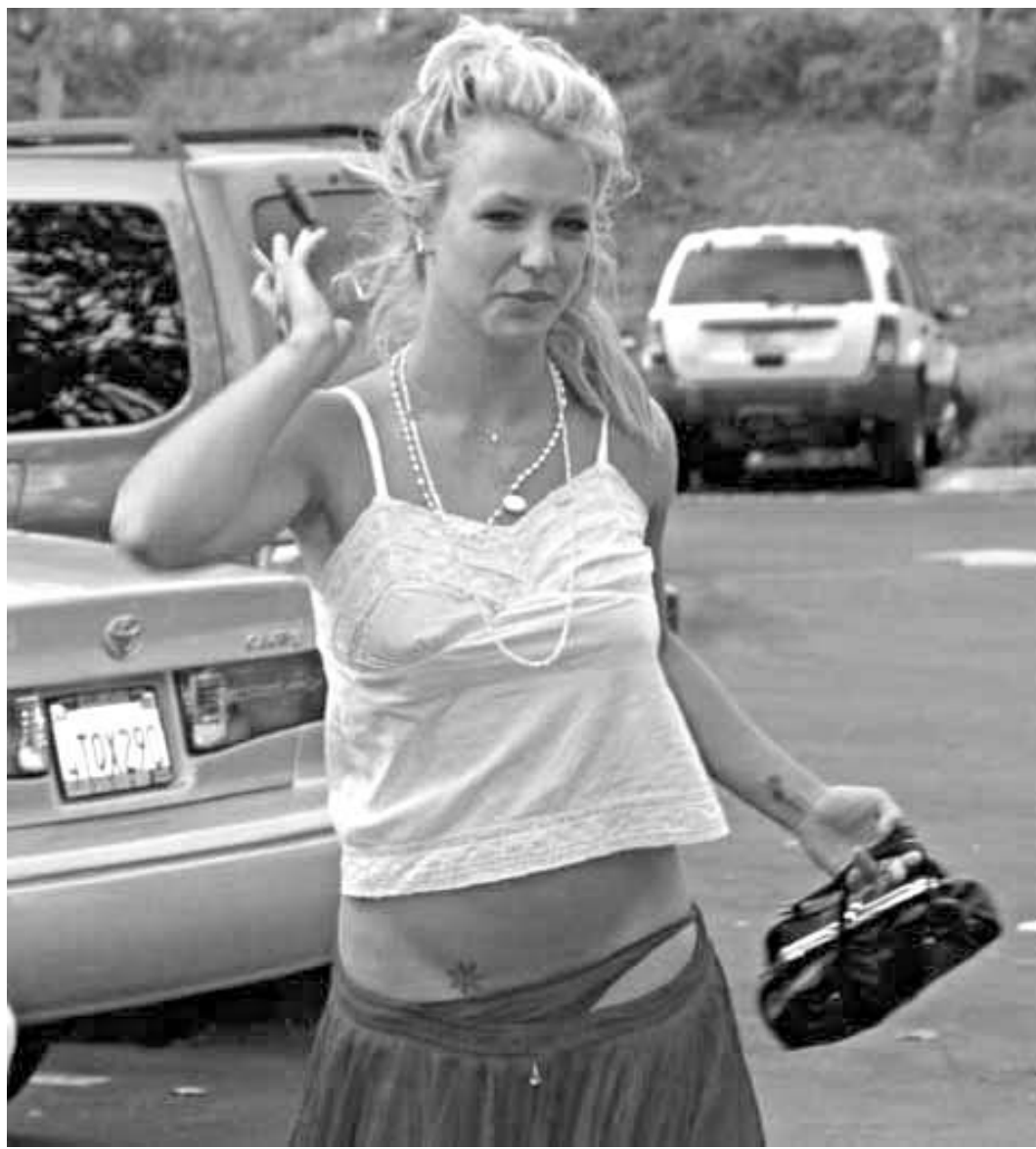
პაპარაციმ ბრიტნი სპირსი მალბურში ავტოსადგომზე გადაიღო. შიპი. ვაშა

“მერლინ მონრო შენზე ლამაზი იყო, მარი კოური – შენზე ჭკვიანი, მარინა ცვეტაევა – შენზე ნიჭიერი, და არცერთს არ უმართლებდა. შენ რა პრეტენზია გაქვს?” ბრძენი პლენარეული ქალის კლასიკური გამონათქვამი “ლამაზი გოგოა, არა?” “კი, ოღონდ პოსტმოდერნის ხანისთვის მეტიმეტად ბუნებრივი”. კინოსეანის დროს ყურმოკრული საუბრიდან.