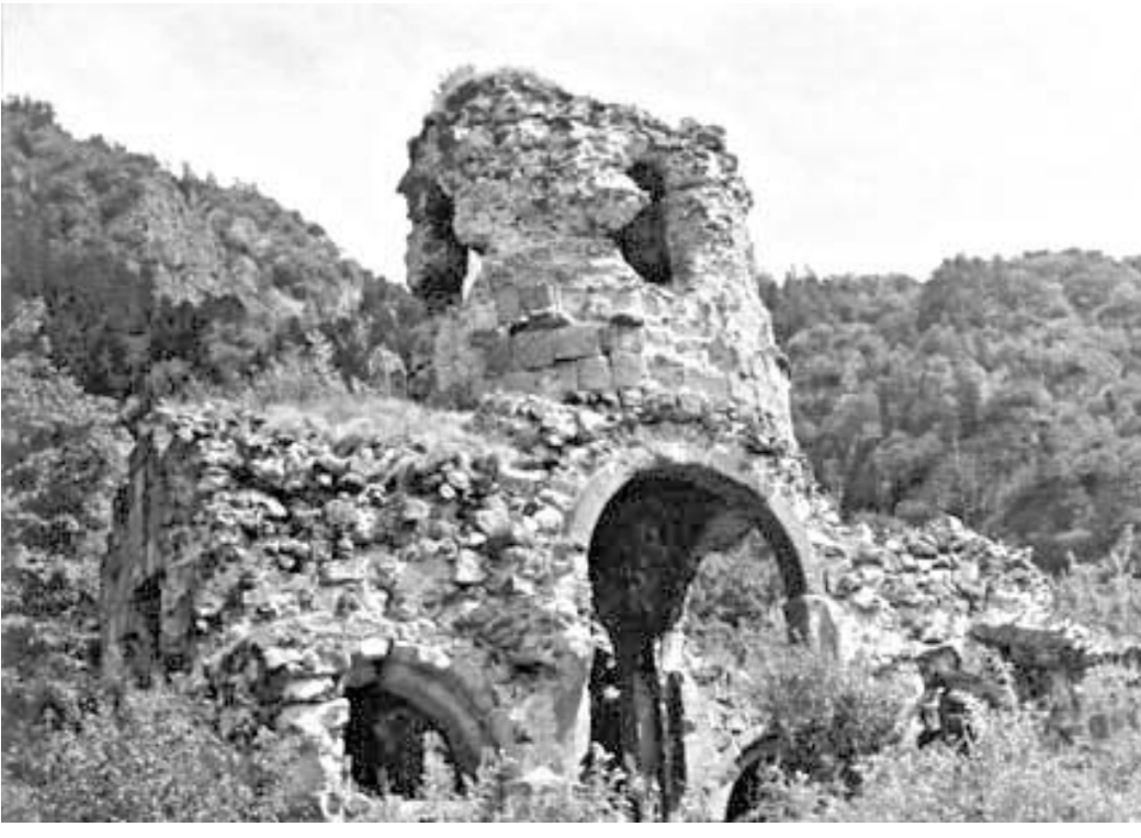
მონასტრები კი ისევ გარდაღებული დგანან და უკვე მერამდენი წელია გვიხმობენ: სადა ხართ, სადა ხართ?

თქვენ, არსაკიდის კოლეგებო, ხომ მხოლოდ ძველის ასლს და იმასაც უსახოს აკეთებთ. მითხარით, მაჩვენეთ რა არის ახალი, რა არის ის, რითაც XXV საუკუნეში XXI ვიამყავთ. რა არის ახალი თქვენს არქიტექტურაში, გარდა დამახინჯებული, ვილაციის კომფორტს შენიშავთ. რა არის ახალი თქვენს არქიტექტურაში, გარდა დამახინჯებული, ვილაციის კომფორტს შენიშავთ. რა არის ახალი თქვენს არქიტექტურაში, გარდა დამახინჯებული, ვილაციის კომფორტს შენიშავთ. რა არის ახალი თქვენს არქიტექტურაში, გარდა დამახინჯებული, ვილაციის კომფორტს შენიშავთ.