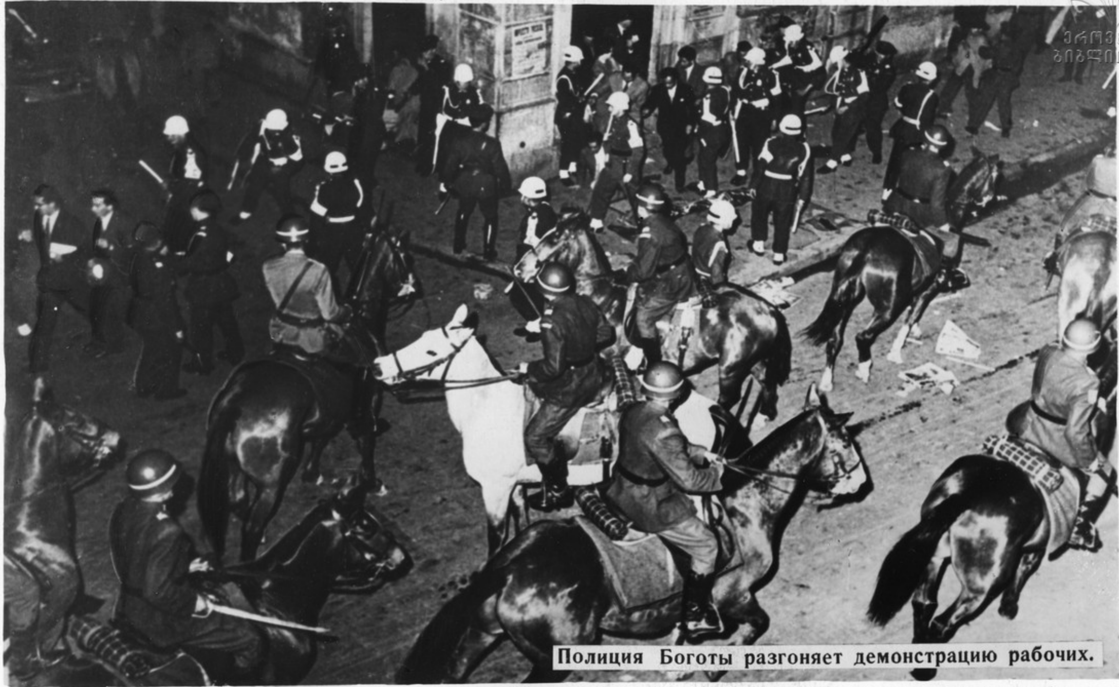
Полиция Боготы разгоняет демонстрацию рабочих.

Рабочие Колумбии ведут борьбу за свои права, за демократические преобразования. На предприятиях нередко устраиваются забастовки, на улицах проводятся демонстрации.