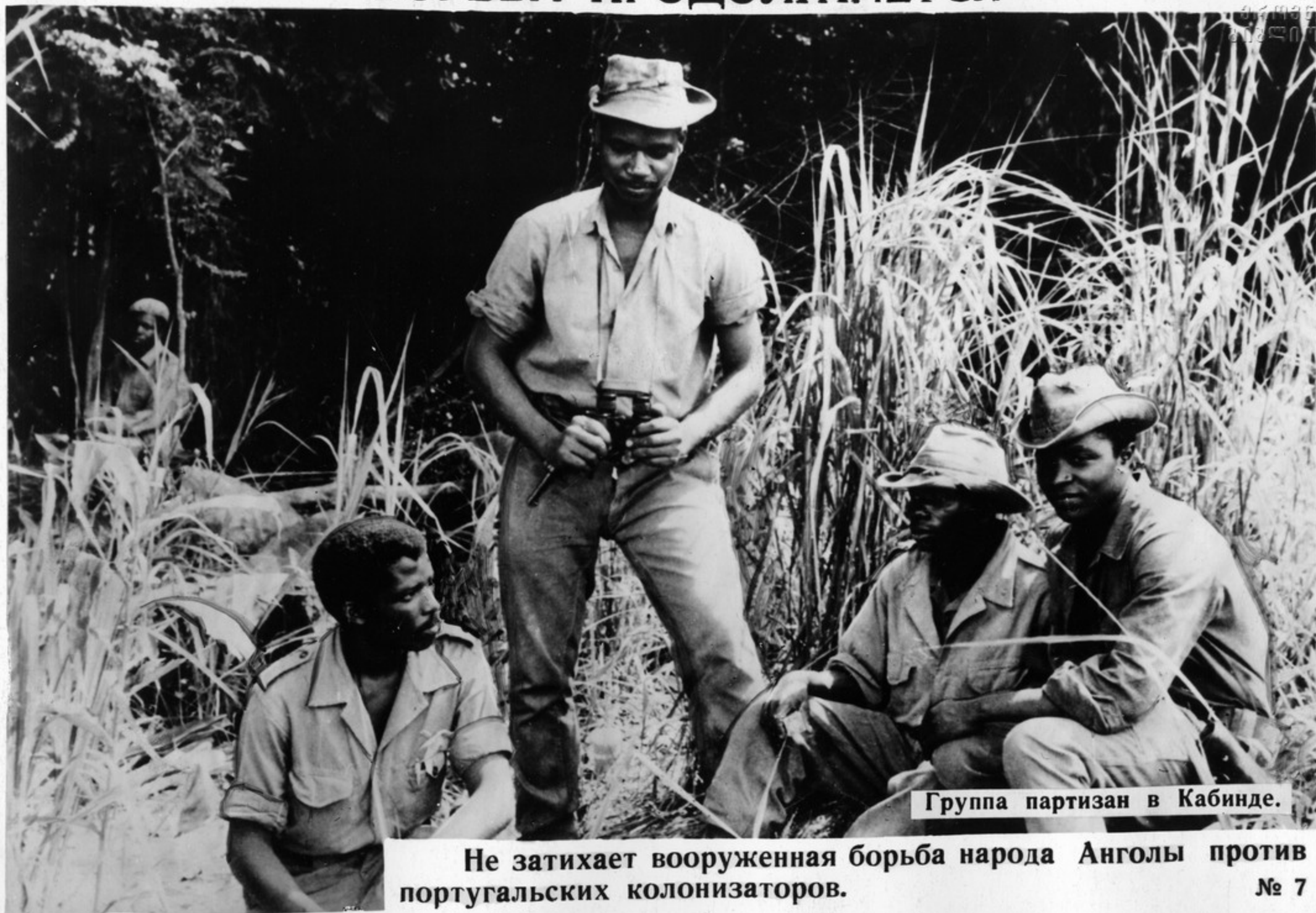
Группа партизан в Кабинде.

Не затихает вооруженная борьба народа Анголы против португальских колонизаторов.