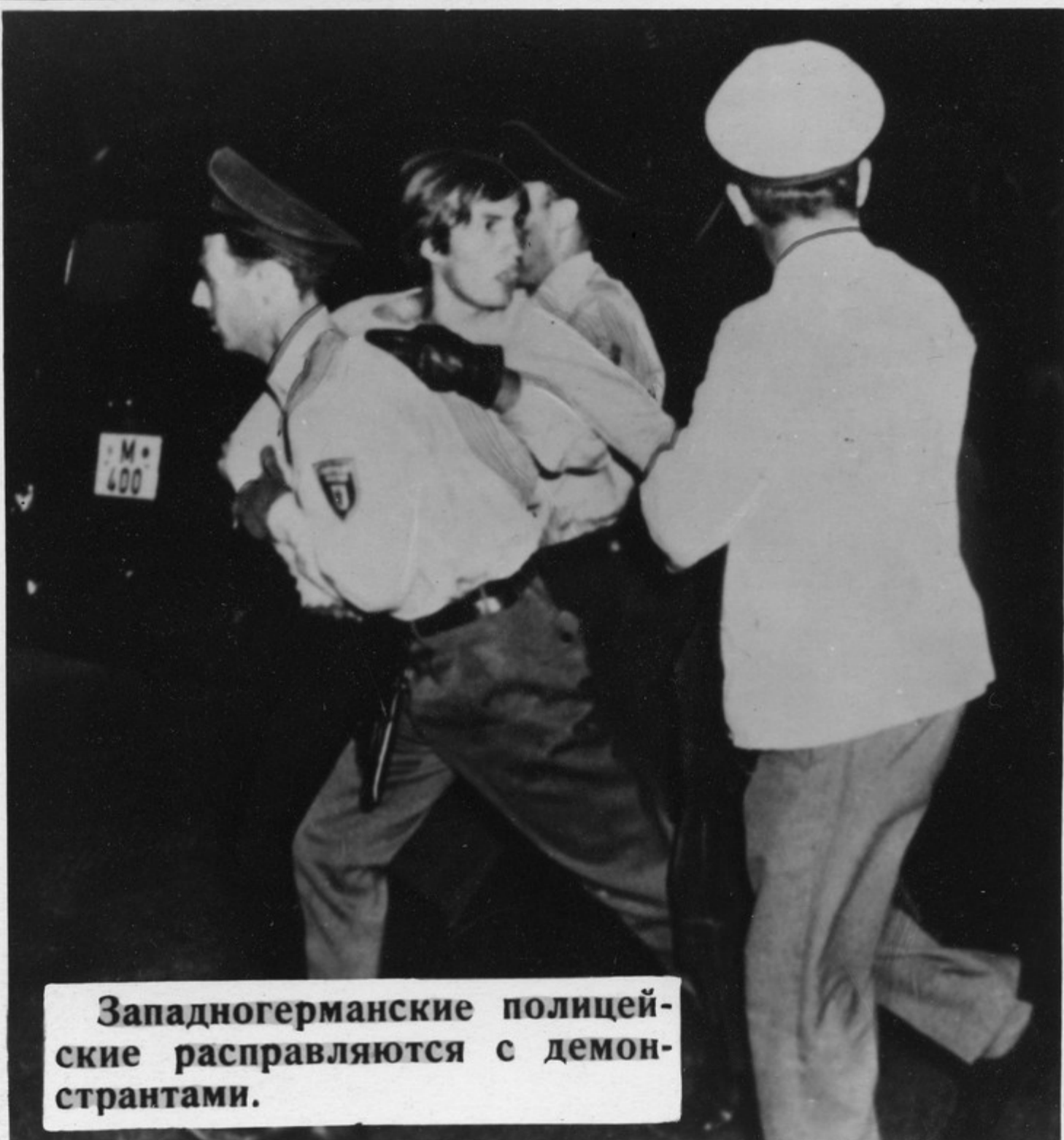
Западногерманские полицейские расправляются с демонстрантами.

В день 4 июля, когда американцы отмечают свой национальный праздник, перед зданием Генерального консульства США в Мюнхене состоялась демонстрация протеста против американской агрессии во Вьетнаме. Демонстранты несли плакат „Вьетнам — это Освенцим США“ и кресты, на которых написаны названия вьетнамских населенных пунктов, подвергшихся бомбардировке.