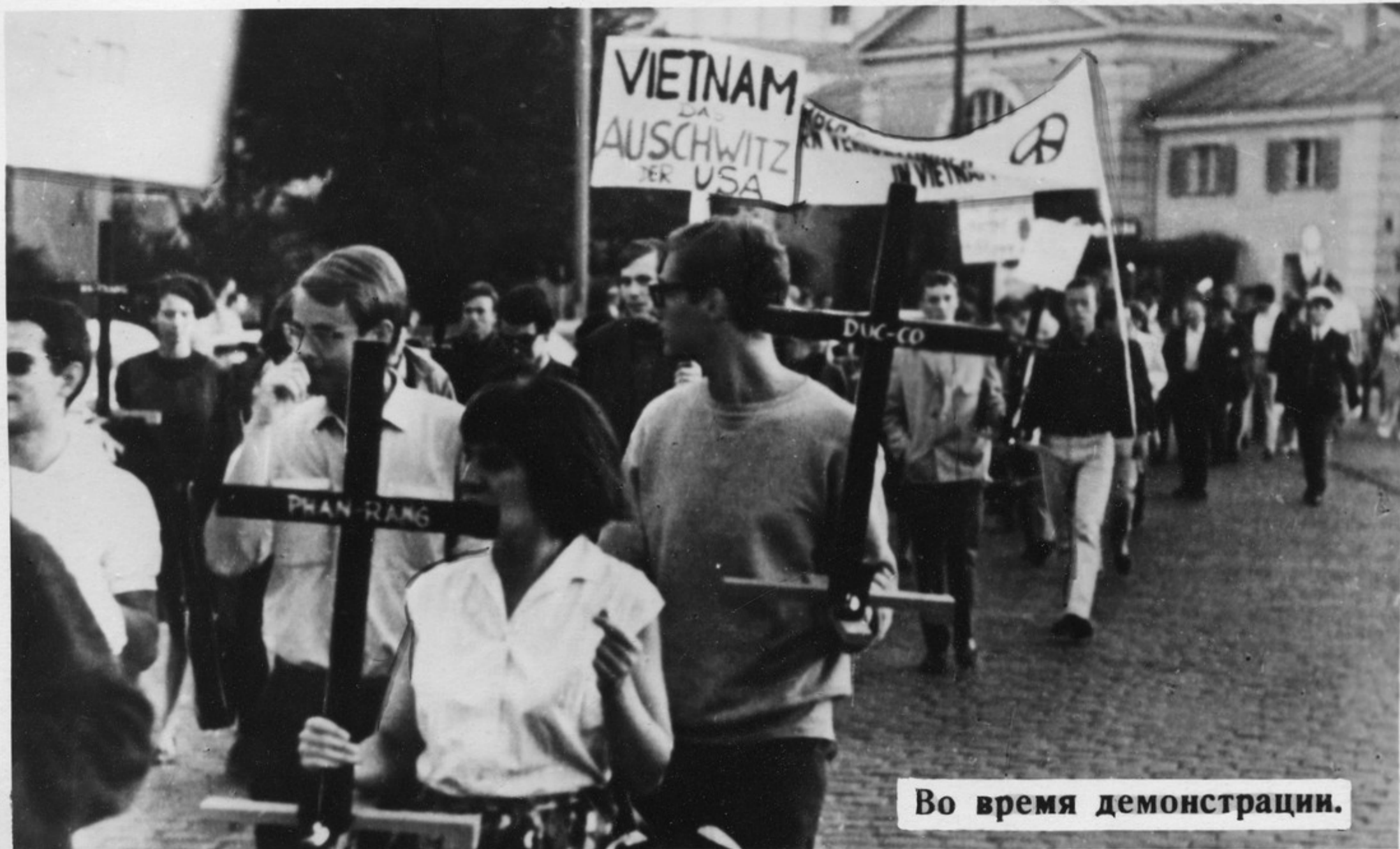
Во время демонстрации.

В день 4 июля, когда американцы отмечают свой национальный праздник, перед зданием Генерального консульства США в Мюнхене состоялась демонстрация протеста против американской агрессии во Вьетнаме. Демонстранты несли плакат „Вьетнам — это Освенцим США“ и кресты, на которых написаны названия вьетнамских населенных пунктов, подвергшихся бомбардировке.