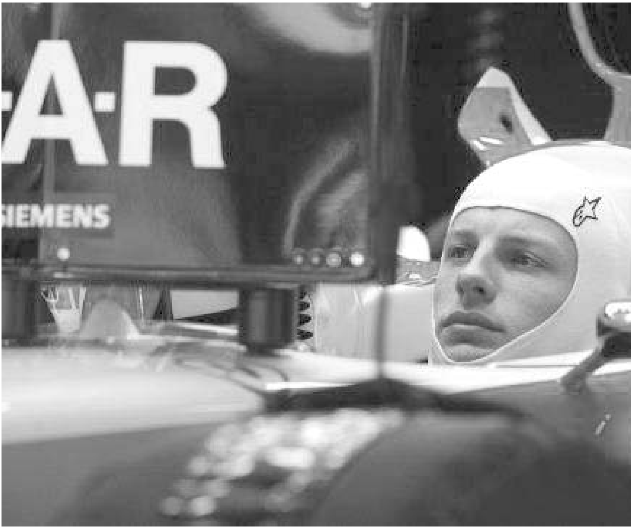
ბატონი 80 პროცენტით ბექვებში ყოფილა.

ვის მოსწონს და ვის აღიზიანებს, მაგრამ ფაქტია: "ბექვებები" სპორტის სხვა სახეობებშიც მომრავლდნენ. ვისთვის მომზიბლავი, სექსუალური, ცვალებადი იმიჯის მქონე, ვისთვის კი ახალ-ახალი სკანდალების მოწაწილე დევიდი, რა ხანია, ყვითელი პრესის განუყოფელ ნაწილად იქცა, მაგრამ... მაგრამ ის, რომ ბექვებები სპორტის სხვა სახეობებშიც არიან, რა თქმა უნდა, ზემოთ ჩამოთვლილი მახასიათებლების გათვალისწინებით. ასე რომ, ნუ გაგიკვირდებათ, თუ ბექვებშია ფორმულა 1-საც მისწვდა.