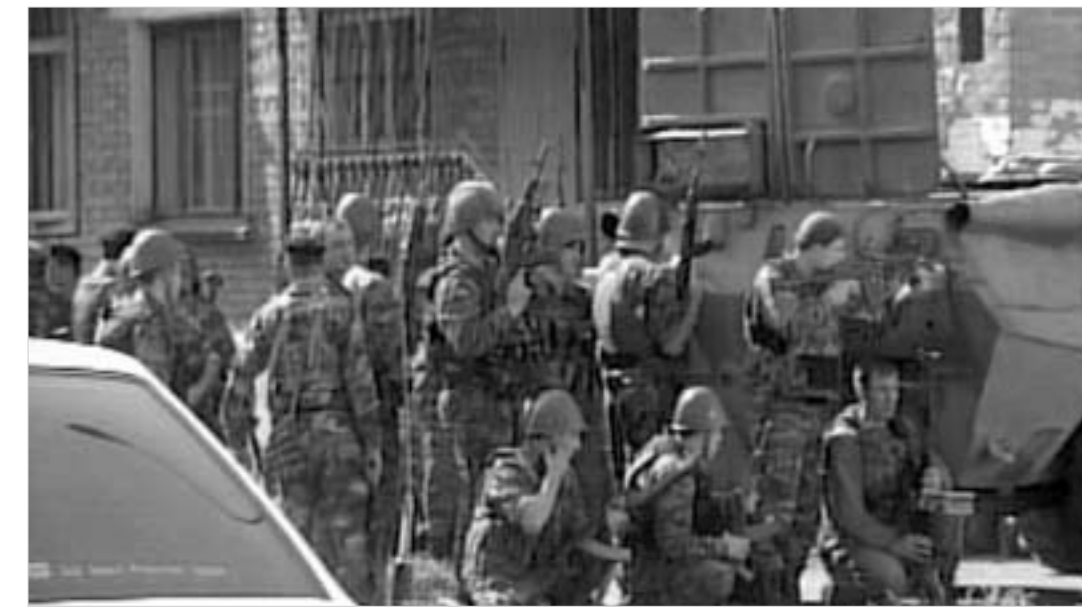
ბარამიძე A5 ბარამიძე

გუშინ დილით, ჩრდილოეთ ოსეთის ქალაქ ბესლანში, დაახლოებით 09.00 საათზე, შეიარაღებულ ადამიანთა ჯგუფმა №1 საშუალო სკოლის შენობა აიღო. ტერორისტების მიერ აყვანილი მიწვეულთა რიცხვის შესახებ მთელი დღის განმავლობაში განსხვავებული ცნობები ვრცელდებოდა. საგარეუდ-ოდ, მათი რიცხვი 400-მდე აღწევს, რომელთაგან 130 - 200 ბავშვია. ჩრდილოეთ ოსეთის შინაგან საქმეთა სამინისტროს ცნობით, თავდასხმელთა რაოდენობა 15-დან 25-მდე მერყეობდა. შავ სამო-სში გამოწყობილი ნიღბიანები ყუმბარმტყორცნებით და ავტო-მატებით იყენებდნენ შეიარაღებულნი. რუსული საინფორმაციო წყარო-ები იტყობინებენ, რომ თავდას-ხმელთა შორის შპიონაჟიც არიან.