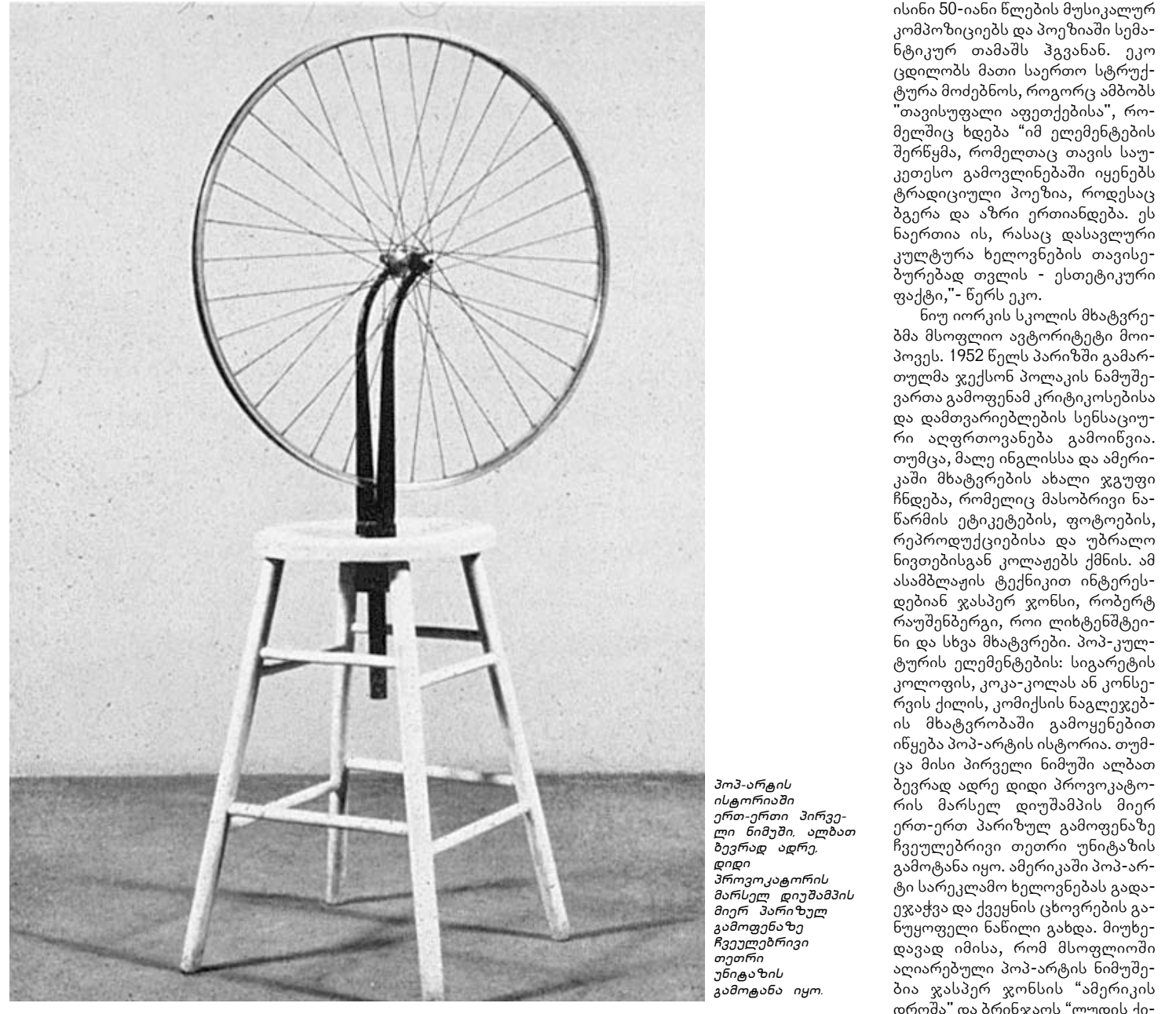
პოპ-არტის ისტორიაში ერთ-ერთი პირველი ნიმუში. ალბათ ბევრად ადრე დიდი პროვოკატორის მარსელ დიუსამის მიერ პარიზულ გამოფენაზე გამოდგნა შემოქმედებითი თეორიის უნიტარის სტრატეგია და იყო.

ნელს, 60-იანი წლების მოვლენებისა და უკვე შეცვლილი საზოგადოებრივი შეხედულებების ფონზე, მან აღიარა, რომ ჰომოსექსუალიზმი აღარ იყო მისი კომპეტენციის სფეროში. თუ ეისაურებით ამ ეპოქის მიერ მოტანილ ცვლილებებზე ადამიანთა აზროვნებაში, ერთ-ერთი ყველაზე მნიშვნელოვანი პუნქტი ჰომოსექსუალიზმის მიმართ დამოკიდებულების შეცვლა იქნება, რაც პირველ რიგში კონტრკულტურამ განაპირობა და არა მხოლოდ ლიტერატურულმა კონტრკულტურამ. ბიონიკების, როკისა და კინოანდერგარუნდის გარდა, ჯერ კიდევ 60-იანი წლებიდან რევოლუციური ცვლილებები მოხდა მხატვრობაში, რამაც მხატვრული აზროვნების სრულიად ახალ ეტაპზე გადასვლა, პოპ-არტის შექმნა გამოიწვია.