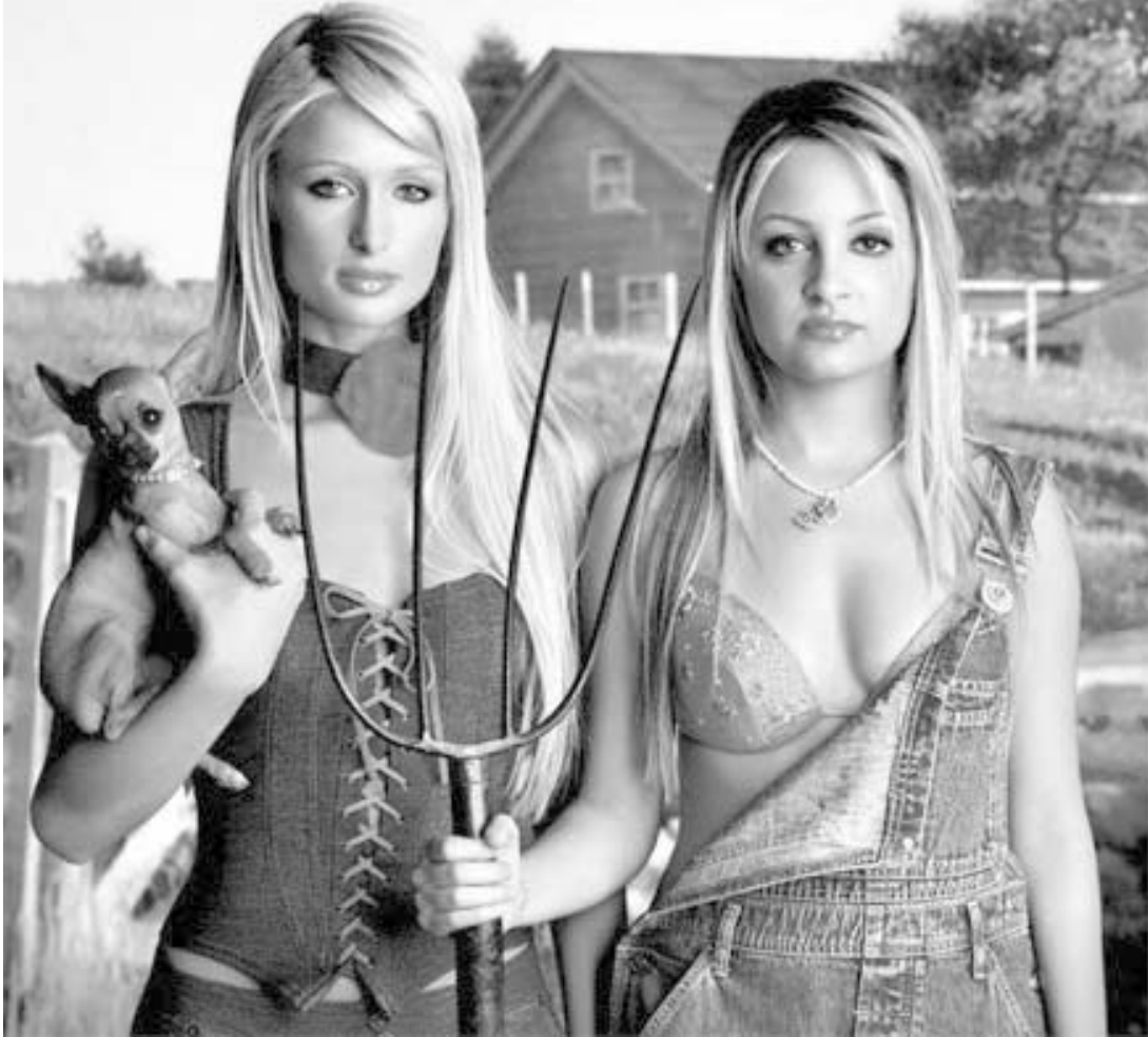
ნელი ორი და პირი პილტონი

საერთოდ, ნარკოტიკების მონხმარების ისტორიები ძალიან მაგარი მოსასმენია, სულ ერთია, ქართველი მამაკაცი ჰყვება თითების ჭაჭყეით, როგორ დაბოლდნენ ის, ეკო, მეკო, შაკო და თეკო, თუ პერის პილტონის დაქალი, 22