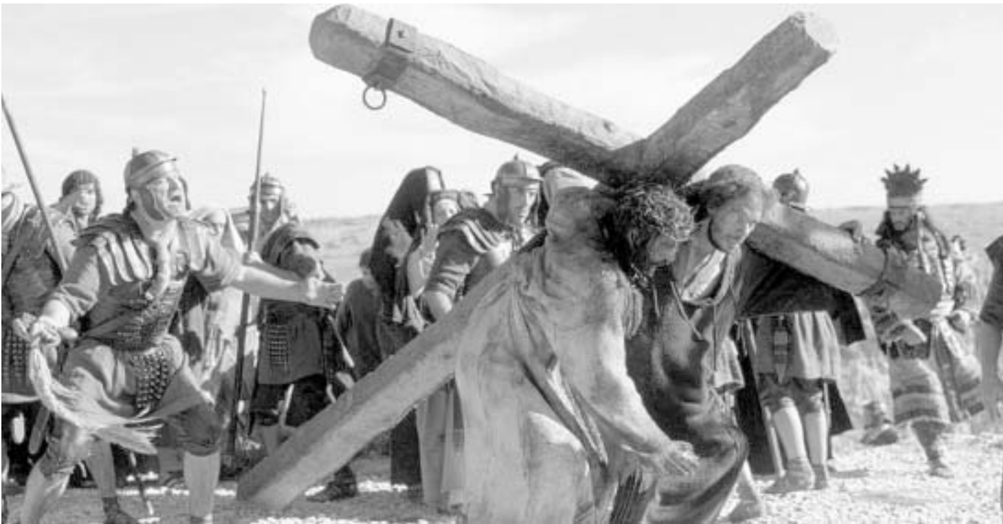
ჯეზუიტო იტალი შრომელი "ასურიალი"

შემგინდა, ვაი თუ კითხვები დასაყარონ, მე კი ვერაფერი ვუპასუხო-მეთქი, ჰოდა, როგორც იქნა, წავედი მელ გიზსონის "ქრისტეს ვნებათა" სანახავად. უცხო ქვეყანაში ვიყავი, სადაც ჭკუა იხმარეს და ბავშვებს აუკრძალეს ფილმის ნახვა. ეკრანზე ბევრს ლაპარაკობენ არამეულად, დიდი დიდი რომაელებს გაუგო, როცა ყვირიან - "ი!" - რაც, როგორც ეტყობა, უნდა ნიშნავდეს: "ნადი, შენი!". ახლაც უნდა ვთქვა, რომ ფილმი, რომელიც ტექნიკურად ძალიან კარგადაა გაკეთებული, არაა არც ანტიკომიუნისტური და არც ქრისტიანული ფუნდამენტალიზმის გამოხატულება. ის არც რაღაც სასატკეო მსხვერპლშენიერვის მისტიკითაა დატვირთული. ეს ეგრეთ წოდებული "სპლატერია",