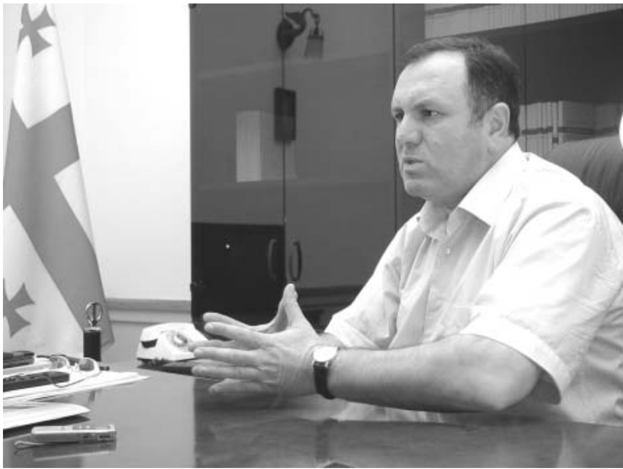
კოტე კეშელარი: იმის თქმა, რომ რუსეთში ყველა ერთნირად ცხადდებიან, ეს არ არის რუსეთის სახელმწიფოს მთავარი პოლიტიკური პოზიცია.

არა მგონია, რუსული საზოგადოების 22 პროცენტი ჩვენი მოკავშირე იყოს... - რა თქმა უნდა, ისინი პირდაპირ ჩვენი მოკავშირეები არ არიან. ისინი რუსეთის ინტერესებს იცავენ, მაგრამ ეს არის დემოკრა-