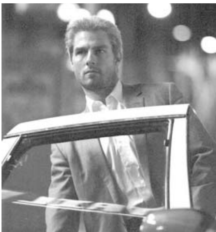
ად, ოსამა ბინ ლადენი იყოს, მაგრამ რა ვქნა, არავის მოკლა არ შემოიძლია". ასე არ ფიქრობს მაიკლ მენი, თრილერის რეჟისორი, რომელიც თავისი ფილმით კიდევ რამდენიმე მილიონის გაკეთებას გეგმავს. მისი ფილმი ვენეციის ფესტივალზე კონკურსს გაერ პროგრამაში აჩვენებს.