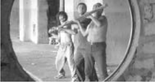
არგონავტები აბრეშუმის ფაბრიკაში