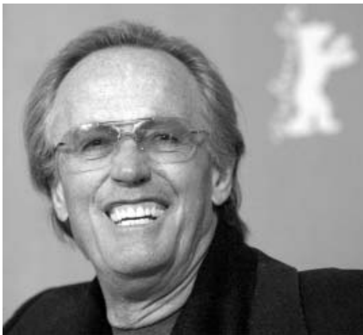
გან იცნობდა. "ის ვესტერნების ნადავლი იყო, მაშინ გავიფიქრე, აი, უდიდესი ოსტატი იყო. ყველაფერი უზადოდ გამოსდიოდა. როცა შევითქვე, რომ კუპერიც მონტანელი იყო, მაშინ რაღაც მოხდა, რატომ არის ასეთი კარგი", - დასძინა დაჯილდოებულ მსახიობს.

საერთაშორისო მაცურებლისთვის პიტერ ფონდა, უბრალოდ საყვარელი მსახიობი და რეჟისორია, თავისი ერთ-ერთი ყველაზე ცნობილი როლით "უდარდელ მხედრებში". ამერიკაში, მონტანას შტატში კი მას კიდევ ერთი მიზეზის გამო სცემენ პატივს - ფონდა მათი მშობლიური შტატიდან არის. ამ დამსახურებების გამო მსახიობს მონტანელის გარი კუპერის სახელობის პრიზს გადასცემენ, ოდნავ ვრცელი სათაურით - გარი კუპერი, მონტანას სულისკვეთების ჯილდო. საზეიმო ცერემონიალი აუდივიზუალური ხელოვნების ფესტივალის ფარგლებში 9-12 სექტემბერს გაიმართება. ჯილდოს ხანდაზმულ მსახიობს ჯეფ ბრიჯესი გადასცემს - კიდევ ერთი მონტანელი.