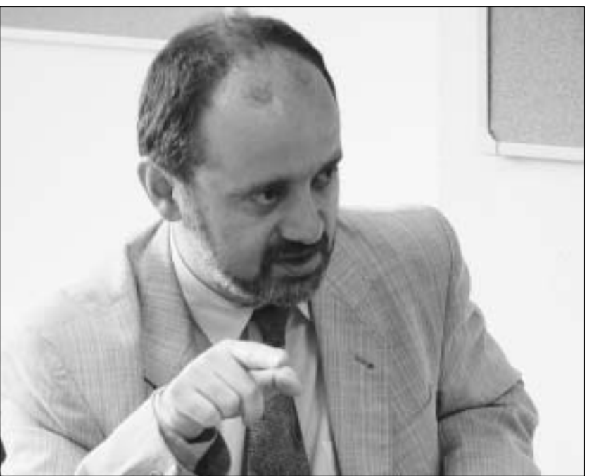
ომბუდსმენს შეგიძლიათ დაუკავშირდეთ შაბათობით. ტელ: 20 24 24 ან ნებისმიერ დროს ელ-ფოსტით: niadaria@24hours.ge

შე არსებულთა შორის. მეცინერთა არაერ-თი რეალური თაობის გამზრდელი მამა თა-ვის ვაჟს ასეთ ტერმინოლოგიურ უზუსტო-ბას არ აბატიებენ...