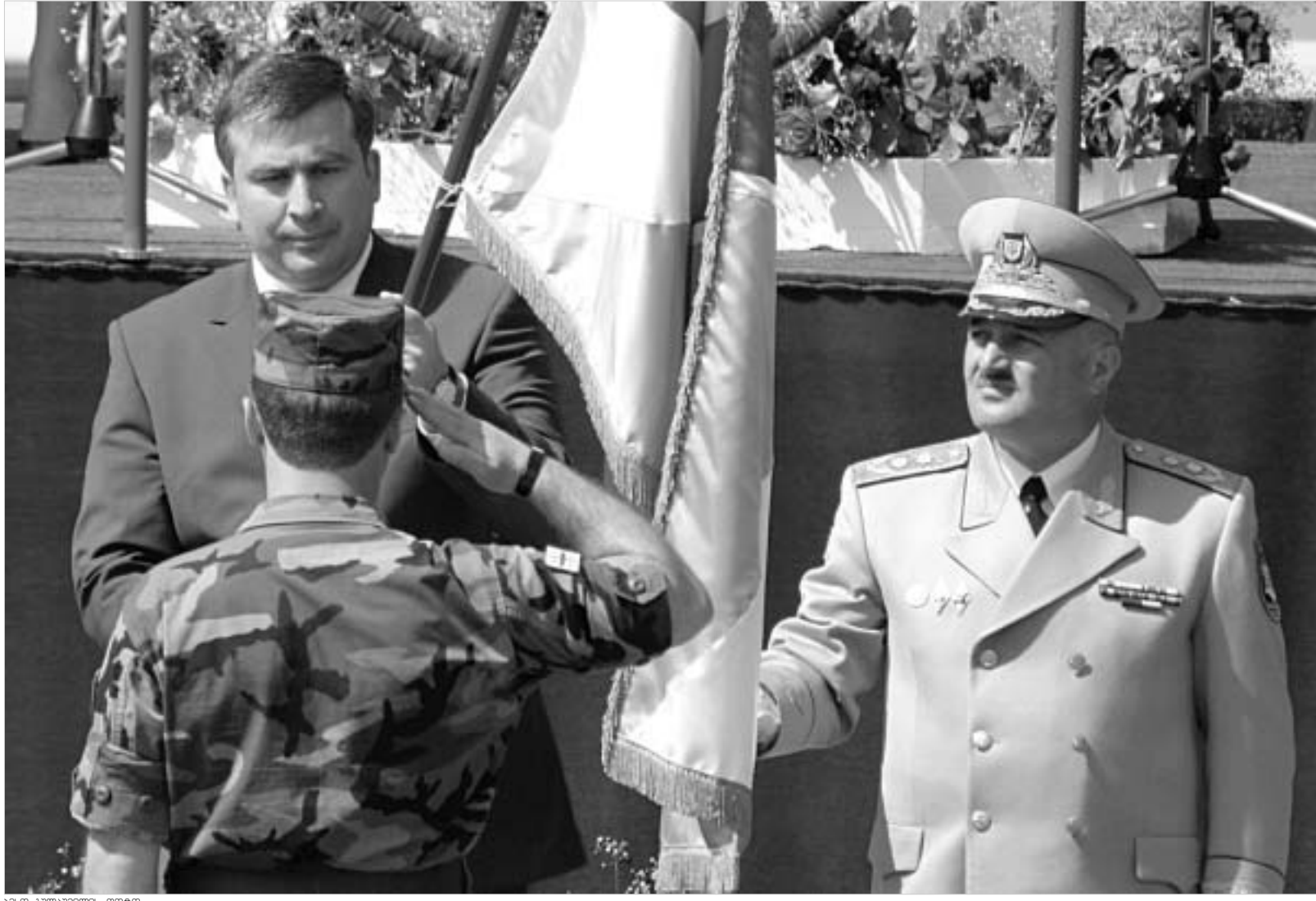
საქართველოს პრეზიდენტი მიხეილ სააკაშვილი (მარჯვნივ) და გივი იუკერიძე (მარცხენა).

გივი იუკერიძე: "არ ვიცი, იყავით თუ არა 28 მაისს აღლუშზე და ნახეთ თუ არა უბრალო ხალხის თვალზე სინარული ცრემლი... მე ვნახე და ეს ჩემთვის საკმარისია..."