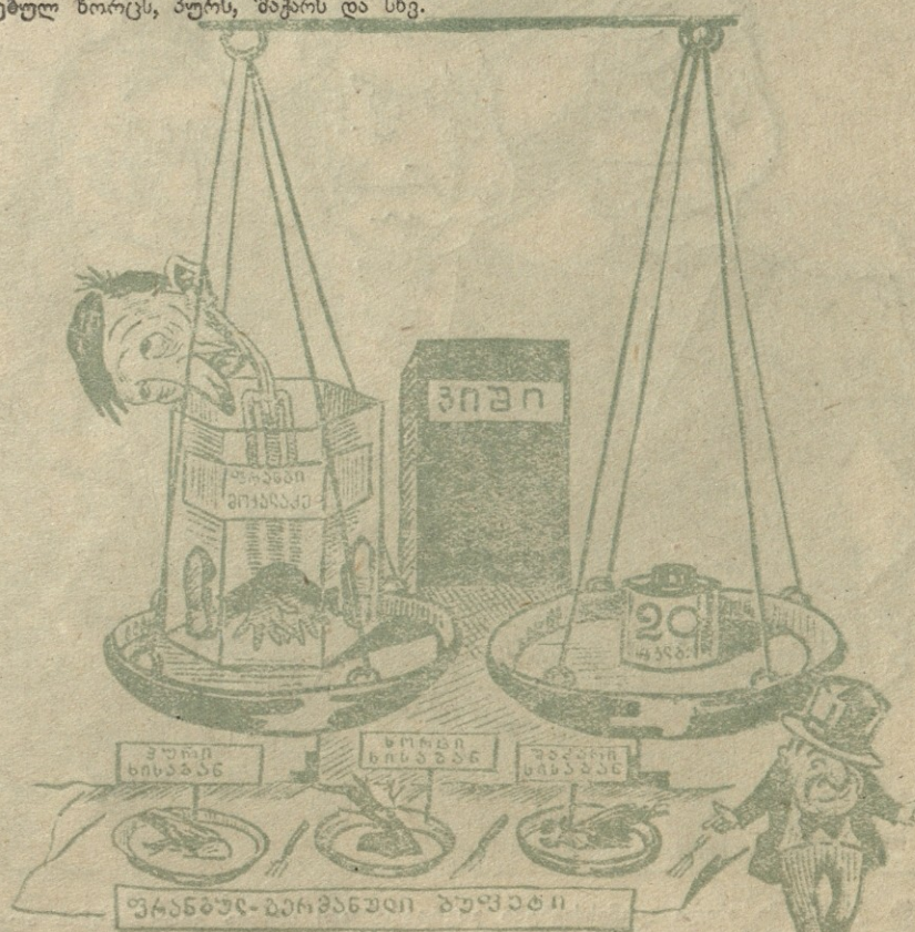
ლაგალი: ვერაფერი მოვუხერხე ამ მოქალაქეს, ახალი საჭმელების მრავალფეროვანი ბუფები შევუქმენი და მაინც ფარგასავით ჩამოხმა.

რომ ამით რაც გინდ არ მოხდეს ჩვენ ავიშორეთ ხიფათი, თითქოს ჩვენ ამითიც ვართ და ნაწილობრივ იმართ.