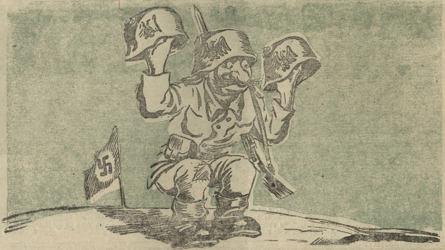
ჩან. 2. ვაგნერის