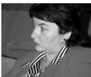
საქართველოს მოსწავლეებისა და სტუდენტებისთვის 2004-2005 სასწავლო წელი 20 სექტემბერს დაიწყო.

საბაჟი "თხილგაზის" ტარიფის გადანიჭვას ბაზმას