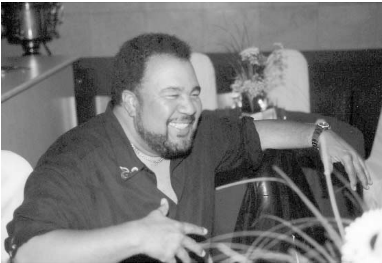
ჯორჯ დიუკი - ჯაზის კიდევ ერთი ვარსკვლავი თბილისში ჩამოდის.

ხშირად, ადამიანები საკუთარ წარმატებებს ერთ რამეშივე მშობიანობას, კონკრეტულ მოვლენებს უკავშირებენ. როგორც მუსიკოსის