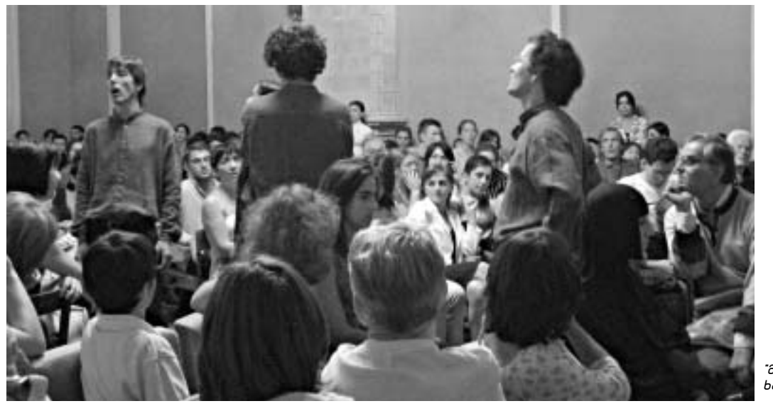
შუე შინა ხალხში გავიდა.