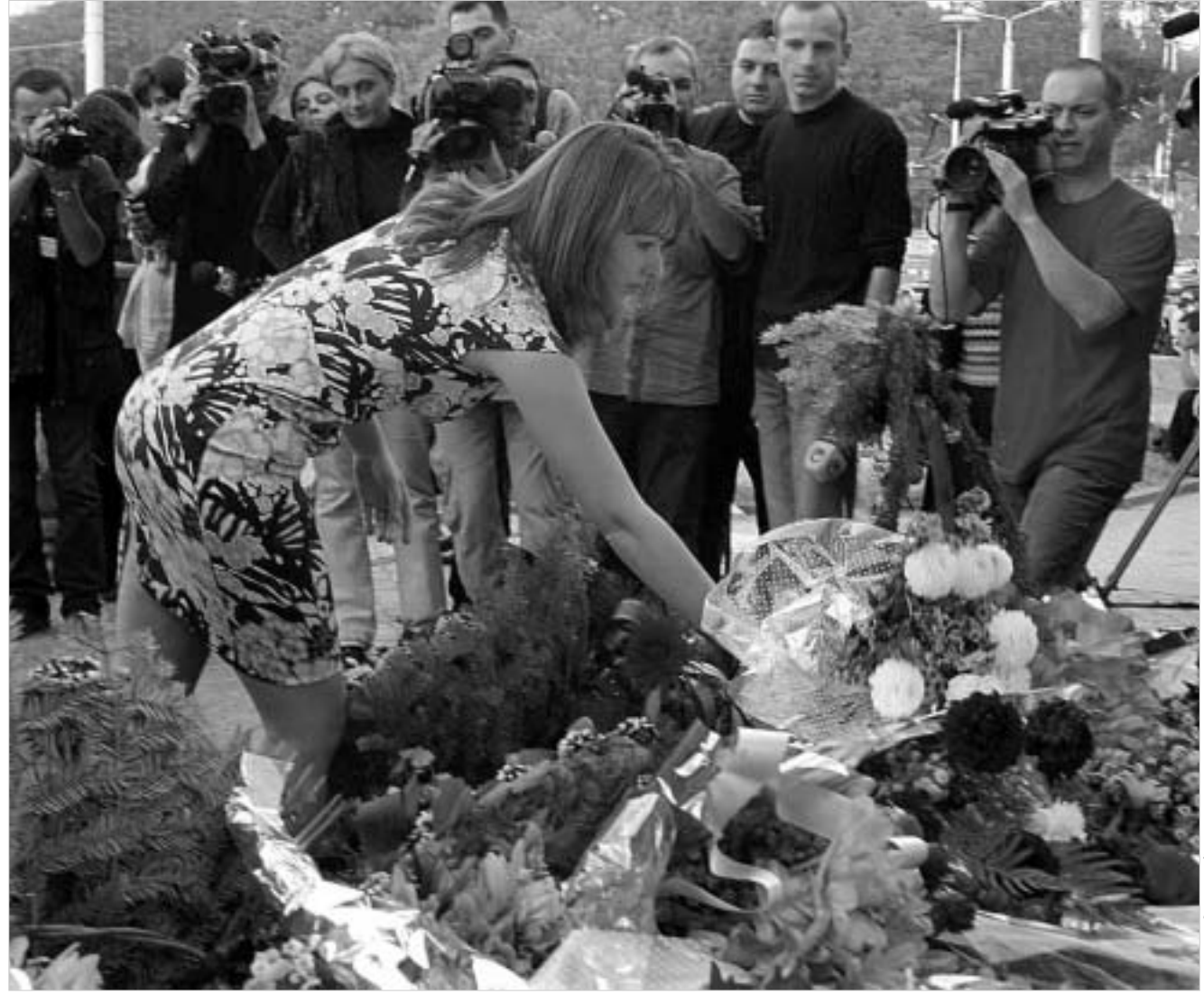
მას შემდეგ, რაც მემორიალთან სიტუაცია დაიძაბა, აქ საქართველოს პირველი ლედი გამოჩნდა და მემორიალი თაიგულით შეამკო.