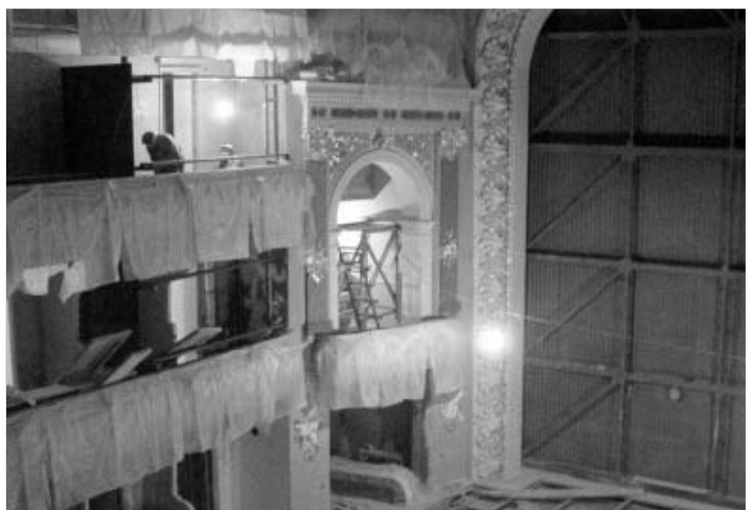
ლვინსონი შეცნატი რომ არ გამოჩენილიყო, საეჭვოა, რუსთაველის თეატრს ახლო მომავალში გაეხსნა სეზონი ან მარჯანიშვილის თეატრი შეეკეთებინა სახელმწიფოს.