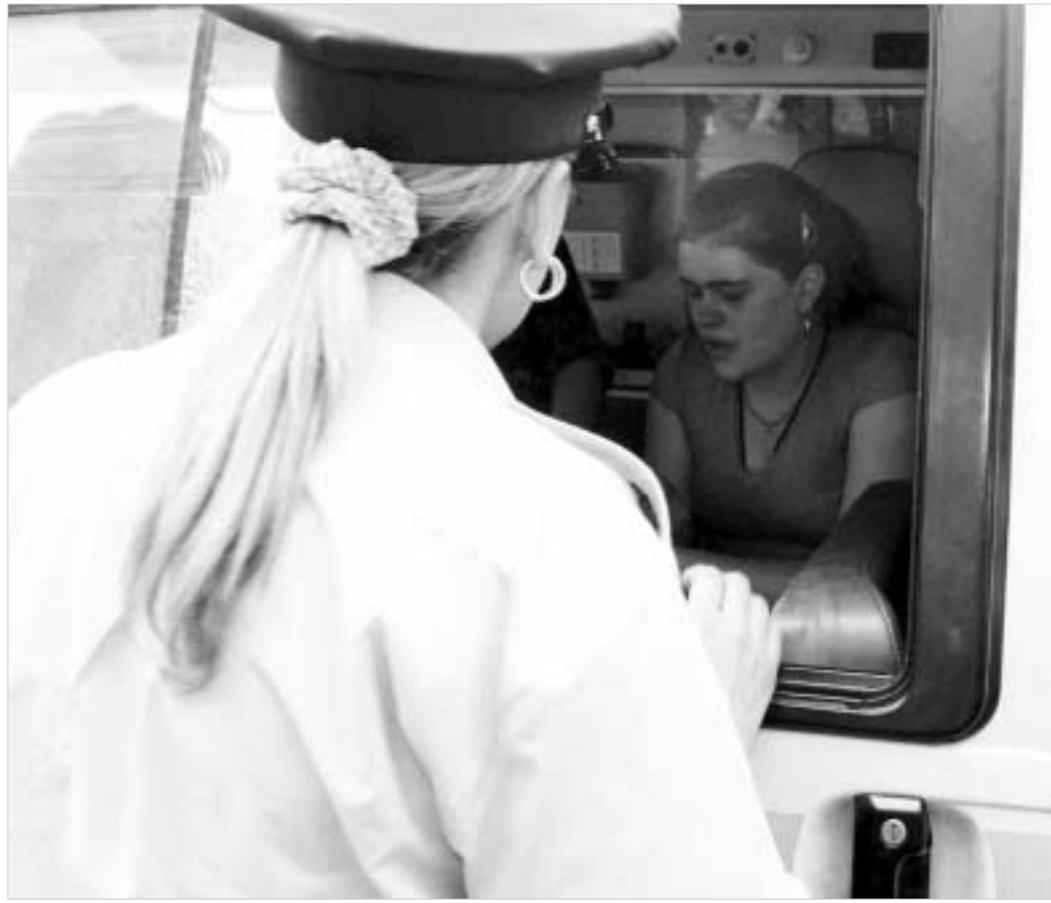
მონაშლული ბავშვები საავადმყოფოში საპატრულო პოლიციამაც გადაიყვანა.

საბოლოო მონაცემებით, სკოლაში სულ 12 მოსწავლე მიიწამ-