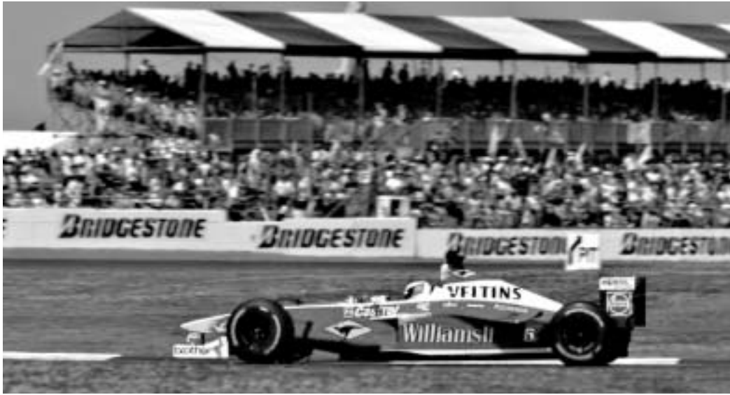
სტიუარტის ტრასაზე "სამფორმულა-1" ალარ გაიმართება.

"ჩვენ თხოვნით მივმართეთ ბატონ ეკლსტონს და ქვეყნის მთავრობას, რათა კიდევ ერთხელ დაფიქრებინათ, თუ რა შედეგი შეიძლება მოჰყვება რბოლის გაუქმებას. ჩვენ უკვე შევამოწმეთ ხარჯები სხვა სფეროებში, რათა რბოლისთვის მოგვეზიდა დამა-