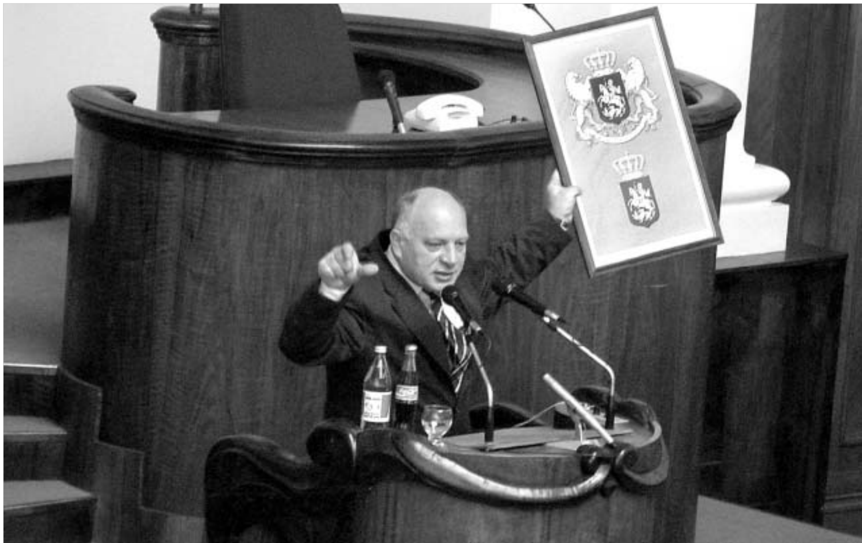
ნოდარ გრიგალაშვილიმა პარლამენტს გერბის სახელმწიფო ვარიანტი წარუდგინა და ხაზი გაუსვა, რომ მას იწინებს პრეზიდენტს.