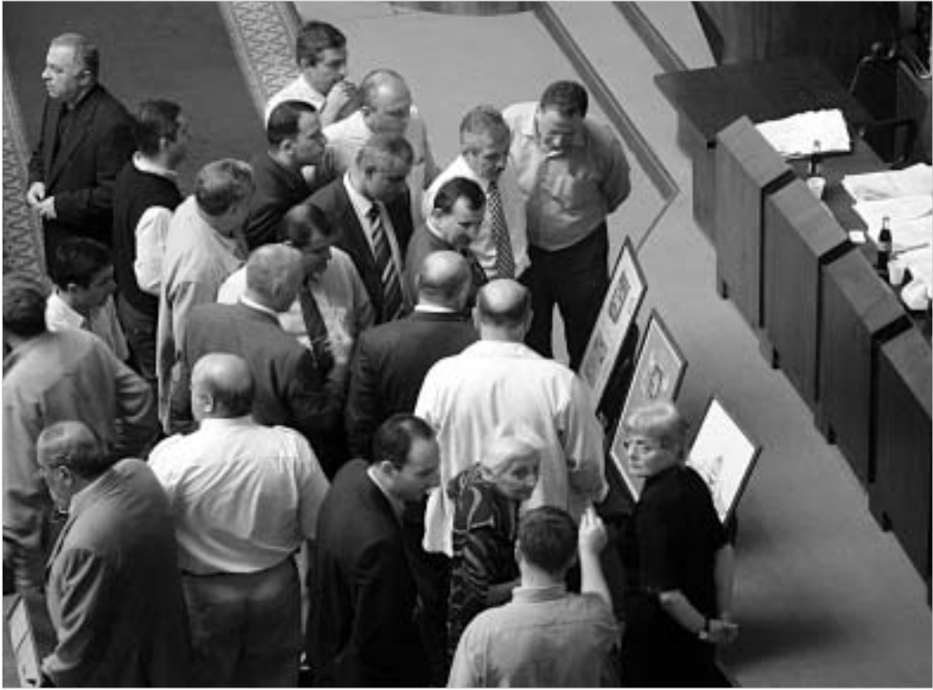
პარლამენტარები ქუროდლებით გაქმნენ სახელმწიფო ბერბის საბოლოო ვარიანტს.