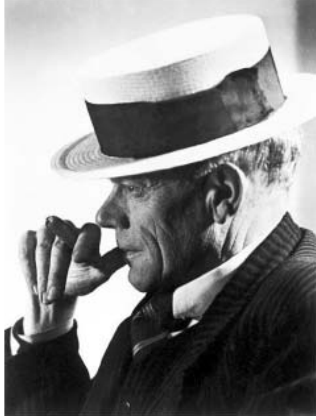
დღეს თბილისში კარლ ვალენტინის ფილმების რეტროსპექტივა იწყება.

პარა ნაფარიძე თბილისის მე-5 საერთაშორისო კინოფესტივალში "პრომეთე", რომელიც კინოთეატრ "რუსთაველში" დღეს გაიხსნება, თბილისის გოეთეს ინსტიტუტის მონაწილეობს. დღესვე გოეთეს ინსტიტუტში კინოს გერმანული პიონერის კარლ ვალენტინის ფილმების რეტროსპექტივა ცოცხალი მუსიკის თანხლებით გაიხსნება.