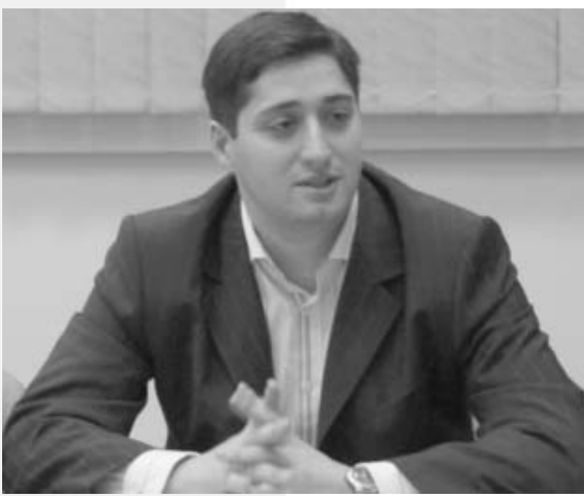
საქართველოს იუსტიციის მინისტრი გიორგი პაპუაშვილი შეხვდა პროექტში მონაწილე მოსწავლეებს და მათ ესაუბრა. მოსწავლეებმა მინისტრის მათთვის საინტერესო შეკითხვები დაუსვეს.

აზინანსებს ფონდში "ღია საზოგადოება საქართველო". პროექტს ახორციელებს გაცემით "24 საათი"