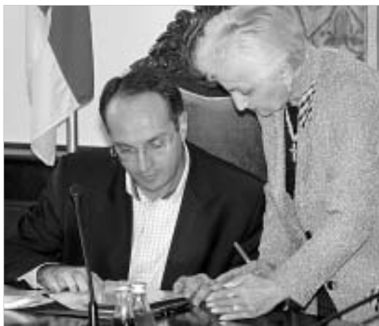
მთავრობამ პარლამენტში 2005 წლის სახელმწიფო ბიუჯეტის პროექტი და მასთან დაკავშირებული 39 კანონპროექტი წარადგინა.