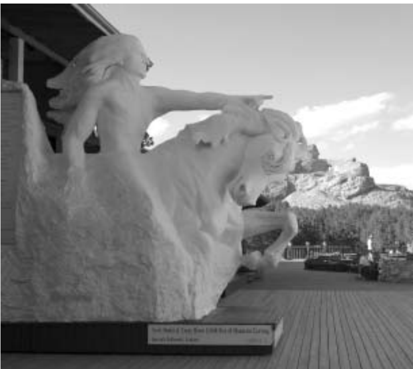
კრეიზი ჰორისის მკეტი ქანდაკების ფონზე

იმ საბედისწერო წელს სახელგანთქმულმა ინდიელმა ბელადმა ჰენრი სტენდინგ ბეარმა, ანუ ფეხზე (უკანა თათებზე) მდგომი დათვმა, გადაწყვიტა უკვდავყო ლეგენდარული ინდიელი მებრძოლის, ბელად ქრეიზი ჰორისის (გადარეული ცხენი) სახელი. სიუს ტომის ბელადმა, ქრეიზი ჰორისმა ლიტლ ბიგჰორნთან ბრძოლაში დაამარცხა და მოკლა გენერალი ჯორჯ არმსტრონგი. ქრეიზი ჰორისის შესახებ ამბობდნენ, ტყეისგან შელოცვილია, მაგრამ ასეთი რამ არ არსებობს და 1877 წელს გადარეული ცხენი ნებრასკას ციხესთან ჩვეულებრივმა ჯარისკაცმა მოკლა. ჰენრი სტენდინგ ბეარმა ციოლკოვსკის ქრეიზი ჰორისის სკულპტურის გაკეთება შესთავაზა. წერილში ბელადი მოქანდაკეს სწერდა: "მე და სხვა ინდიელ ბელადებს გვსურს, თერთკანიაზე იცოდნენ, რომ ნითელკანიაზე შორისაც არიან გიმრები". ბელადს სურდა შექმნილიყო რაიმე გრანდიოზული, რომელიც მანუთ-რამპორზე გამოკვეთილ პრეზიდენტების სკულპტურებსაც კი დაჩრდილავდა. ციოლკოვსკისაც, ისედაც შეშლილს გიგანტომანიაზე, სწორედ ეს უნდოდა. მან იდეა აიტაცა და მთელი ცხოვრება ამ პროექტის განხორციელებას მიუძღვნა.