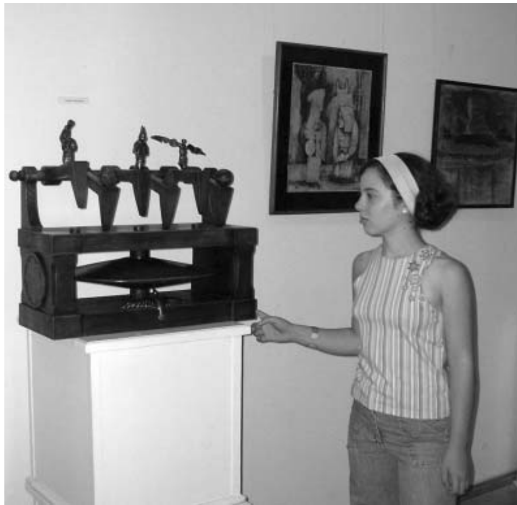
გალერეა "უნივერსში" თავიანთი ნამუშევრები საქართველოს ტექნიკური უნივერსიტეტის არქიტექტურის ინსტიტუტის სახელით ხელოვნების კათედრის პედაგოგებმა გამოფინეს.

ეს საინტერესო გამოფენა ამ მხრივაც - მომავალ თაობებზე ზრუნვისა და მათ წინაშე პასუხისმგებლობის გაცხადების კუთხითაც ნიშანდობლივი მეჩვენება: თბილისელების, ქართული ხელოვნების მოყვარულების და, რაც ყველაზე მნიშვნელოვანია, ამ შემთხვევაში - საკუთარი სტუდენტების წინაშე "უნივერსში" ამჯერად პედაგოგები წარდგნენ.