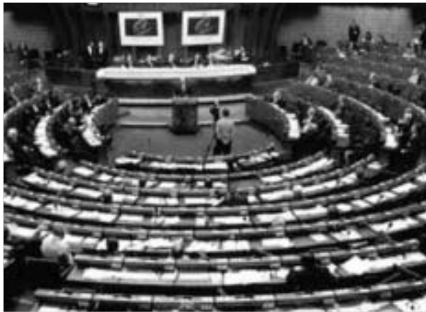
ევროსაბჭოს საპარლამენტო ასამბლეის სხდომაზე პირველი ქართული დეპუტატი გაიმართება.

რუსეთი სერიოზული ინიციატივებით წარდგა ევროპულ კანონმდებელთა თავიერთობის წინაშე. პირველ რიგში, ეს არის ტერორიზმთან ბრძოლის შესახებ საერთო ევროპული კონვენციის მიღების საკითხი. „დღემდე ამ ორგანიზაციის ეგვიპტის ტერორიზმთან ბრძოლის შესახებ 27 რეზოლუცია, სპეციალური კონვენცია და მისი ოქმია მიღებული, თუმცა, მათ ვერ უზრუნველყვეს ამ ბოროტების წინააღმდეგ ეფექტური და ნარმატიული საერთაშორისო თანამშრომლობა,“ - აცხადებს ამ თემაზე მთავარი მომხსენებელი, რუსეთის სახელმწიფო სათათბიროს საერთაშორისო საქმეთა კომიტეტის თავმჯდომარე კონსტანტინ კოსაჩენკო. მისივე განცხადებით, რუსეთის დელეგაცია შეეცდება, რომ ტერორიზმთან ბრძოლის პრობლემები ევროსაბჭოს ქვეყნების მეთაურთა მომავალი წლის მაისში დაგეგმილი ვარშავის სამიტის ერთ-ერთი მთავარი თემა გახდეს.