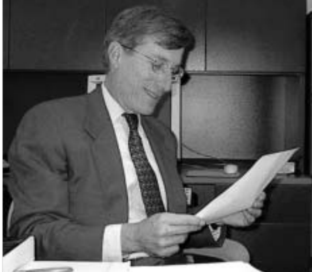
სტივენ სესტანოვიჩის აზრით, არჩევნების შემდეგ რუსეთ-ამერიკის ურთიერთობები აუცილებლად შეიცვლება.

გასულ კვირას პუტინის პოლიტიკის წინააღმდეგ გამოქვეყნებული ღია წერილის ერთ-ერთი ავტორი, კოლუმბიის უნივერსიტეტის პროფესორი, წყარულში კი აშშ-ს სახელმწიფო მდივნის სპეციალური მრჩეველი და საგანგებო დაავალებათა ელჩი დსთ-ს საკითხებში, სტივენ სესტანოვიჩი მიიჩნევს, რომ საპრეზიდენტო არჩევნებში დემოკრატიის გამარჯვების შემთხვევაში, რუსეთ-ამერიკის ურთიერთობები აუცილებლად შეიცვლება და განსხვავებული ხასიათს შეიძენს.