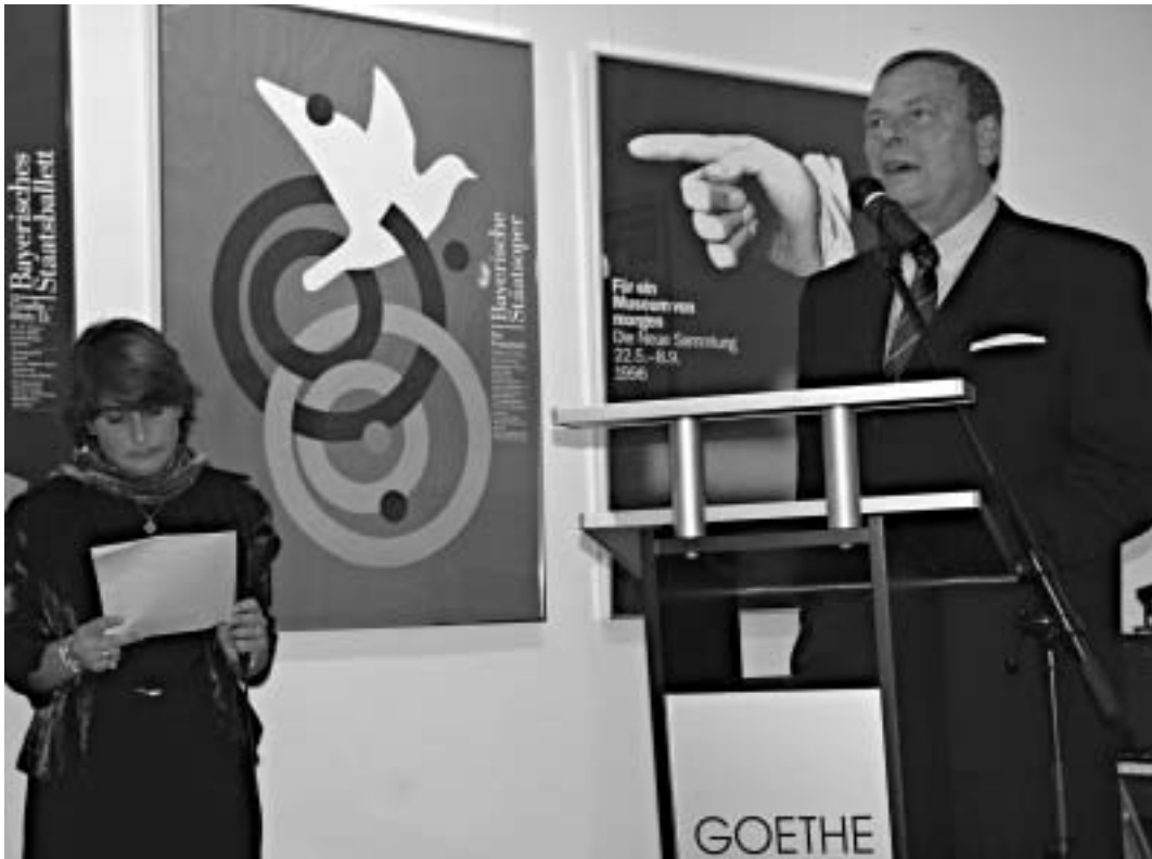
გერმანიის ელჩი უკვე მრამბი.

თუმცა, გოეთეს ინსტიტუტის მიერ მოწოდებული საიუბილეო საღამო, არა მარტო გერმანული ენის მცოდნეთათვის იყო გათვლილი, არამედ თანამედროვე ხელოვნების, კინოს, მუსიკის მოყვარულთათვისაც.