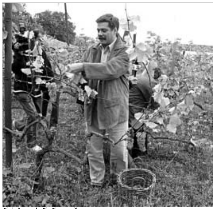
რუსები კახურ რთველში.