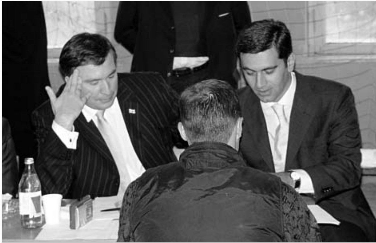
პრეზიდენტი და შსს მინისტრი მკაცრი გამომცდელები აღმოჩნდნენ.