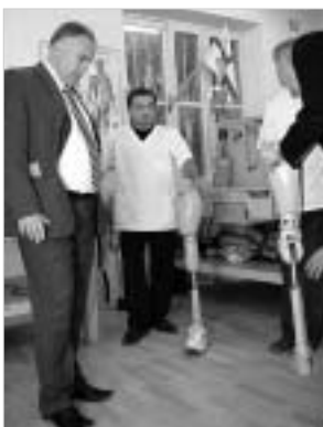
"ჩვენ ვერძალავე ნაღებები!" - ეს არის ცივილიზებული მსოფლიოს ხმა. მაგრამ, სწორედ ამ ცივილიზებულ ქვეყნებში ამაღლებენ იმ ნაღებებს, რომლებზეც ესოდენ ფეთქდებიან სრულიად უდანაშაულო ადამიანები.