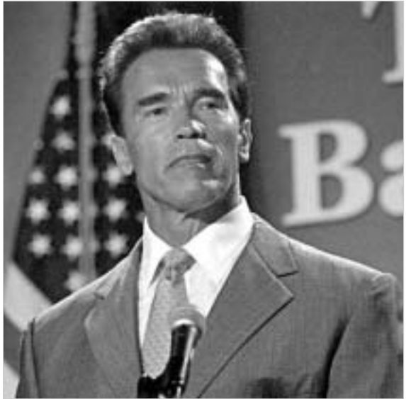
კონსტიტუციით შესწორების შემთხვევაში შვარცნეგერს პრეზიდენტად გახდომის შანსი ექვია.

არნოლდ შვარცნეგერის სახელი რამდენჯერმე გაისმა, როდესაც აშშ-ს სენატში იხილავდნენ კონსტიტუციის ერთ-ერთ მუხლში წარმოდგენილ მითხვენას, რომლის თანახმადაც ამერიკის პრეზიდენტობის კანდიდატი აუცილებლად ამერიკაში უნდა იყოს დაბადებული.