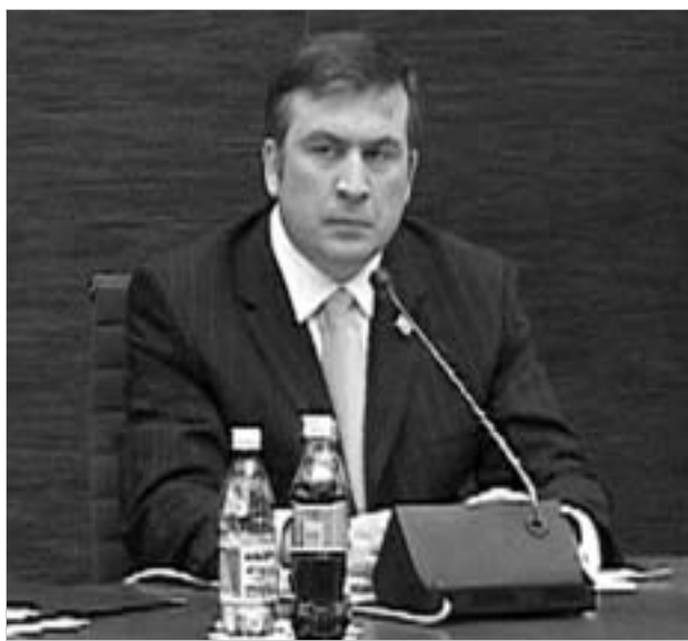
პრეზიდენტი მთავრობის სხდომაზე. მისი მსჯავრდების შემდეგ მისი მოხსენიება შეწყვეტილია.

ბიზნეს-აქტიურობა გავაუმჯობესეთ, ზოგადი ეკონომიკური ზრდა ათ პროცენტზე მეტია, რაც საკმაოდ მაღალი მაჩვენებელია, სახელმწიფო სამსახურის მიმართ დამოკიდებულება