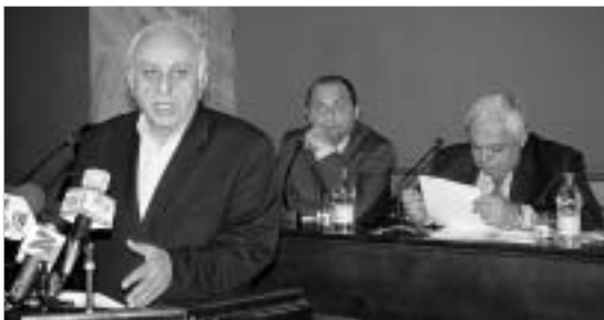
პარლამენტი დარგობრივი ეკონომიკისა და ეკონომიკური პოლიტიკის კომიტეტი ენერგეტიკულ უწყებებს რეკომენდაციებს აძლევს.