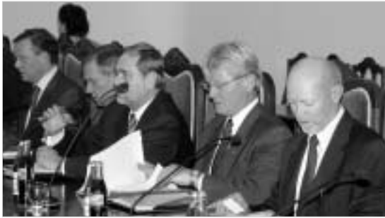
საქართველო გულმოდგინედ ცდილობს თავისი "სამეგობრო წრის" გაფართოებას, რათა ევროპულ ოჯახში მტკიცედ დამკვიდრდეს.