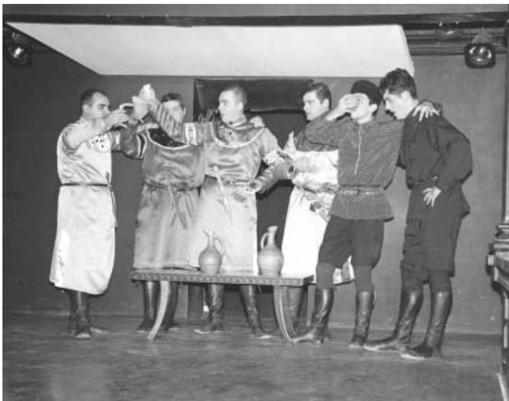
სპექტაკლი, რომელიც დაახლოებით ორი საათი გრძელდება, თითქმის ყველა ქართულ ხალხურ სიმღერასა და ცეკვას მოიცავს, რომელთა ერთობლიობის საერთო ქარგში მოცეკვასაც შეეცადა რეჟისორი გიორგი სიხარულიძე.

სპექტაკლის ქორეოგრაფი კი რეჟისორულ ჩანაფიქრს გულმოდგინედ ყველა კუთხის ცეკვით აგებს, ისე, რომ გამორჩენილი არც ერთი არაა. სვანური, მიულური, ოსური, ფშაური, რაჭული და სხვა - ცეკვა-სიმღერა ერთიმეორეს ენაცვლება და თან რთველისა და ქართული სუფრის ტრადიციებს გვიამბობს. სცენაზე მოცეკვავებისა და მომღერლების მონაცვლეობა ტემპერამენტული ქორეოგრაფიული სცენებისგან ოდნავ დაბაზულ და საკმაოდ დაღლილ მაყურებელს სულისმომთქმის საშუალებას აძლევს. ამ მხრივ ყველაზე საინტერესო ჭაბუკა ამირანაშვილის მიერ დამუშავებული ორი მუსუკალური ნომერია, რომელსაც სცენის სხვადასხვა კუთხეში ჩამოხდარი მუსიკოსები სხვადასხვა საკრავზე ასრულებენ.