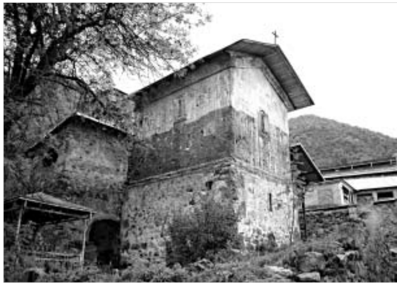
ლაღამის წმინდა გიორგის ტაძარი.