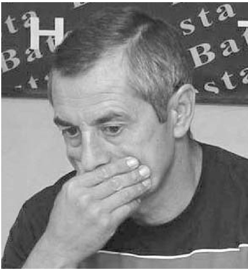
ყირესის საკადრო პრობლემები აქვს.

უკრაინელთა მთავარი დამრტყმელი ძალა, მოგვხსენებთ, ანდრე შევჩენკოა. გაერცხვლდა ხმები, რომ უკრაინის ფეხბურთის ფედერაციასა და "მილანს" შორის არსებული შეთანხმების მიხედვით, შევჩენკოს საქართველოს ნაკრებთან მატჩში მხოლოდ ერთ ტაიმს, ან სა-