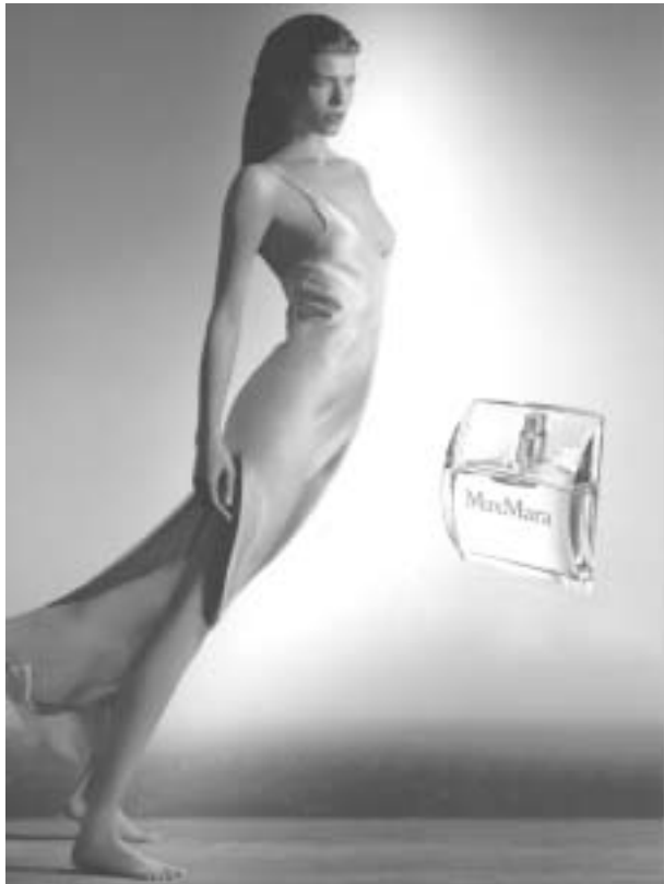
ვინც მოდის ჩვენებებს თვალს, მათთვის “მაქს მარა” ნამდვილად მეფურთხე სახელია.