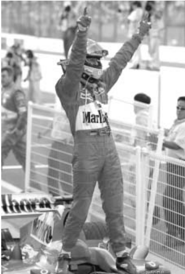
მიხაელმა გამარჯვება ბოლიდზე ახტომით აღნიშნა.

რაც შეეხება პროგნოზებს, ყოფილი პრიტანელი მრბოლის მარკ ბლანდელის აზრით, ყველაფრის მიუხედავად, სუძუკაზე "ფერარის"