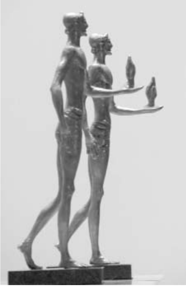
მთავარი “პრომეთე” ირანში გაემგზავრება.

სწრაფად ჩაიარა. ტრადიციისამებრ, მაყურებელს, კინოთეატრი “ამირანი” (ფესტივალის ძირითადი სპონსორი) და კინოს სახლი მასპინძლობდა. თუმცა, წელს, გოეთის ინსტიტუტის საპროექციო დარბაზი და კინოსახიობთა თეატრიც დგემატა; გოეთის ინსტიტუტი, სადაც დიდი გერმანელი მსახიობის კარლ ვალენტინის რეტროსპექტივა მიმდინარეობდა და კინოსახიობთა თეატრი, რომელმაც, როგორც ჩანს, უკვე ათთვისა კინოდარბაზობის ფუნქციაც, სადაც რამოდენიმე თვის წინ, სტუდენტური ფილმების ფესტივალი “სესილი” გაიმართა. წელს კი საქართველოს კინემატოგრაფიის ეროვნული ცენტრის ბაზაზე შექმნილი ფილმები უჩვენეს. პირველი სიყვარული - ეს იყო ის ჯადოსნური სიტყვები, რომლის გარშემოც ტრიანტედა 15 წუთიანი ფილმები. მათ შორის, საუკეთესო, გიორგი ოვაშვილის ფილმი იყო “ზღვის დონიდან”. უსიტყვო, მუნჯი, მაგრამ სავსე პირველი სიყვარულის სეტყაო, სუფთა გრძნობებით. თავისუფალი ყოველგვარი მოქმედებისგან, რომელიც სულ უფრო და უფრო გიორგვდა “თამაშში”. ნამუშევარმა, რომელმაც ზაფხულში მარკოს კინოფესტივალზე “სამხრეთი-სამხრეთი” გრამ-პრი აიღო მოკლემეტრაჟიანი ფილმებში, “პრომეთეს” ფარგლებში ჩვენების შემდეგაც უამრავი მიწვევა მიიღო. მაგრამ, რაც ყველაზე მთავარია, გიორგი ოვაშვილის ფილმი თებერვალში “პანორამის” პროგრამით ბერლინის საერთაშორისო კინოფესტივალს ეწვევა.