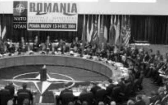
ჩრდილოატლანტიკური ორგანიზაცია ერაყის კამპანიაში აქტიურ მონაწილეობას არ იღებს, თუმცა აშშ-ს ინიციატივით ჩამოყალიბებულ კოალიციაში ნატო-ს წევრი სახელმწიფოებიდან ბევრი წარმოდგენილი.