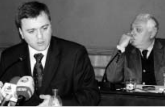
2005 წლის სახელმწიფო ბიუჯეტის პროექტის განხილვის პროცესით პარლამენტარები უკმაყოფილონი არიან.