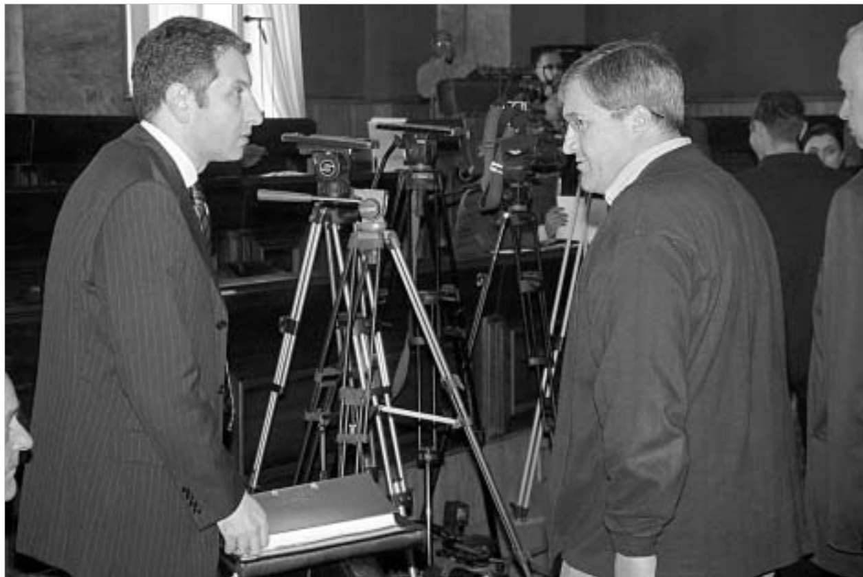
გივი თარგამაძეს რჩება შთაბეჭდილება, რომ ნოლიდელი და თავდაცვის სამინისტრო არასათანადოდ თანამშრომლობენ.