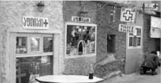
სამინისტრომ ბოლოს რეიდი ფარმაცევტულ ბაზარზე 2002 წელს ჩაატარა და დაადგინა, რომ პრეპარატების 60 პროცენტი ნორმებს არ აკმაყოფილებს.