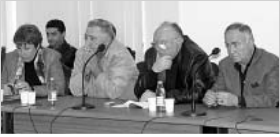
არ გადავიხდით წყლის გადასახადს, სანამ იგი ძველ ნიშნულს არ დაუბრუნდება. ნუ შექმნით დაძაბულობას ხელოვნურად, - აცხადებენ ბიზნესმენები.

ბიზნესმენები წყლის ტარიფის ძველ ნიშნულზე დაბრუნებას მოითხოვს