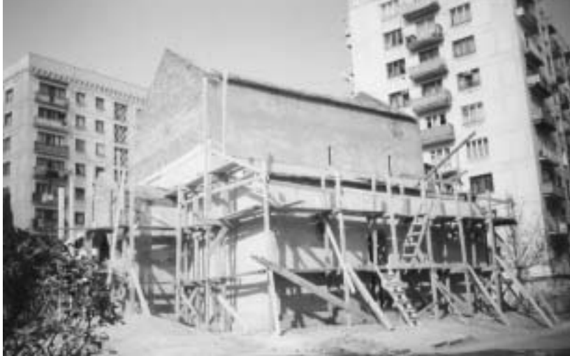
წმ. გიორგის სახელობის ეკლესია დიდებულში სამტრედიის ქუჩაზე

ქრისტიანობის ადრეულ საფეხურზე შეიქმნა. ცალნავიანი ეკლესიების მარტივი ფორმები მათი სწრაფი ამენების საშუალებას იძლეოდა. ამ ტიპში ყველაზე დიდხანს გაძლიერდა. დარბაზულმა ტიპის ეკლესიებმა XVIII საუკუნემდე იარსება. ამ ტიპის, როგორც ვარაუდობენ მეცნიერები, საერო არქიტექტურა - საცხოვრებელი დარბაზი უდევს საფუძვლად. კონკრეტულად ჩვენში კი "გლეხის დარბაზი". ამას გარდა ფაქტია, რომ დარბაზული ტიპი ყველაზე მობილური იყო ყველა ერის ხალხისათვის, ყოველთვის. შესაძლოა, ამით უნდა ახსნათ ამ ტიპის მსგავსი ახალ ეკლესია-ნაგებობების სიმრავლე თბილისშიც.