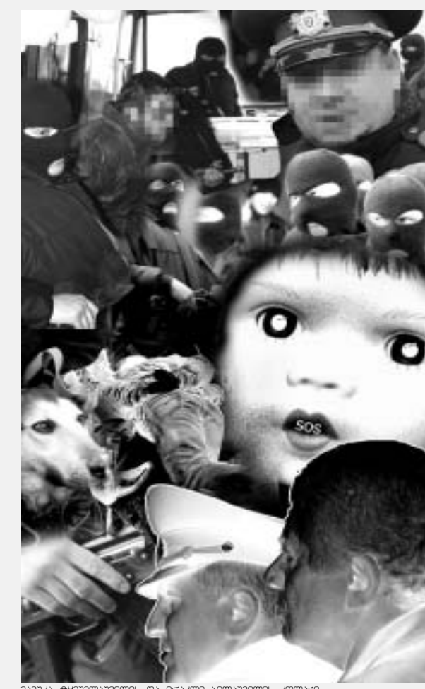
ამასა ჭაბუკიანი/მოსკოლი და ირანული ბილბორდები, კოსტაი

დაგვირეკეთ: 20-24-24; ელ. ფოსტა: dkuprava@24hours.ge მოგვწერეთ: თბილისი ვაჟა ფშაველას 45, გაზეთი "24 საათი" - დალი კუპრავა მამადი ბაბარი ბაბოვა 1 ნოვარია