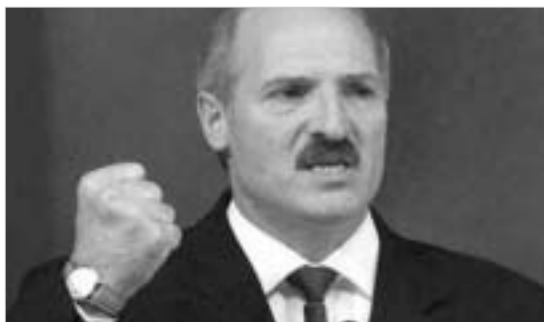
"ევროპის უკანასკნელმა დიქტატორმა" სარჩევნო უბნებზე მისულ ხალხს საჩუქრები და 20-30 პროცენტის ფასდაკლებით პროდუქტები დაურიგა.