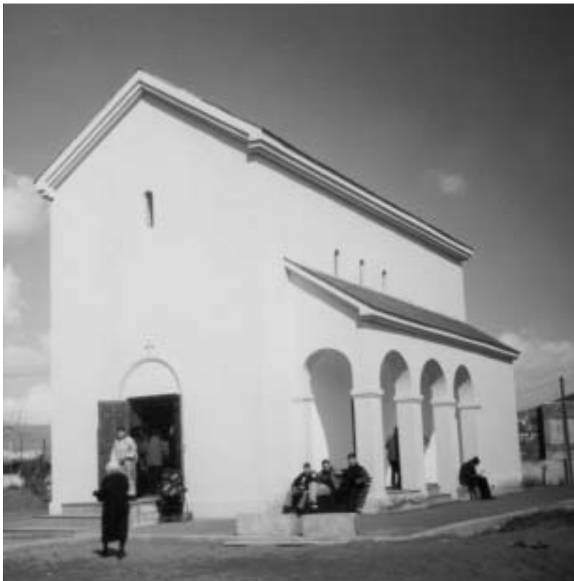
წმ. ლაზარეს სახელობის ეკლესია ძველი კონსტანდინის ტერიტორიაზე