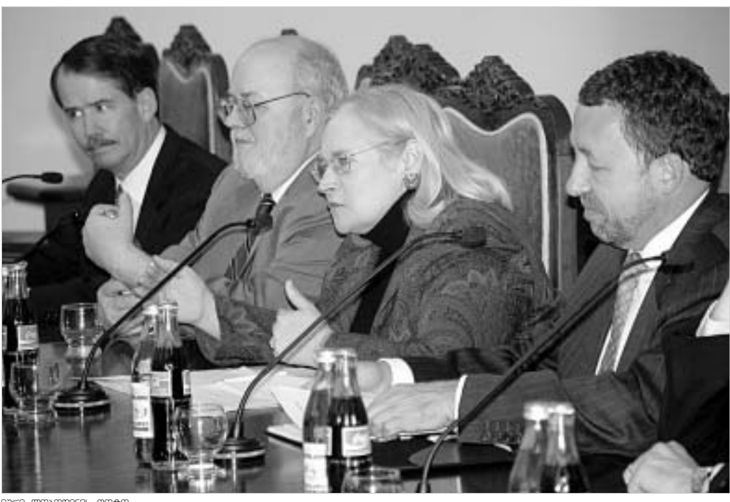
ილია ლაშრონიანი ფორი

უცხოელი დიპლომატები საქართველოს პარლამენტის თავმჯდომარესთან შეხვედრაზე.