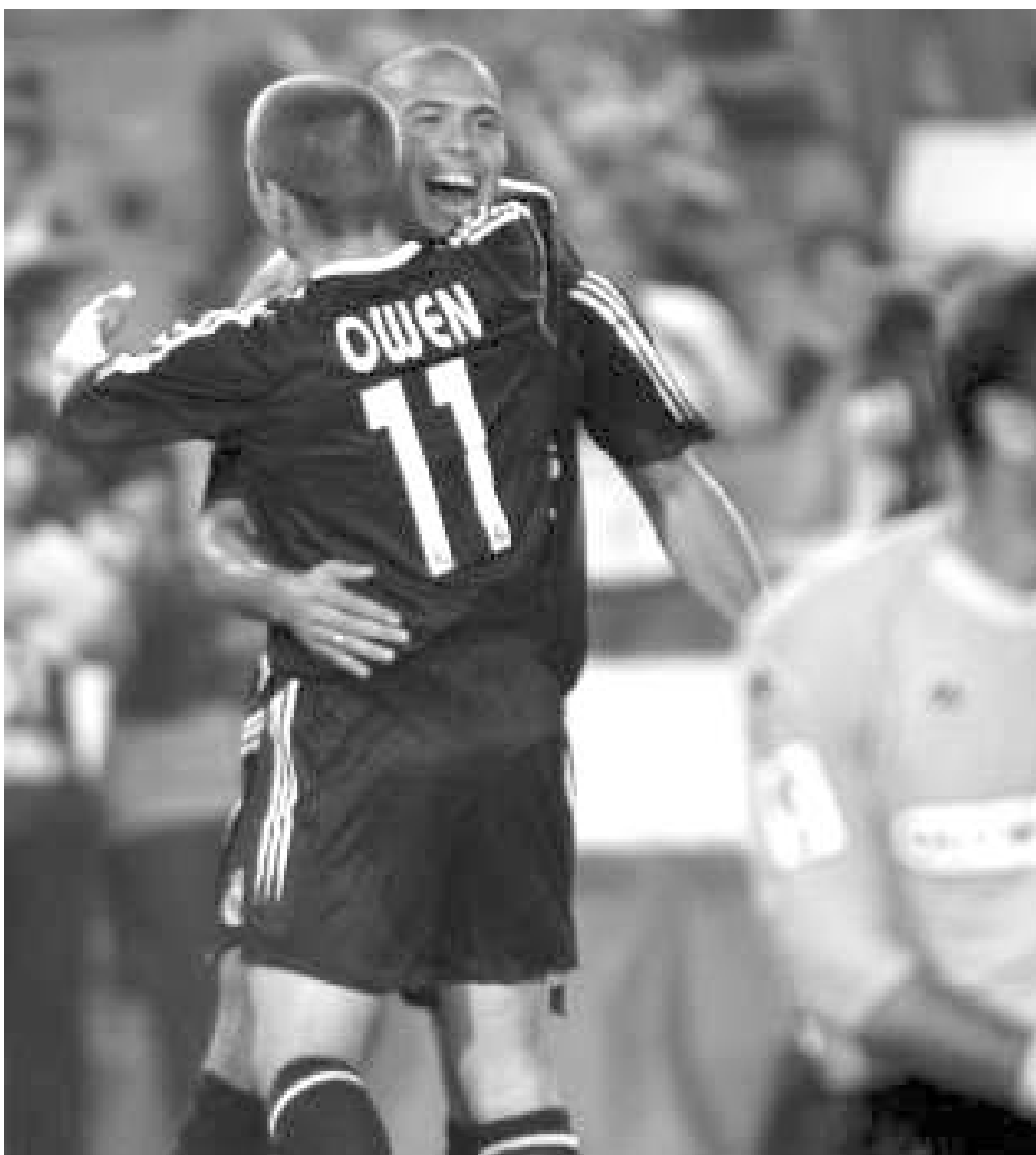
შაბათს რონალდო "ხეტისთან" შეხვედრაში "რეალს" გადაარჩინა. დღეს კი "სამეფო კლუბს" აუცილებლად გამარჯვება სჭირდება.