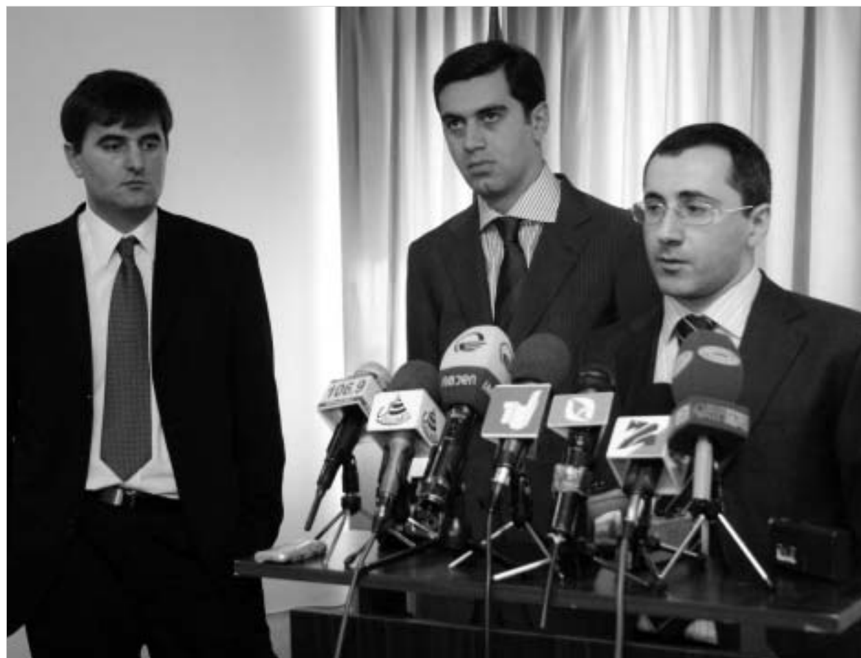
წამების წინააღმდეგ ბრძოლის ახალი ეტაპი იწყება.