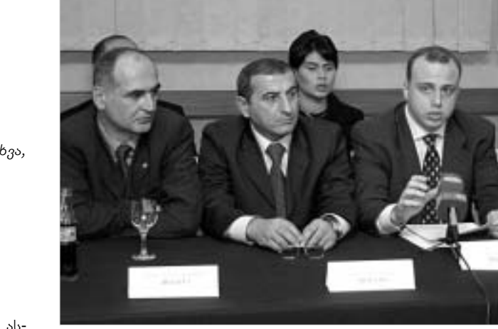
ავტომობილების იმპორტირება ასოციაცია ახალ საგადასახადო კოდექსს აპროტესტებს.

ავტომობილების იმპორტირება ასოციაცია, რომელიც საქართველოში ავტომობილების ოფიციალურ იმპორტირებს 14 კომპანიას აერთიანებს, პროტესტის გამოთქვამს ფინანსთა სამინისტროს მიერ შექმნილ ახალ საგადასახადო კოდექსის პროექტში აღნიშნული საქმიანობისათვის ადგილსარეზერვაციო გადასახადების გამო. კერძოდ, კომპანიები თვლიან, რომ საგადასახადო კოდექსის შემუშავებისას (რომ აღარაფერი ითვას ურთიერთსაგარეშოდ, ერთობლივ მუშაობაზე) საჭირო იყო, უბრალოდ, მათი აზრით მოესმინათ, რათა ადგილი არ ჰქონოდა ავტომობილების იმპორტირება საქმიანობის ყოველდღიურად დაუსაბუთებელ და გაუმართლებელ შუღლდევებს - ამჟამად მოქმედი ვეტეტური გადასახადის შეცვლა აქტიურად (7 პროცენტით) და დღგ-ს (18 პროცენტით) გადასახადით. მთავარი, რაც გაუბნინა, ავტომობილების იმპორტირება ასოციაციის მიერ გამართულ სპეციალურ პრესკონფერენციაზე დაფიქსირდა, ის გახლავთ, რომ ეკონომიკურად გაუმართლებელია ფინანსთა სამინისტროს მიერ შექმნილი საგადასახადო კოდექსის ახალი პროექტი და უკუფიქსირებას გამოიწვევს. კერძოდ, სახელმწიფო ბიუჯეტში დადებითი ნაცვლად უარყოფით შედეგს მიიღებს. ძველი (2002 წლის მარტამდე) დღგ-ს რეჟიმით დაბეგრის დროს სახელმწიფო ბიუჯეტში ყოველთვიურად საშუალოდ 650 ათასი ლარი შედიოდა, ამჟამად კი ეს თანხა 2 მილიონამდე ღარს შეადგენს. ახ-