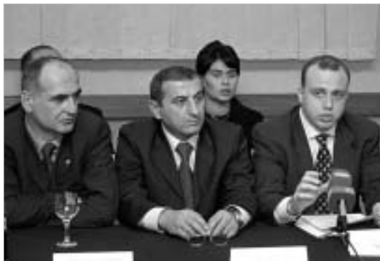
ავტომობილების იმპორტიორთა ასოციაცია ახალ საგადასახადო კოდექსს აპროტესტებს.

ახალმა საგადასახადო კოდექსმა ქვეყანაში ბიზნესის განვითარებას ხელი არ უნდა შეუშალოს