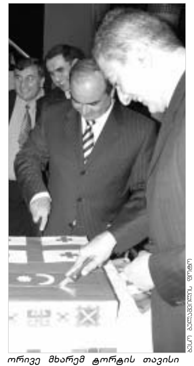
ორივე მხარეც ტორტის თავისი ნაწილი აჭრს.